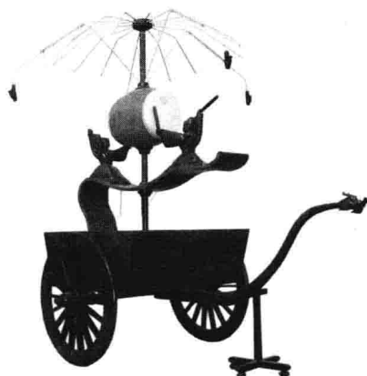
图 2.3 记里鼓车

陆上交通运输工具也有很大的发展。1980年出土的秦始皇陵铜车马代表了当时铸造技术、金属加工和组装工艺的水平。东汉以后出现了记里鼓车(见图2.3)和指南车(见图2.4)。记里鼓车有一套减速齿轮系,通过鼓镯的音响分段报知里程。三国马钧所造的指南车除用齿轮传动外,还有自动离合装置,在技术上又胜记里鼓车一筹。自动离合装置的发明,说明传动机构齿轮系已发展到相当的程度。