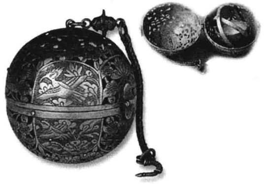
图 2.2 被中香炉

1—都柱；2—八道；3—牙机；4—龙首；5—铜丸； 6—龙体；7—蟾蜍；8—仪体；9—仪盖；10—地盘