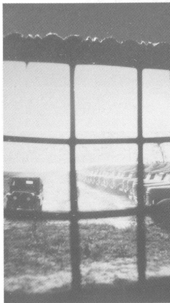
野营帐篷城