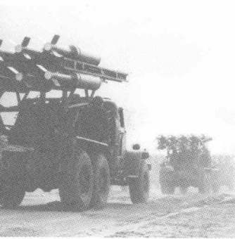
火箭布雷车奔赴发射地域