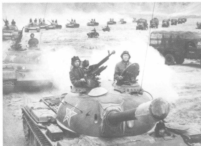
激战中“红军”二梯队加入战斗