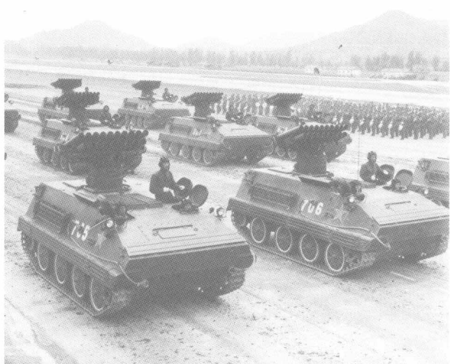
自行火炮方队接受检阅通过主席台