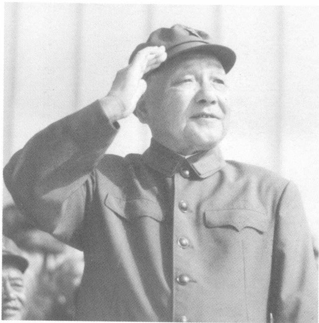
邓小平、胡耀邦等党和国家领导人在华北军事演习阅兵主席台上检阅部队