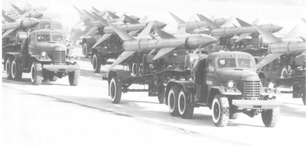
地空导弹方队通过主席台接受检阅