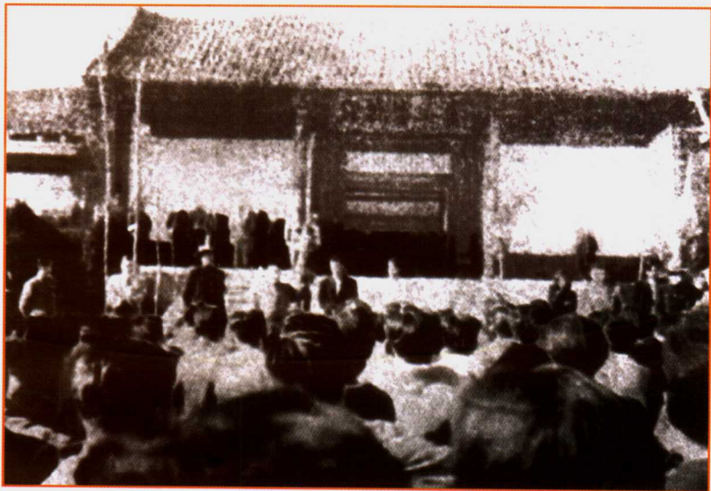
解放前夕,贵阳学界师生争民主,反饥饿斗争此起彼伏。图为贵州大学反饥饿示威游行队伍在省政府门前静坐示威。