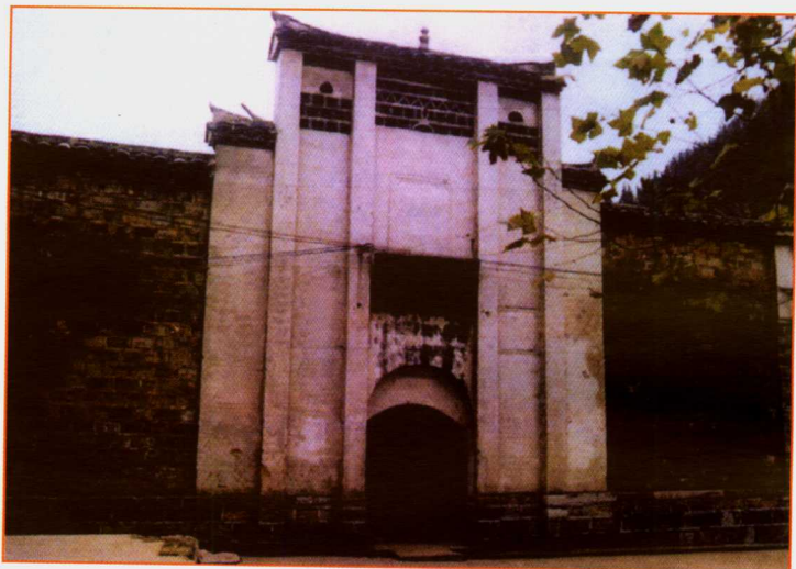
红二、红六军团木黄会师纪念馆