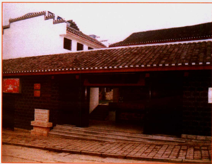
中共贵州省工委旧址