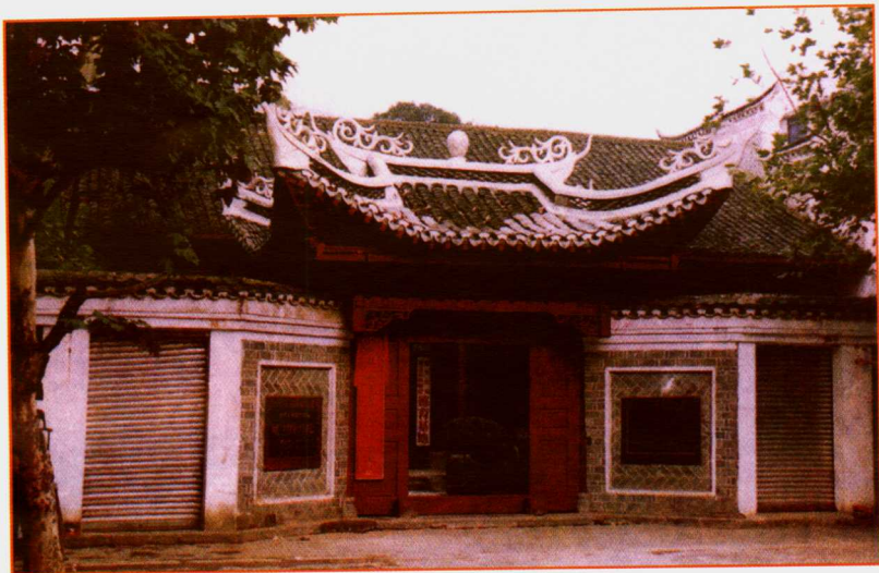
中国工农红军第七军军部旧址 (榕江县城)