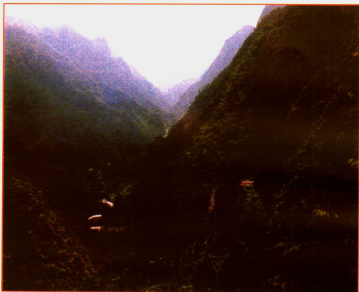
娄山关红军战斗遗址