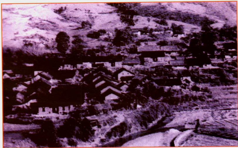
中共黔桂边委驻地 (望谟板陈)