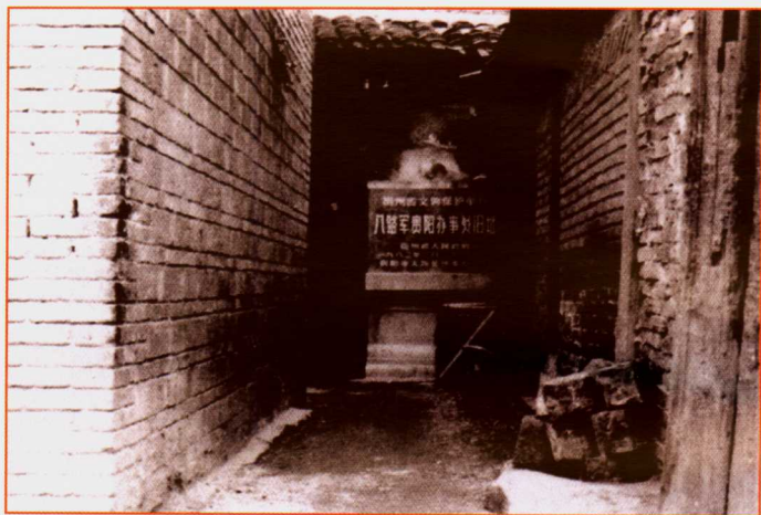
八路军贵阳交通站