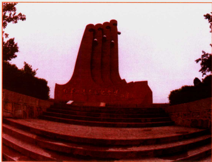
红军四渡赤水纪念碑(仁怀)