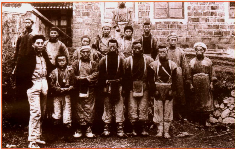
长征途中王震同志（左一）与苗族同胞在毕节天主堂的合影。