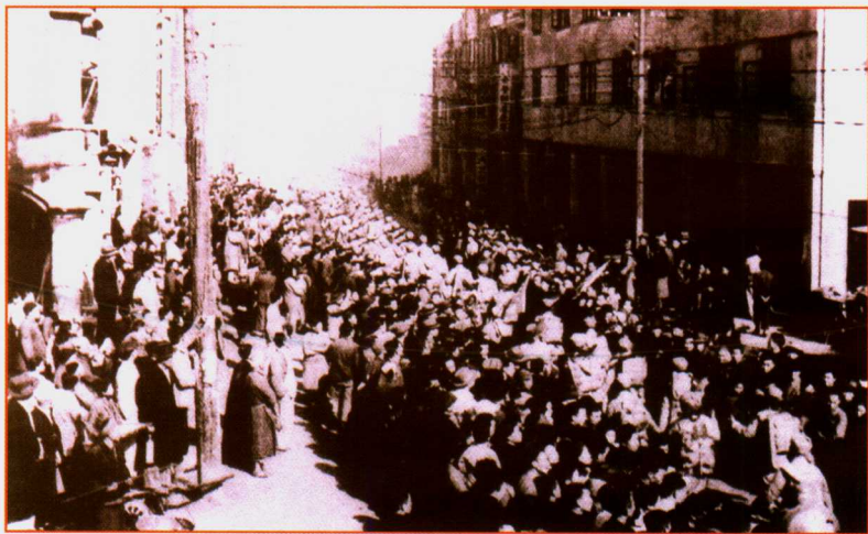
1949年11月15日，人民解放军进入贵阳。