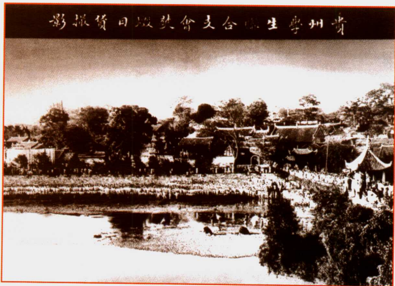
“五四”运动期间，贵阳爱国青年学生在南明河畔焚烧日货。