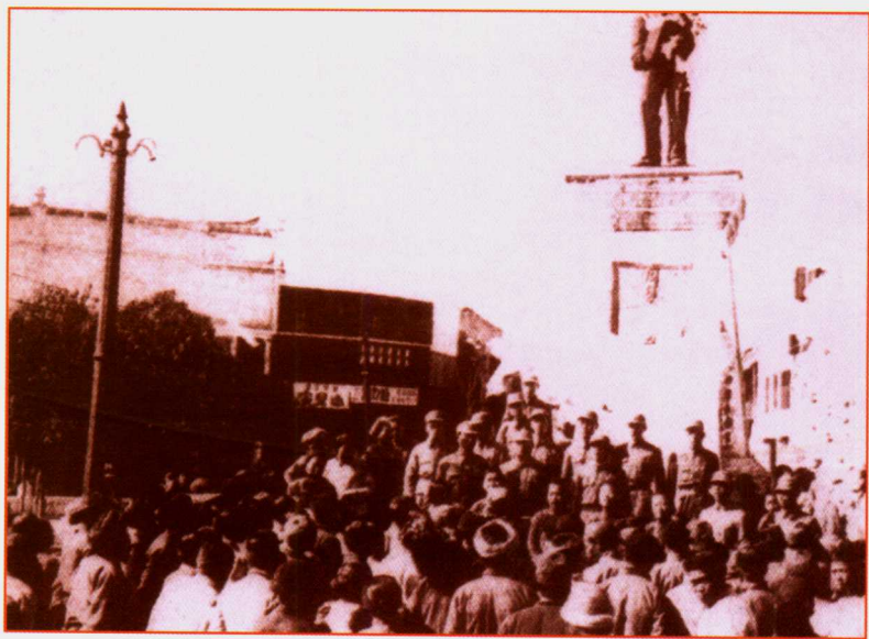
大夏大学演讲队在贵阳街头进行抗日宣传。