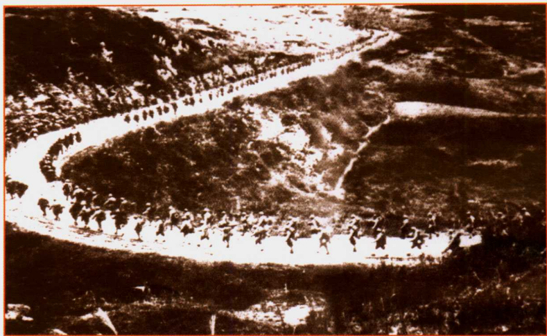
二野五兵团进军贵州途中。