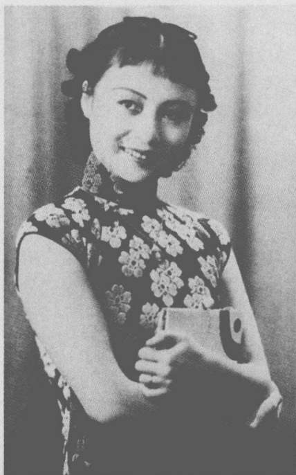
早期武侠明星范雪朋