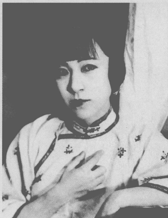
早期女明星王汉伦