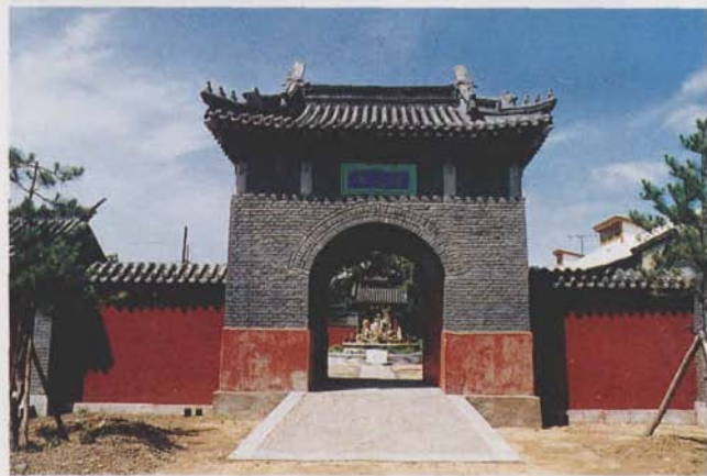
河北省山海关清真古寺大门