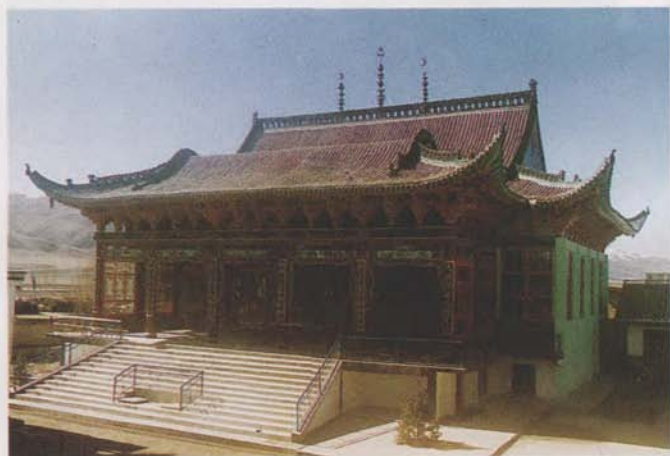
四川省阿坝县清真寺大殿