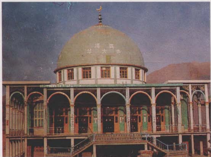
甘肃省临潭县华大寺