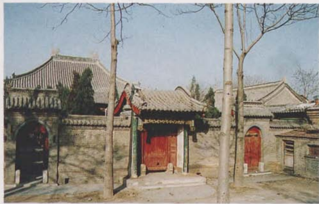
河北省定州礼拜寺