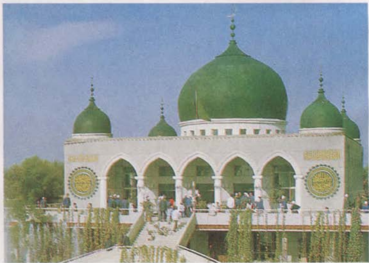
宁夏银川南关清真寺