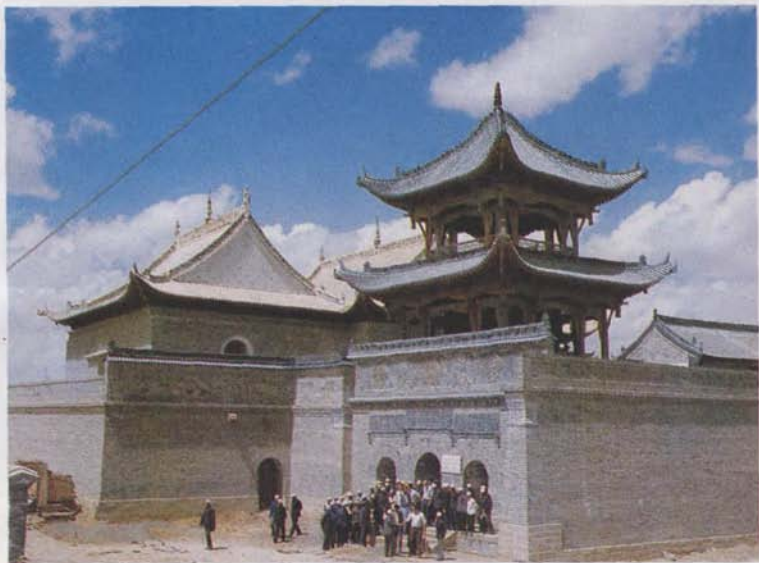
宁夏同心清真大寺