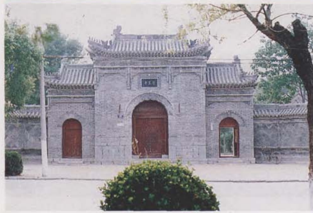
山东省青州城里寺