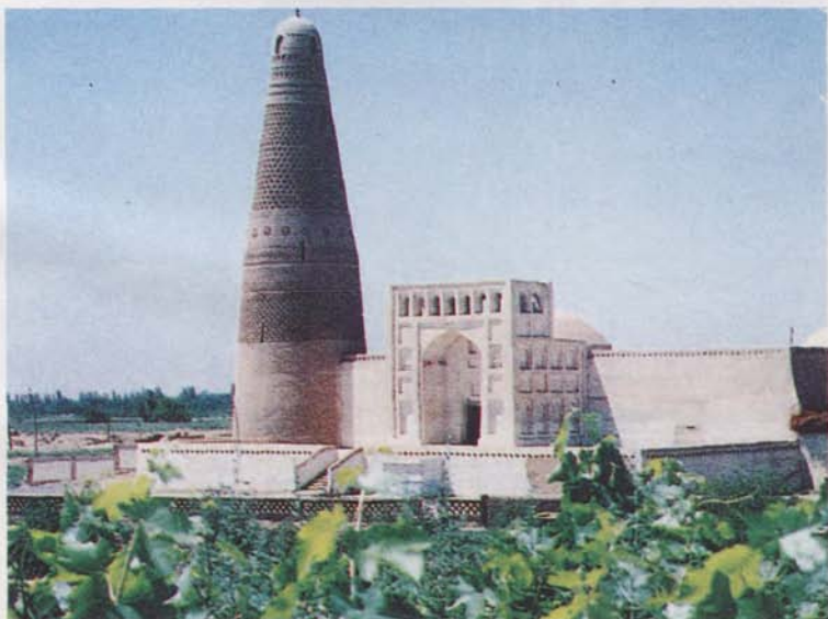
新疆吐鲁番苏公塔礼拜寺