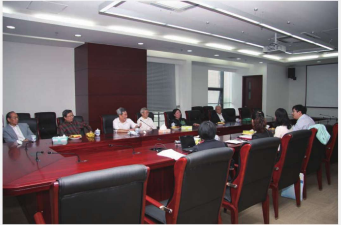
采集小组在访谈中