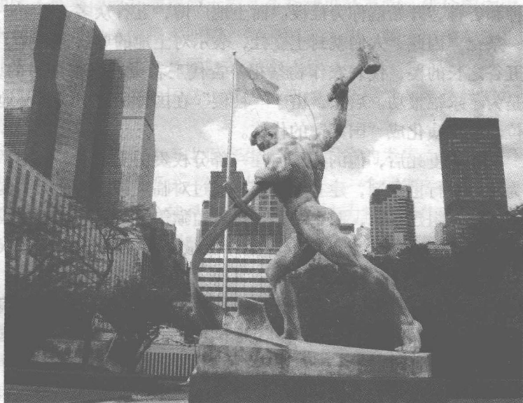
在联合国总部广场上“铸剑为犁”的雕塑引人注目

在联合国总部广场上，有一尊引人注目的雕塑：一个人左手握着一柄剑，右手高举铁锤，正在把剑锻打成犁。这尊“铸剑为犁”的雕塑可谓寓意深远，象征着全世界人民盼望“化干戈为玉帛”的美好愿望，但愿望还不是现实。人类迈入了21世纪，伴随着新世纪钟声的并不都是人们向往的和平圆舞曲，而仍然有战争的枪炮声。