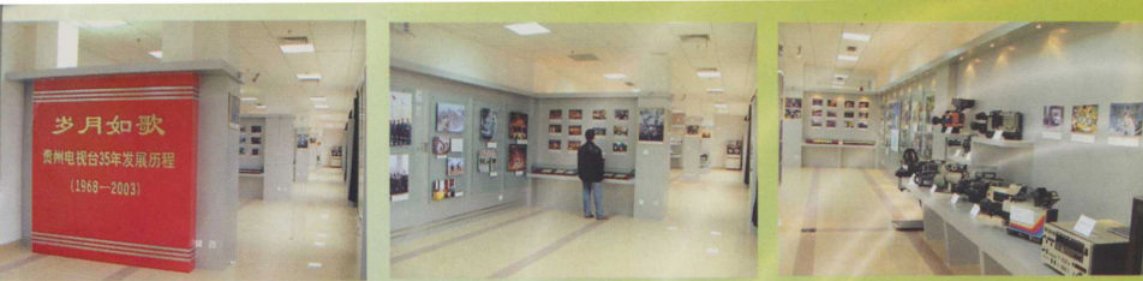
贵州电视台35周年台史展