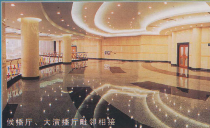
候播厅、大演播厅毗邻相接