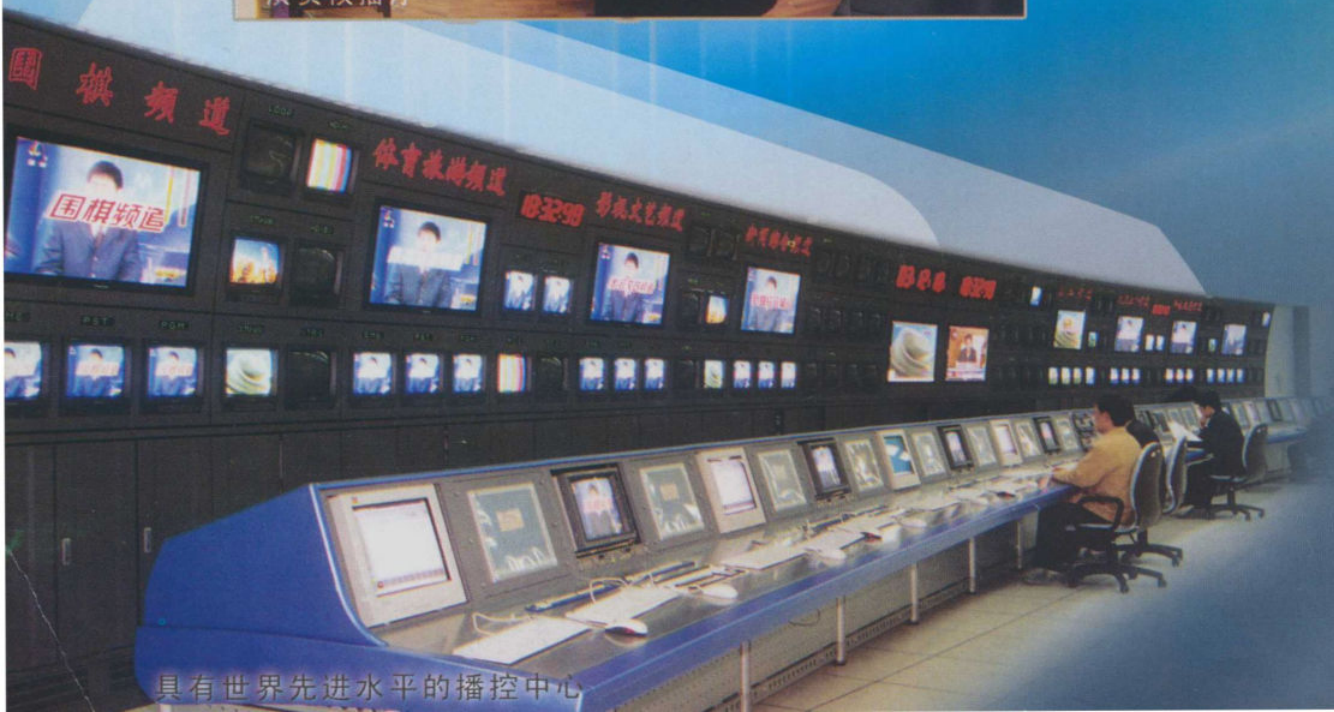
具有世界先进水平的播控中心