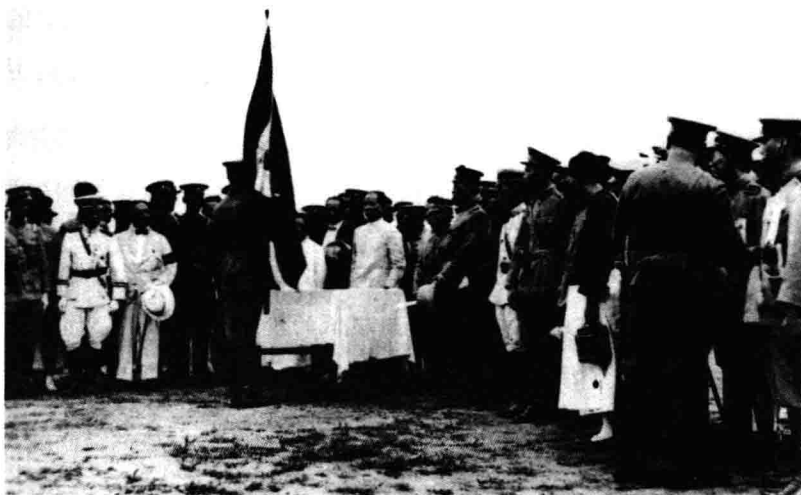
1924年6月29日，孙中山赴广州北校场，检阅广东警卫军、广州武装警察、广州商团联合会操。

一个村一个村的“团练”，基本上都是几十到一百人的规模，而且其组织的宗旨十分明确——自卫防匪。这种武力并不以颠覆中央政权为目的，也不具备颠覆中央政权的能力，所以，无论清政府，还是孙中山、龙济光，蒋介石，都是允许的。因为这些零散武装，都在政府的控制力之内，属于可控的武装——随你怎么闹，也跳不出我的五指山。