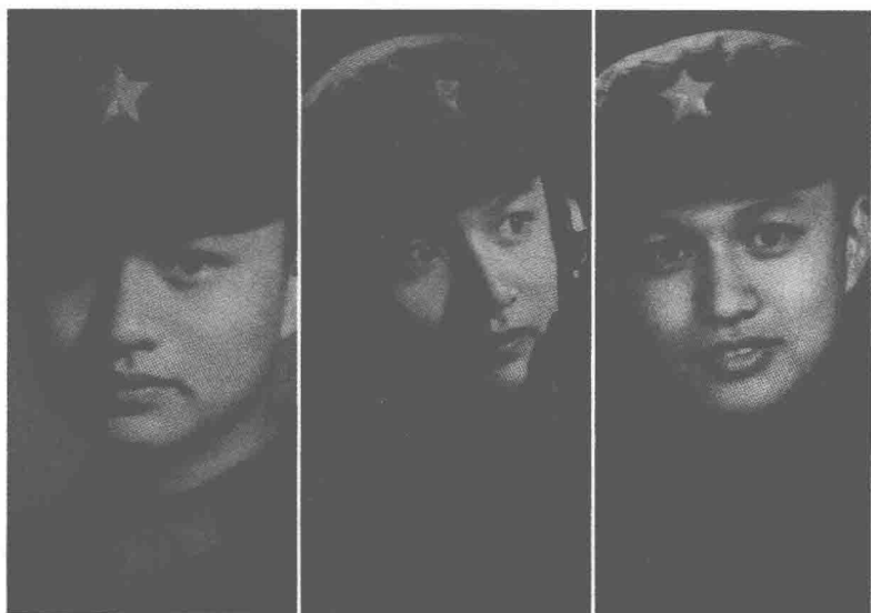
16岁，17岁，19岁，从新兵到老兵