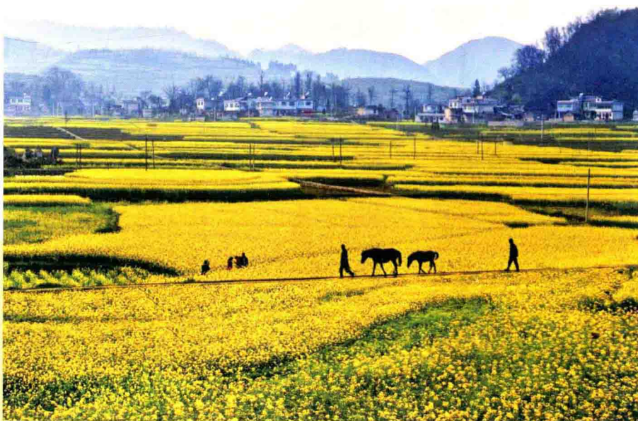
龙家镇油菜高产示范基地

2012年，全县农业农村工作按照“稳烟、增茶、促林、扩果蔬”思路，实现农林牧渔业总产值164055万元，比上年增长11.6%。内陆水域养殖面积3546公顷，水产品4270吨。兑现粮食生产补贴2950.5万元。兑现农机具补贴资金543.38万元。争取各类项目资金13377.24万元。