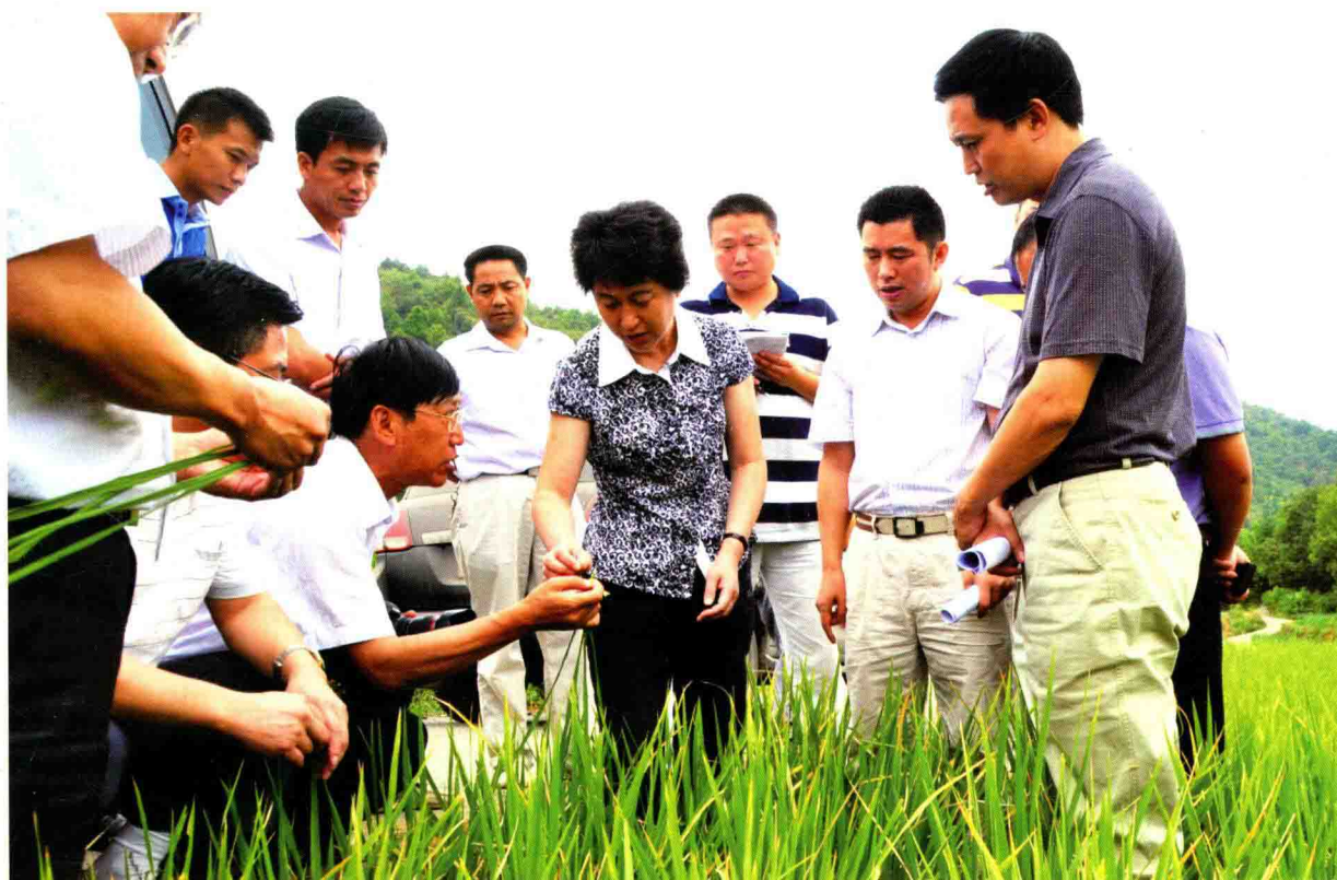
遵义市委书记喻红秋（右三）到余庆视察农业生产