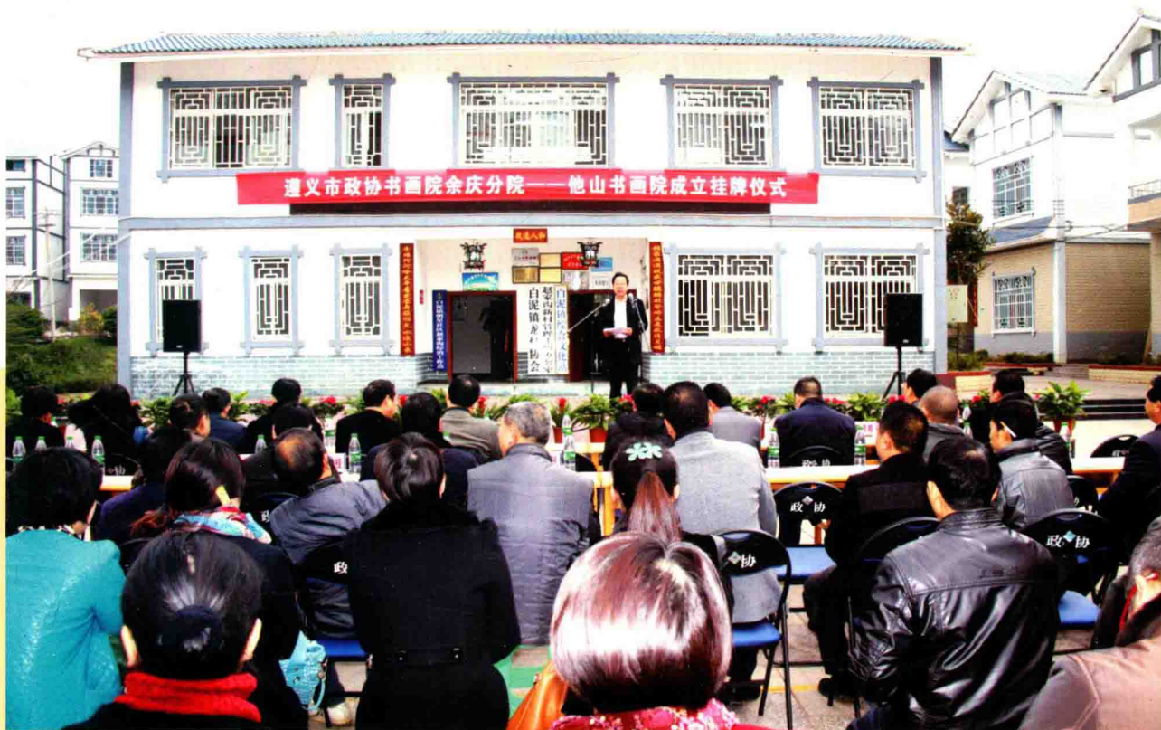
遵义市政协书画院余庆分院——他山书院成立仪式