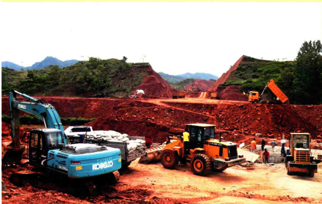
县城环城公路建设

2012年，全县地区生产总值36.6亿元，财政总收入4.52亿元，城镇居民可支配收入13423元，农民人均收入6163元。社会固定资产投资46亿元，上年增长14亿元。社会消费品零售总额10.7亿元，增长20.6%。