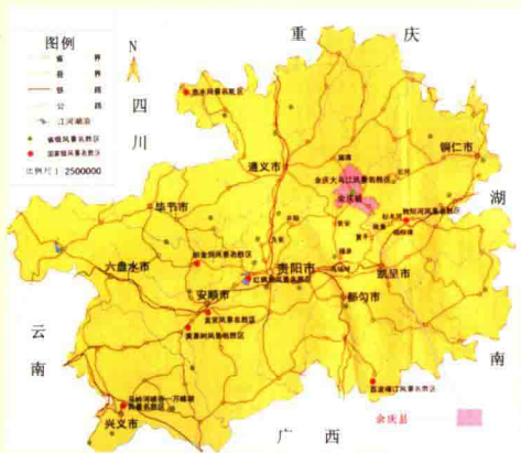
余庆在贵州省的位置