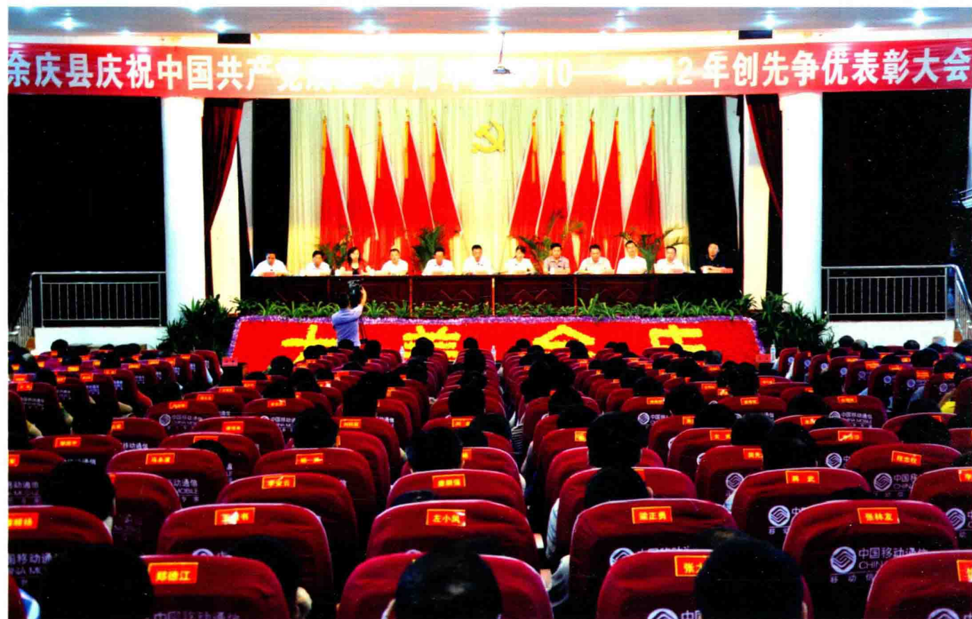
全县创先争优表彰大会