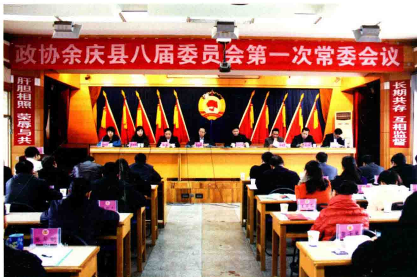
政协委员参政议政

2012年，政协余庆县委员会召开常委会议4次，主席会议7次，收集社情民意56条，办理委员建议和意见50件，其中立案48件，办复率100%。积极做好联系移民、“四帮四促”、“同心工程”等活动，实施项目30余个，落实帮扶资金千万元。