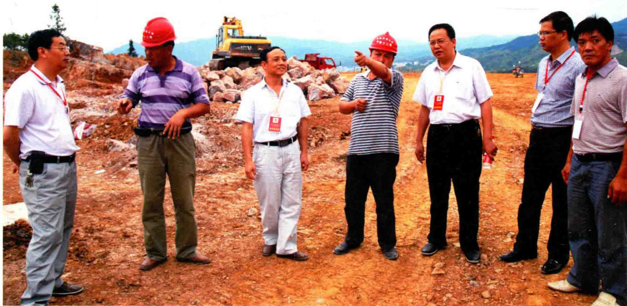
政协委员视察余凯高速公路建设