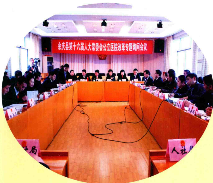
人大常委会开展专题询问工作