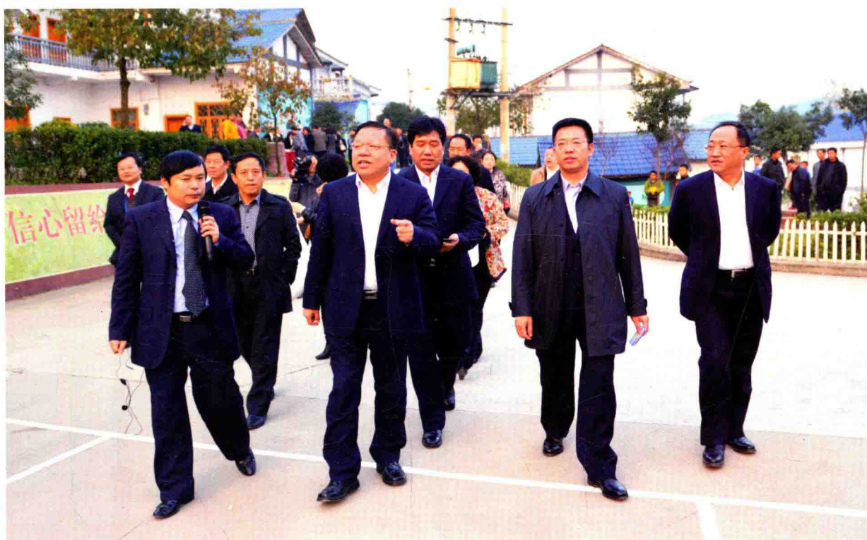
省人民政府副省长秦如培（前排左二）到余庆调研社会经济发展情况