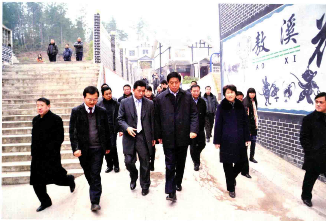
时任省委书记栗战书（前排右二）在放溪镇官仓村土司园“四在农家”创建点调研