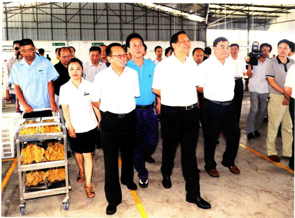
国家烟草专卖局局长姜成康（前排中）在余庆县调研烟叶生产工作