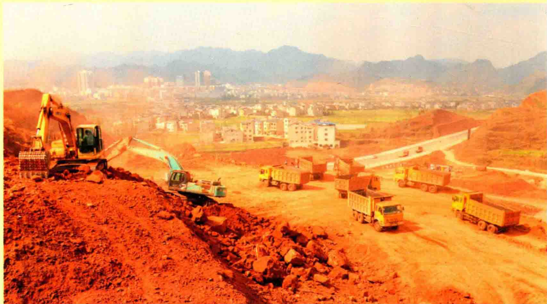
白泥镇产业园区建设启动

2012年，全县地区生产总值36.6亿元，财政总收入4.52亿元，城镇居民可支配收入13423元，农民人均收入6163元。社会固定资产投资46亿元，上年增长14亿元。社会消费品零售总额10.7亿元，增长20.6%。