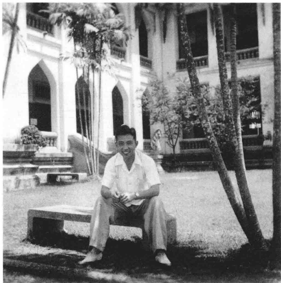
上图：1949年3月摄于泰国曼谷朱拉博功大学。 时任曼谷联合国粮农组织译员。