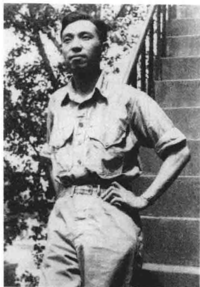
右上图：1942年初至1943年10月间。参加中国远征军入缅对日作战前后摄于昆明。