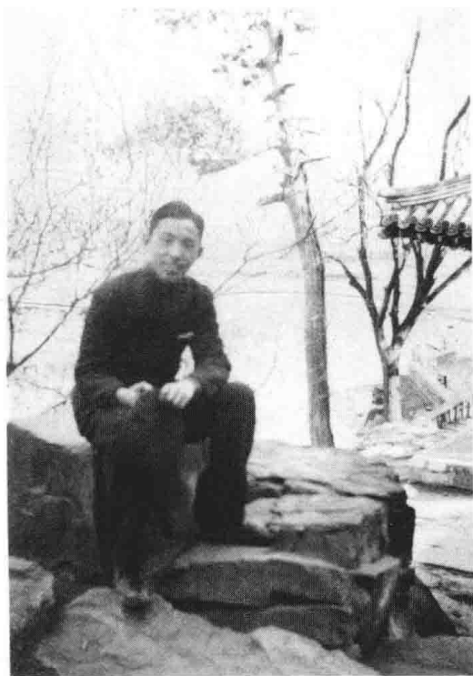
上图：南开中学时期，天津 宁园。