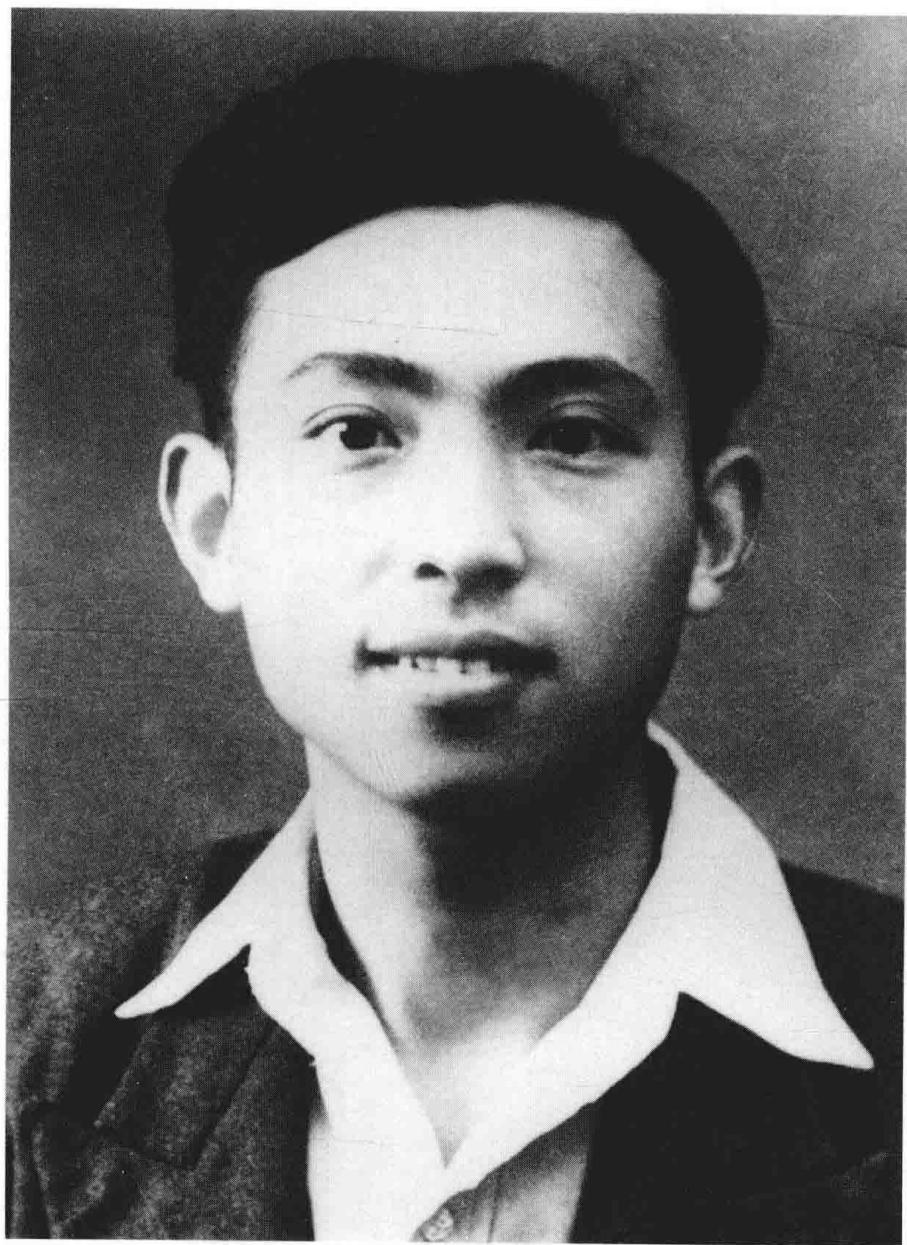
1935 至 1937 年北平清华大学期间。