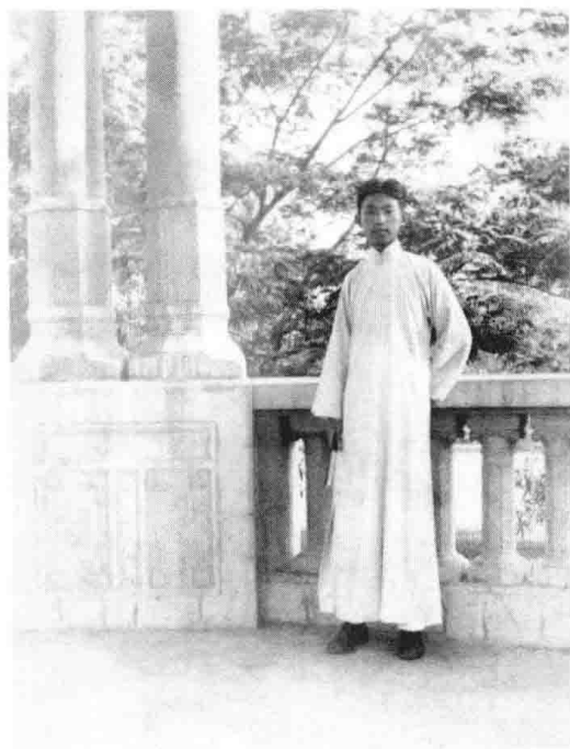
下图：1934年7月10日， 天津法国花园亭。