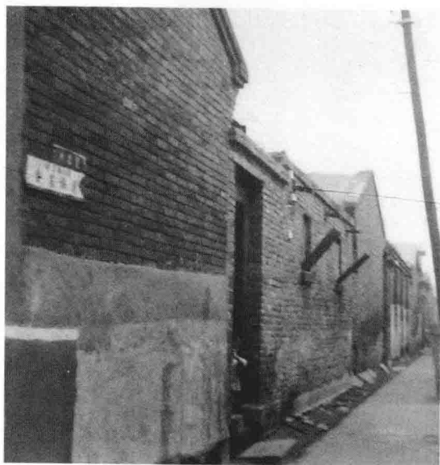
下图：天津西北角老城内恒德里南口（摄于1987年7月）。穆旦出生于恒德里3号，并生活在这里直到高中毕业。