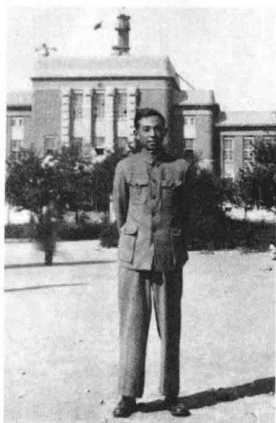
右下图：1943年至1946年间在重庆。