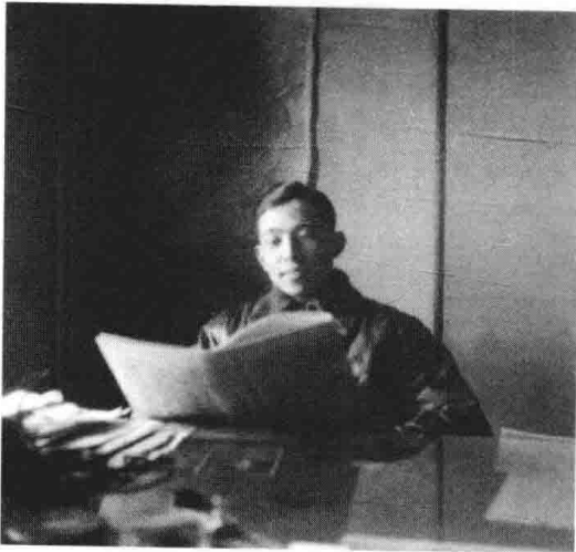
下图：“一九四七年二月 于《新报》，沈阳，报社 办公室。