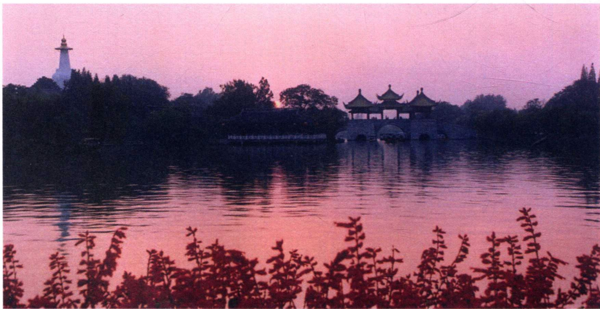
图1-1 秋色浓

确定画面的组成就是要确定主体和那些有关联的次要部分，它们通常被称为画面的主体与客体。然而，这些组成部分都是为表现意图——主题而服务的。因此，确定画面组成的前提是确定画面的主题。客体包括空白、前景、背景和陪体等画面要素，它们与主体常常被共同称为构图五要素。图1-1所示的是国家级名胜风景区——扬州瘦西湖中标志性景点五亭桥与白塔，这幅画面的立意是将五亭桥、白塔与整体环境作为共同主体，主题表现的是在湖光水色之中五亭桥与白塔遥相呼应的宏伟气势。如图1-2所示，虽然画面中也有白塔，但主要是五亭桥的具体形象，它所表现的是该景物的建筑风格和优美造型，蕴含的是它的文化与传说。