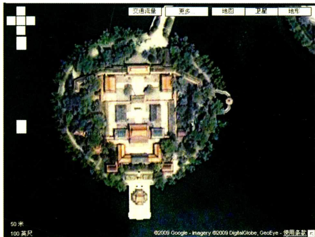
图1-9 谷歌地图（卫星照）截图“北京中南海局部” 谷歌地图截图。

卫星地图照表明人类利用摄影技术进行的遥感遥测学，已经相当成熟，并且广泛地服务于民用各业，下图是从“谷歌地图”（卫星照）上截图的“北京中南海（瀛台）”，从图片中可以清晰地看到地面建筑。瀛台始建于明朝，三面临水，衬以亭台楼阁，像座海中仙岛，是