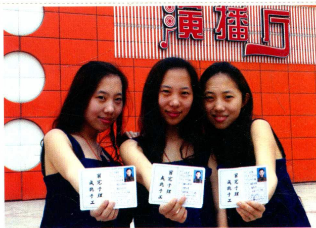
图1-1 三胞胎姐妹同时考入同一学校同一专业，领到“学生证”时的高兴心情。

人的一生，从出生到离世，始终都有介绍自己身份的各种证件相伴。学生证、工作证、驾驶证、医疗证、