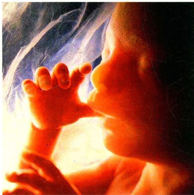
图1-6 《一个孩子的诞生》

医学摄影是利用照相机或摄影机、摄像机以及配套的后期处理设备对原始医学资料按不同用途所进行的记录、复制和加工过程。目的是为了真实、准确、及时、形象地为医疗、教学和科研提供并保存医学影像资料。医学摄影越来越多地应用到诊断及手术及治疗过程中，