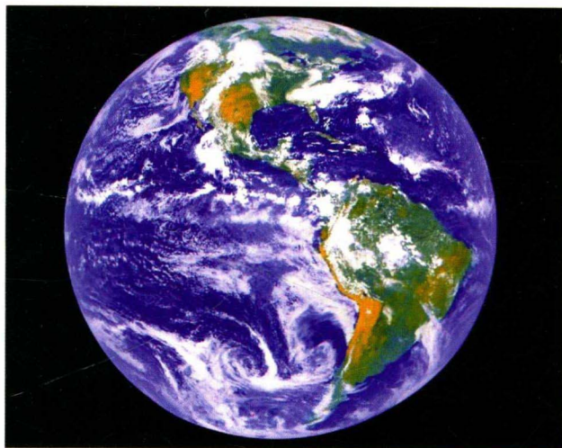
图1-3 从神舟七号上看到地球的美妙 神舟七号发布

飞向蓝天，飞出地球去观察地球、去探索太空是人类追求美好未来的共同梦想。2008年9月25日，我国航天员翟志刚、刘伯明、景海鹏同志乘坐神舟七号载人航天飞船成功进入太空，在顺利完成空间出舱活动和空间科学实验任务后，于9月28日安全返回地面。这次载人航天飞行圆满成功，实现了我国空间技术发展具有里程碑意义的重大跨越，标志着我国成为世界上第三个独立掌握空间出舱关键技术的国家。