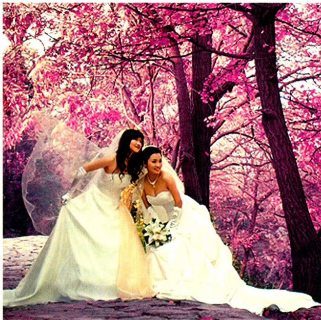
图1-8 “婚纱摄影”的观念，已经上升为女性对未来幸福的憧憬。

我国自改革开放以来，社会经济得到长足发展，人们的传统观念、消费观念也随之发生改变，婚纱摄影几乎已成为新人必须履行的模式，加之行业内的不断创新和竞争，婚纱摄影已经成为一个特殊的产业。仅从这个侧面，就反映出人民生活水平的不断提高以及他们更高的精神情感需求。