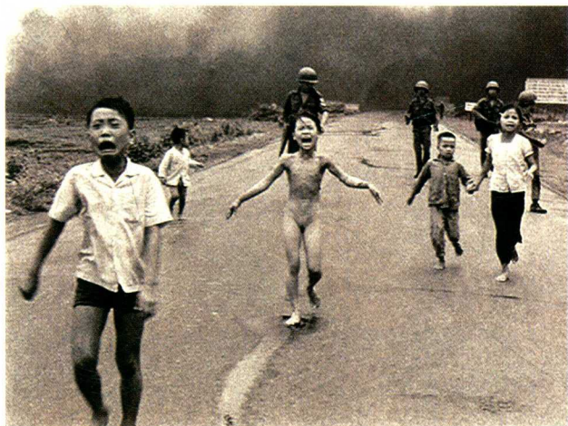
图1-7 《逃离美军燃烧弹袭击的孩子们》