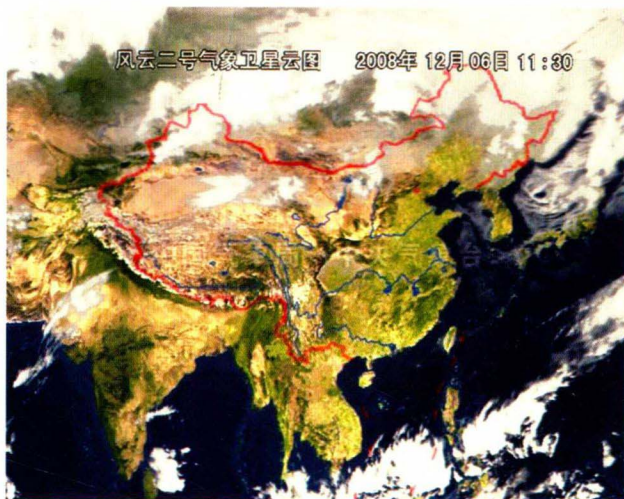
图1-4 风云二号气象卫星云图 中国气象局网

其实，卫星摄影远远不止对气象领域的应用，其他用于人们监测洪水泛滥、冰雪覆盖、地震灾害等方面同样会起到神奇的作用。