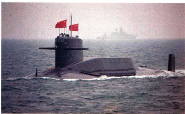
图1-2 长丰6号核动力潜艇，改装了更先进的固体燃料弹道导弹。

中国近代史上最屈辱的一页，就是从海洋开始的。从海上开始的屈辱，现在从海上结束。从潜艇图片中，人们可以充分解读到，中国国力的腾升，军事实力的强大，科学技术的领先。强大的祖国、强大的海军，每一个中国人都会由衷地感到欣慰和自豪。