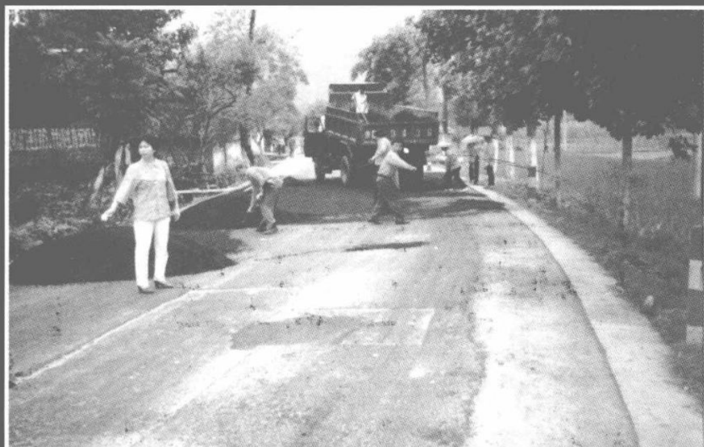
努力实现畅、洁、美目标