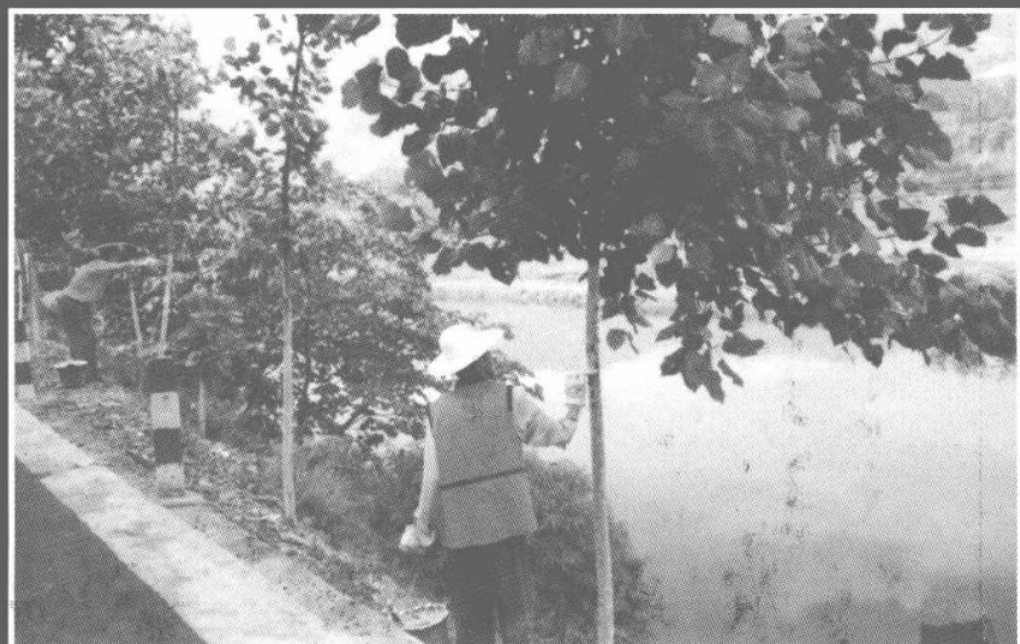
公路管理职工精心护理行道树