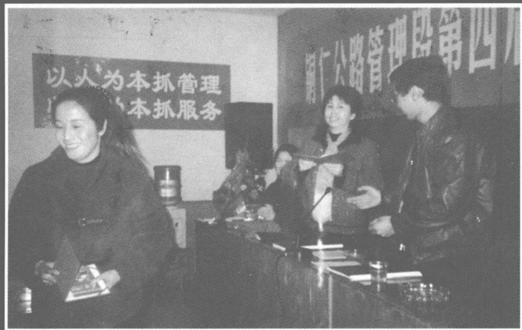
党政领导为先进个人颁奖