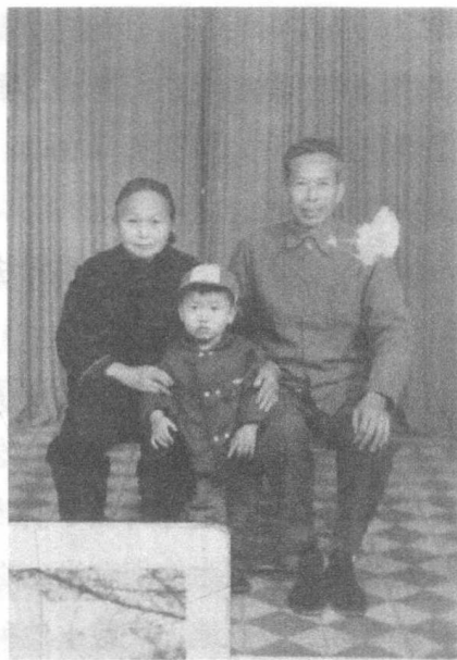
曾外祖母（左）、曾外祖父（右）、 外祖父（中）三人合影

报考空军做准备。结果出来，可喜可贺，两边皆通过考核：我如愿考上了西安的某所大学；空军体检结果也显示身体合格，符合入伍空军的条件。以往的空军选拔，都是在陆军中直接挑选合格人选，而我这一届，是第一届从学校挑选来参加空军的学生。我当时对飞行是很向往的，最终选择当一名飞行员。不久后，我进入西安第二航空预备学校进行飞行专业知识的学习与实际操作训练，一年以后，又转往位于牡丹江的第七航空学校继续深造。空军飞行员的重力测试，我一直是班级第一。1960年，我从学校毕业，被分配到部队，成为一名正式空军，也开始了我在丹东的军营生涯。