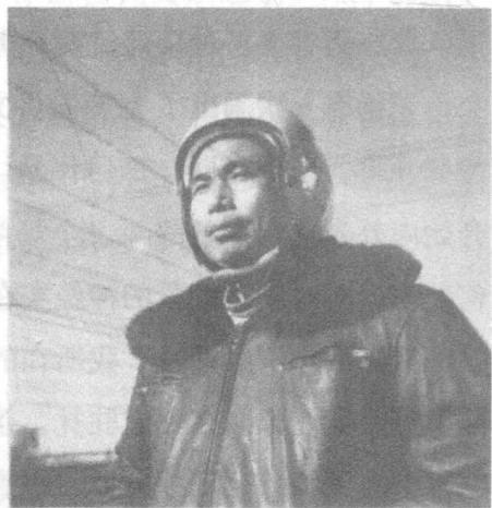
外祖父巫剑影飞行装