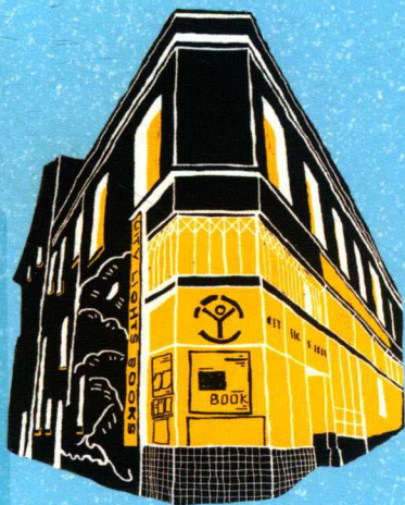
● City Lights Bookstore