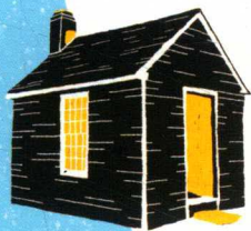
● Thoreau's House