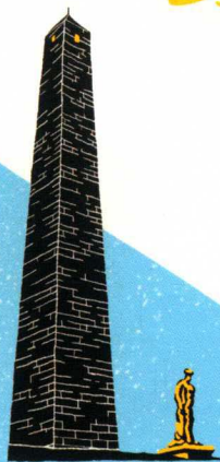
● Bunker Hill Monument