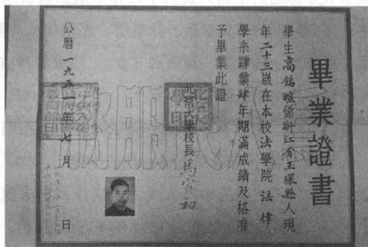
1951年7月，北京大学法律本科毕业证书

光灿等专家，先后起草了两个刑法文本：1950年7月的《中华人民共和国刑法大纲草案》和1954年9月的《中华人民共和国刑法指导原则（初稿）》。因为各种原因，这两个文本都未曾公开向社会征求意见，也没有正式进入立法程序。1954年9月，第一届全国人民代表大会第一次会议上，通过了第一部《中华人民共和国宪法》（以下简称《宪法》）和5个组织法。全国人大决定刑法起草工作正式由全国人大常委会办公厅法律室负责。彭真同志当选为第一届全国人大常委会副委员长兼秘书长，刑法起草和法律室的工作归他领导。