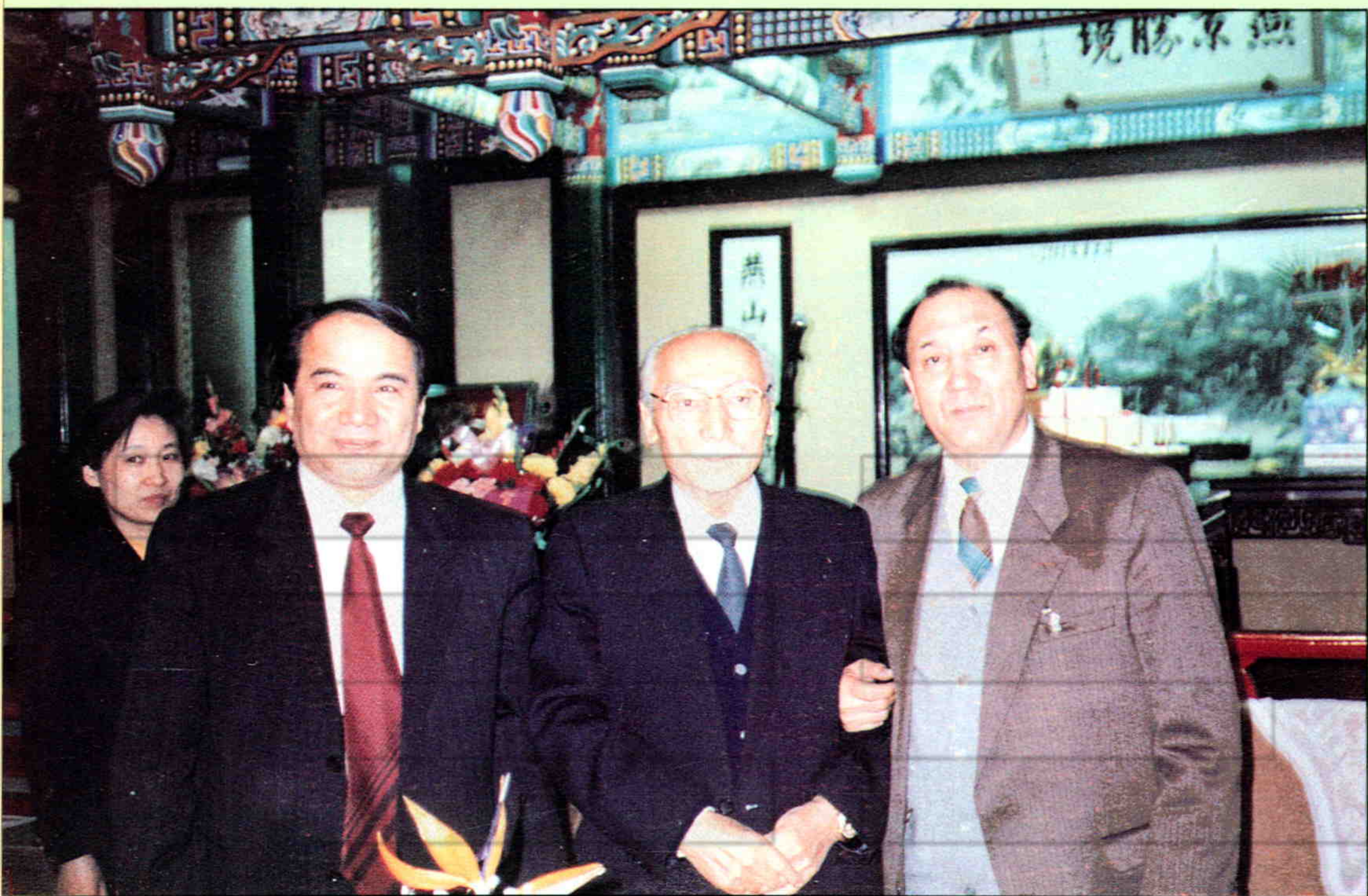
▲全国政协副主席赛福鼎·艾则孜和新疆自治区部分领导在一起