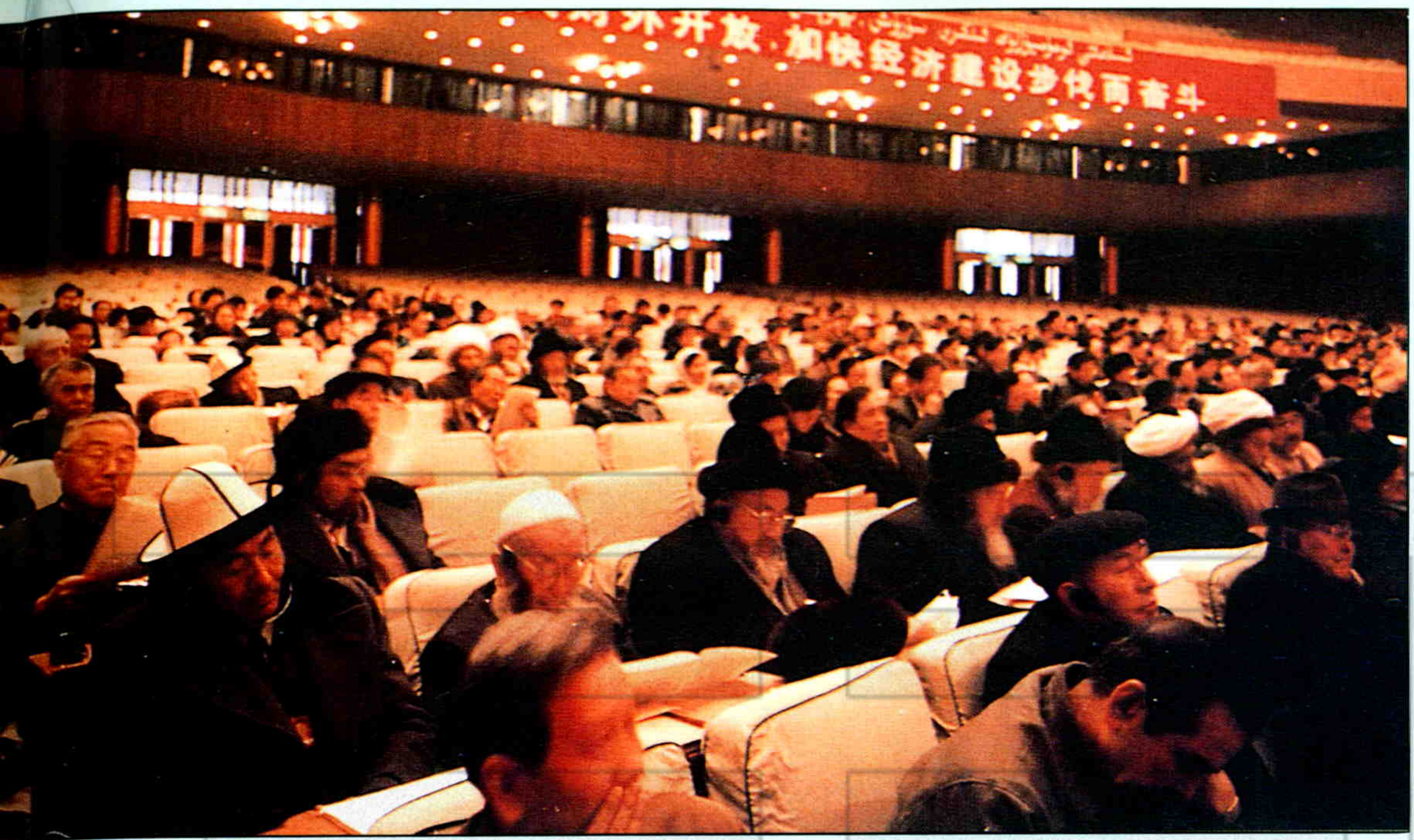
▲新疆自治区政协七届一次会议大会会场