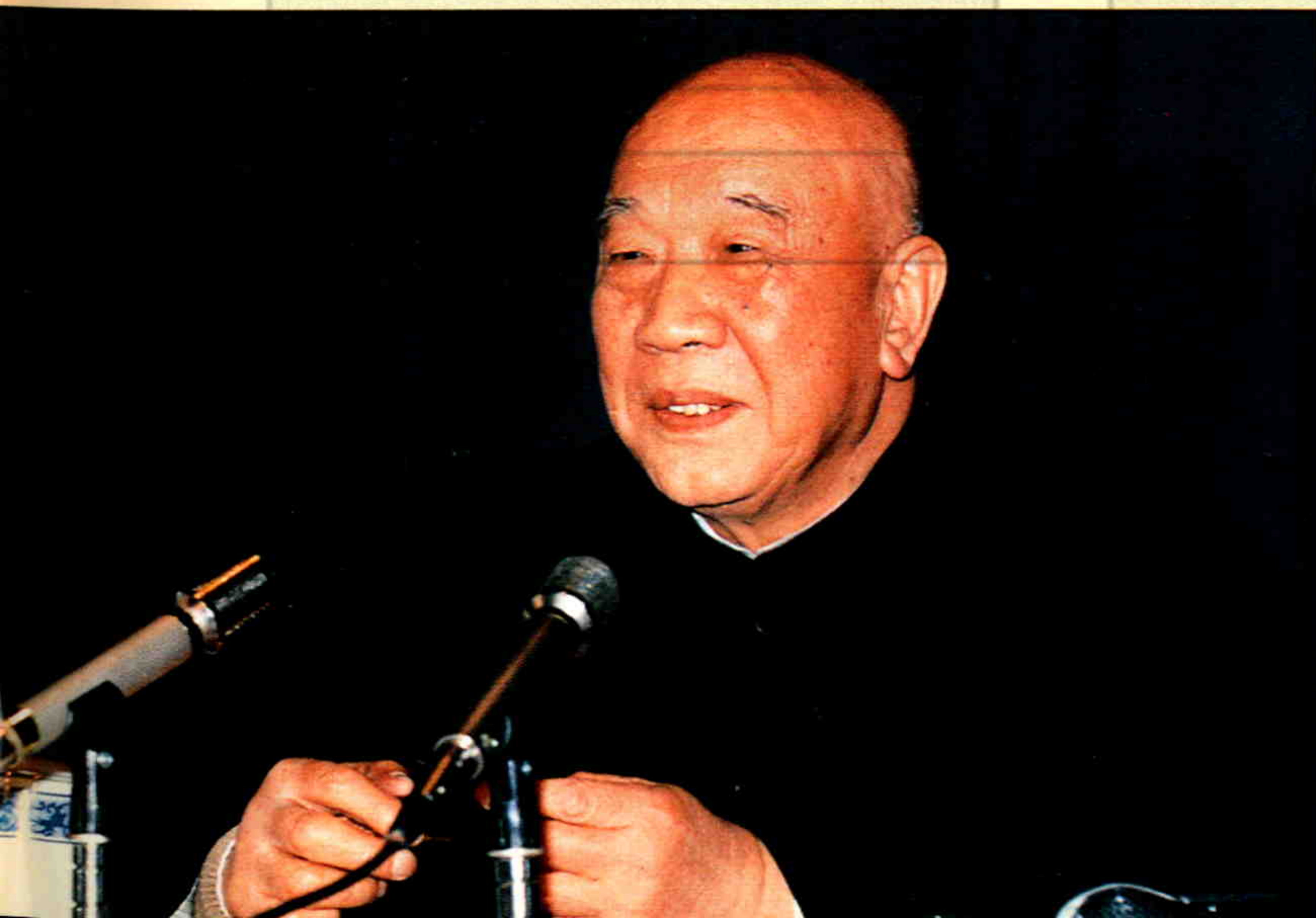
◀全国政协副主席王恩茂在新疆自治区政协会议上讲话