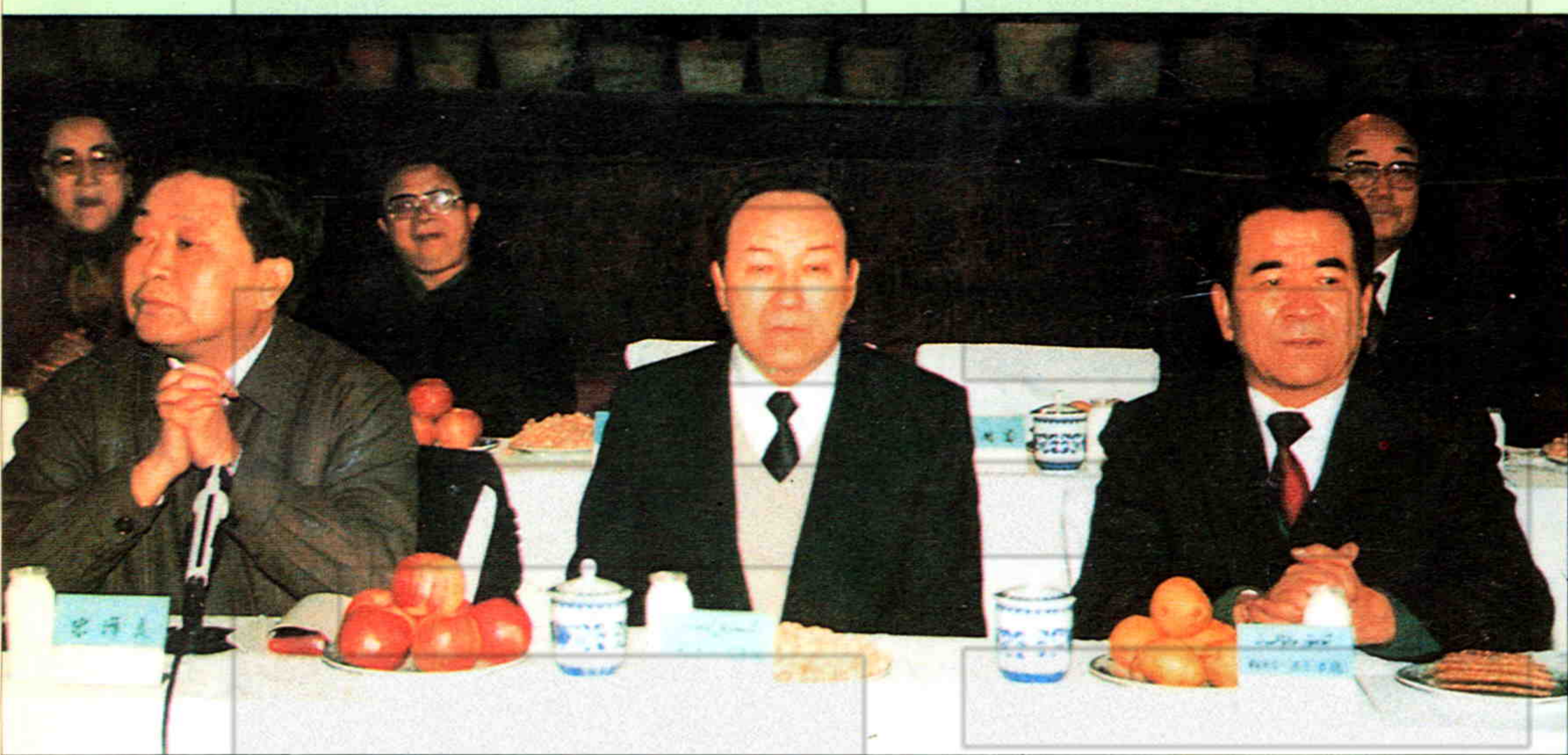
▲全国政协副主席司马义·艾买提和新疆自治区主要领导参加政协茶话会