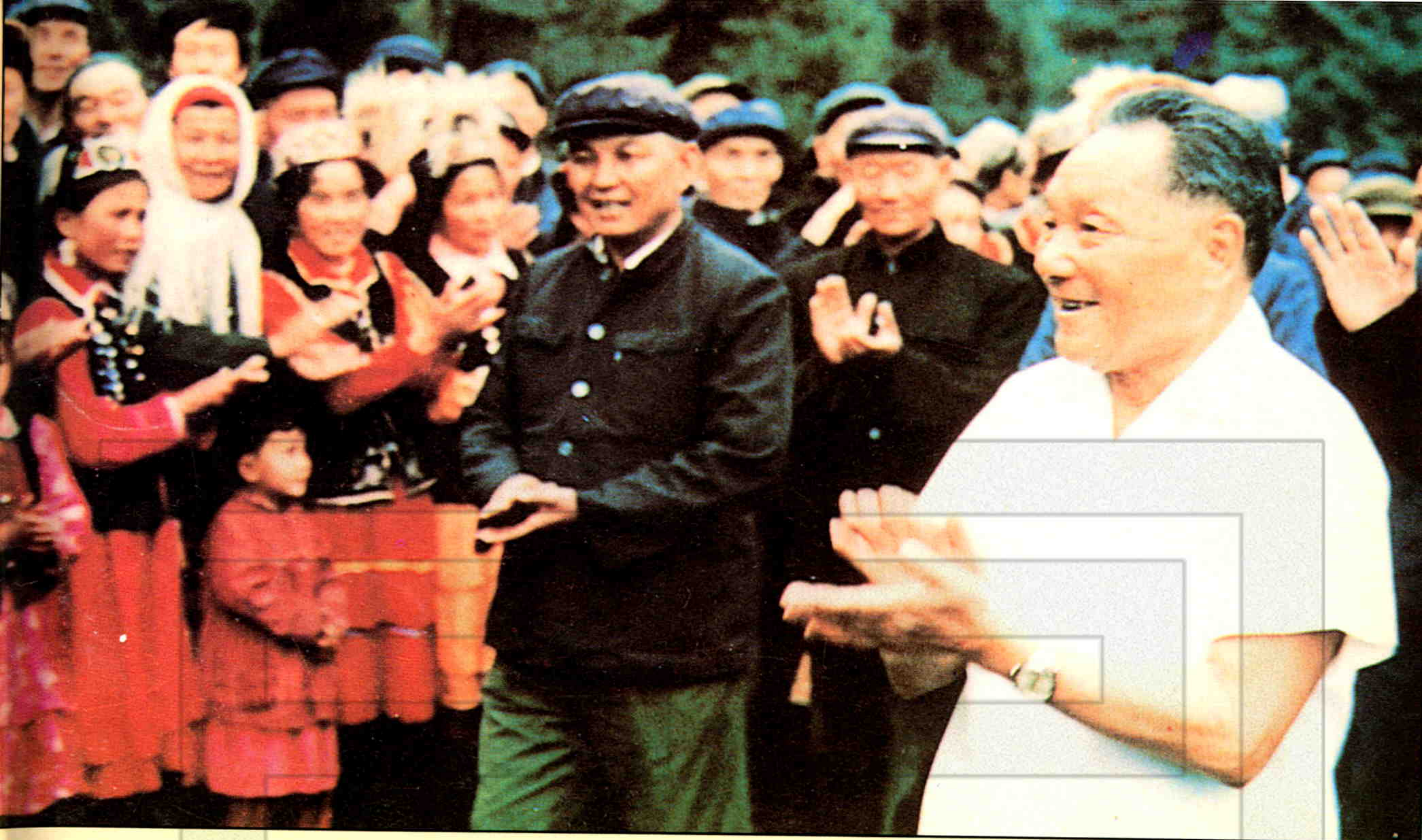
▲1981年，全国政协主席邓小平视察新疆期间，接见部分群众