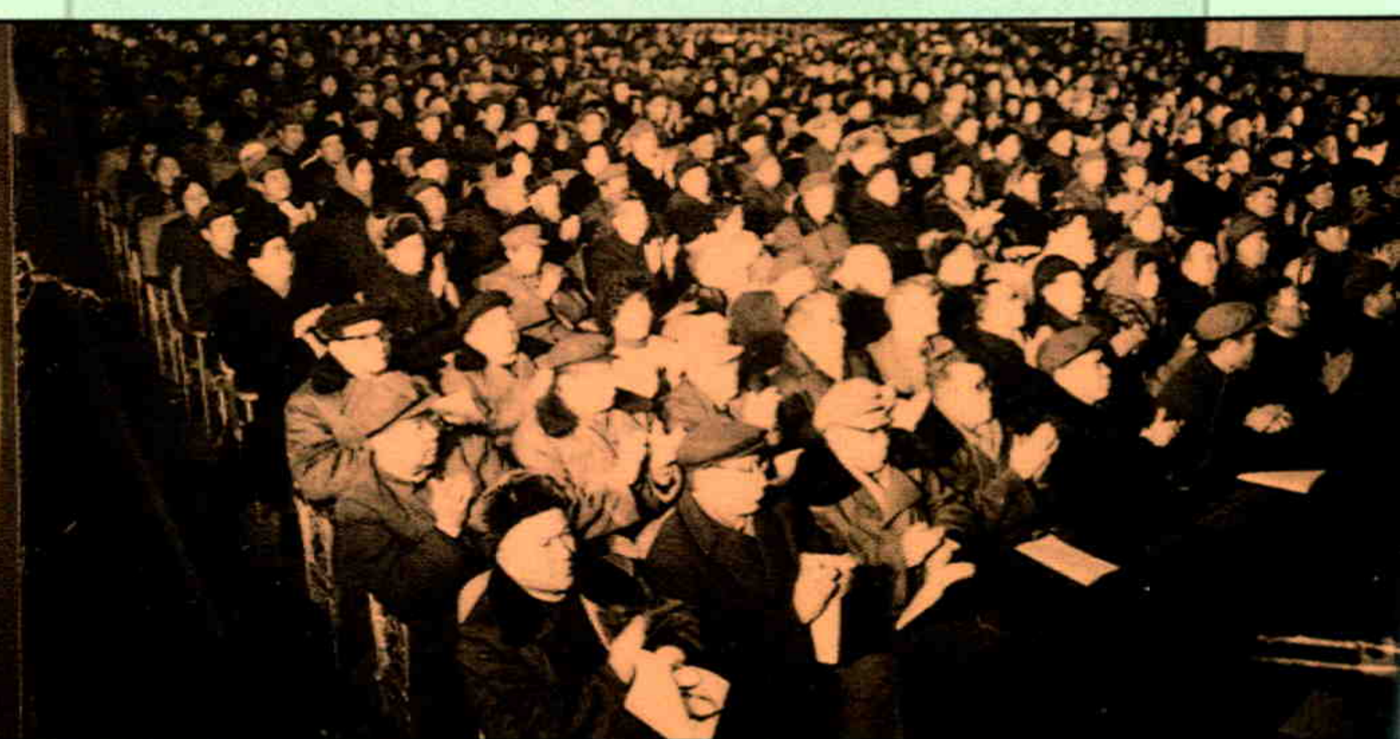
▲新疆自治区政协四届五次次会议会场