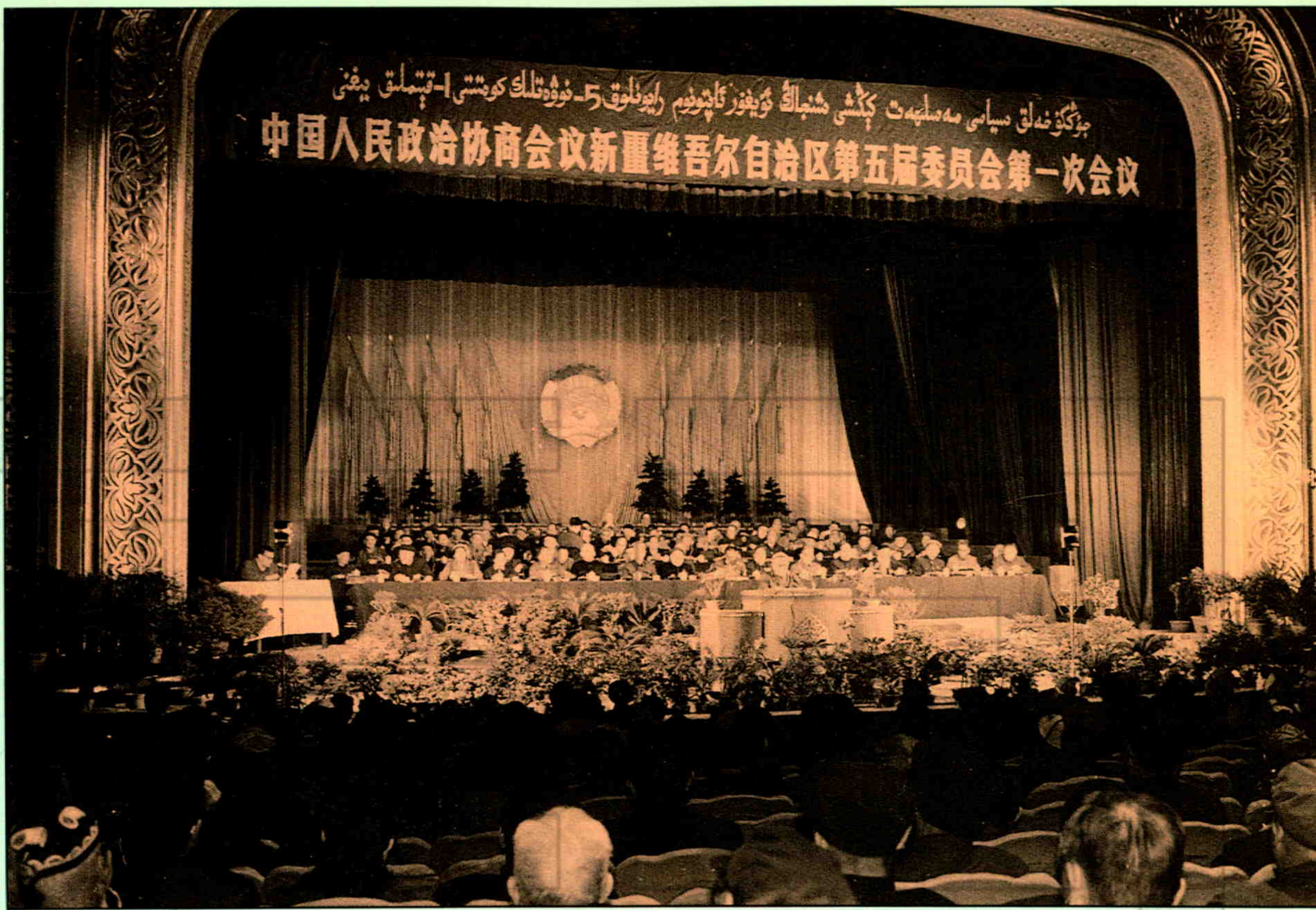
▲新疆自治区政协五届一次会议会场