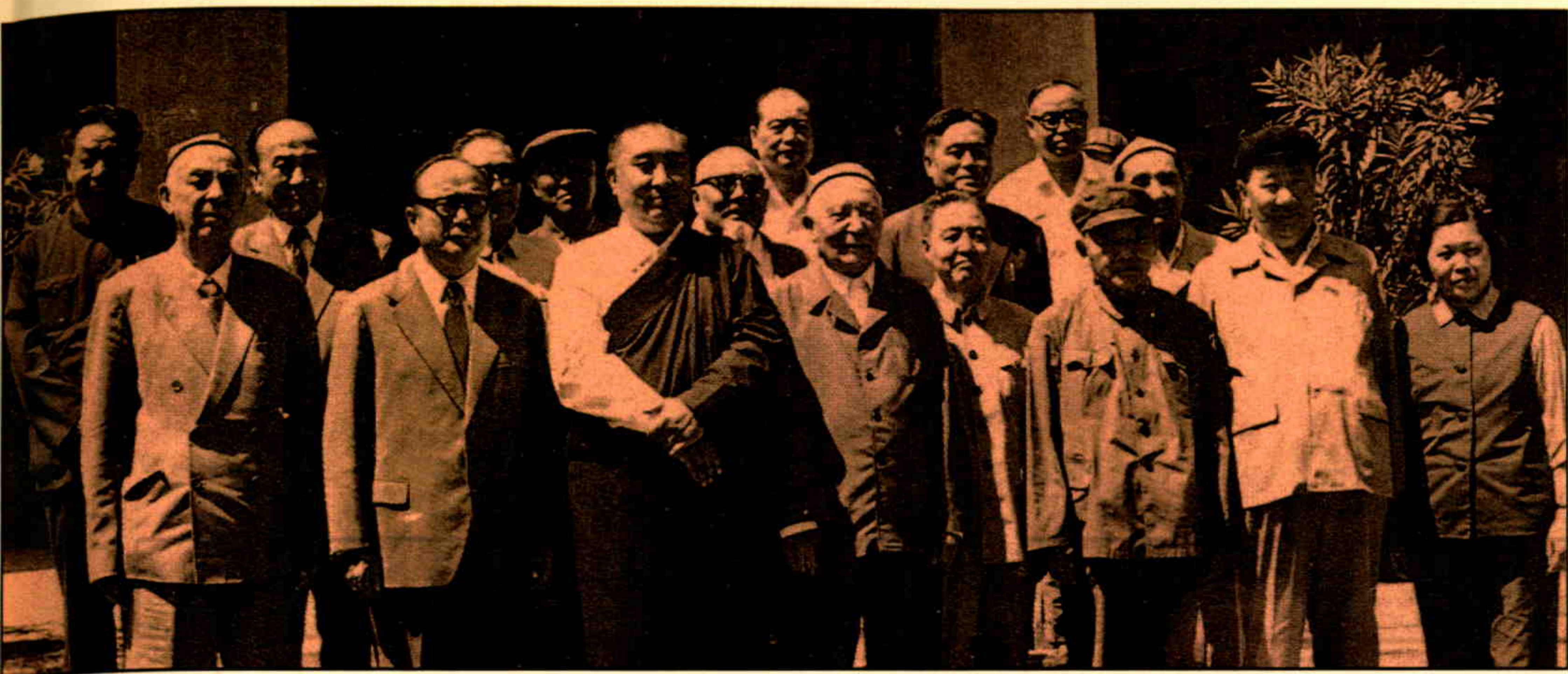
▲1984年，全国人大常委会副委员长班禅·额尔德尼却吉坚赞与新疆自治区政协领导合影