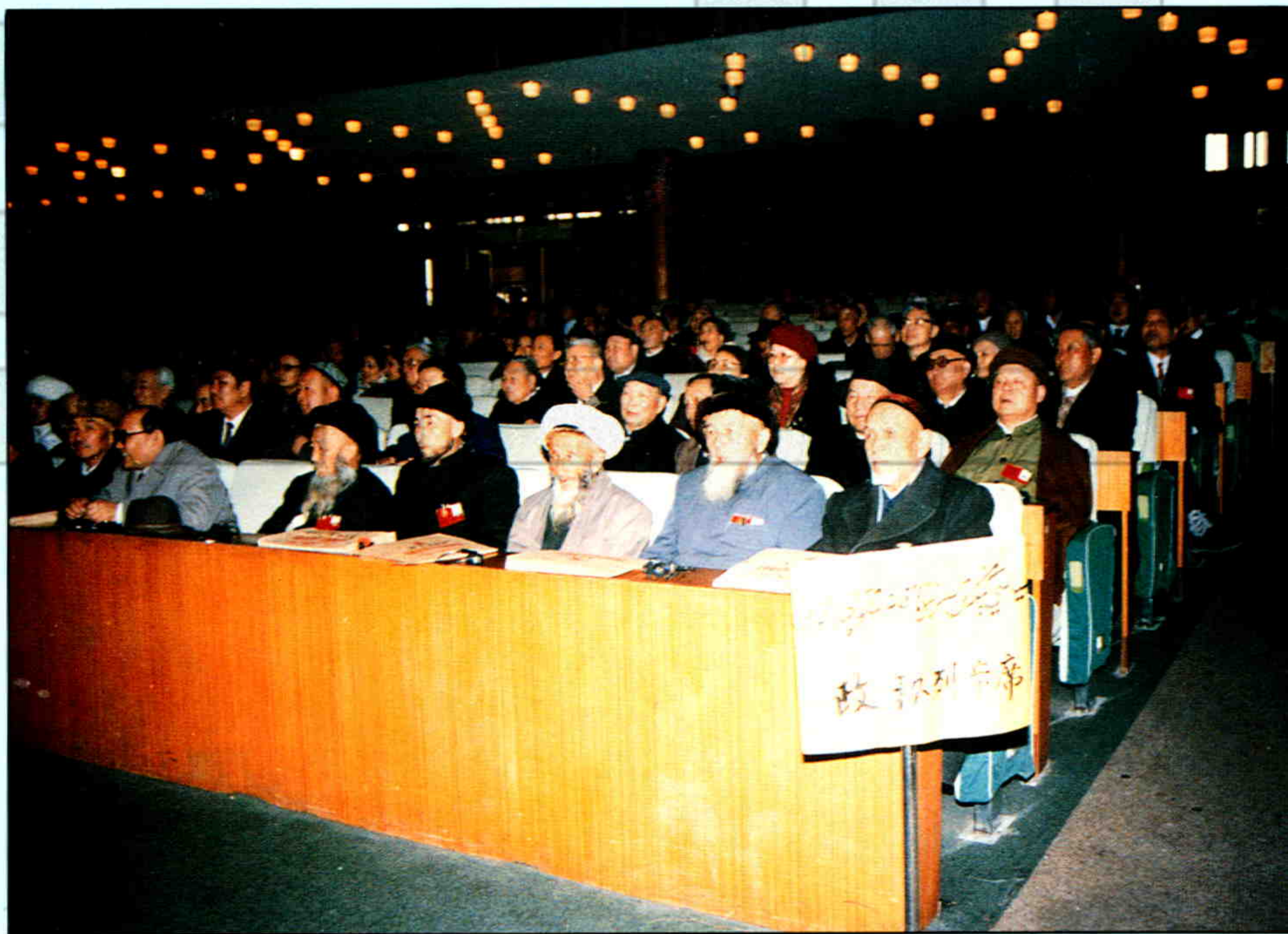
►新疆自治区政协委员列席自治区人大会议,听取政府工作报告