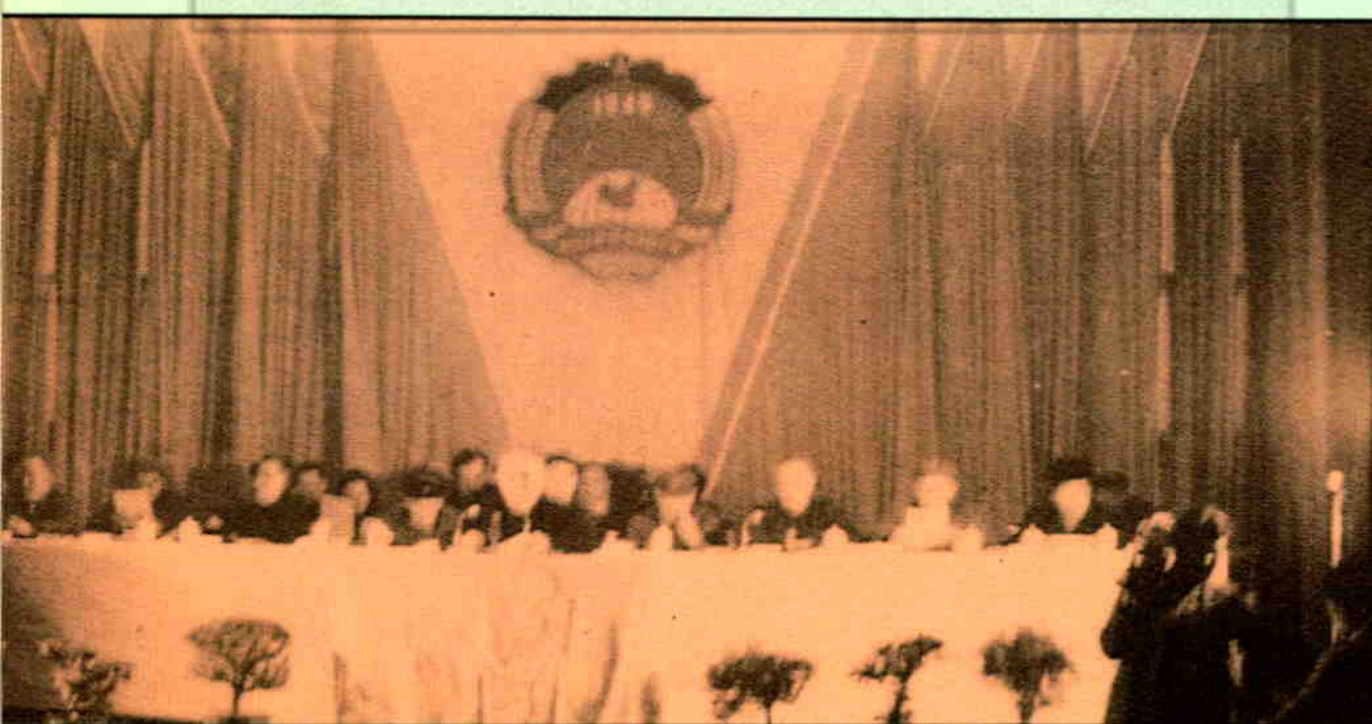
▲新疆自治区政协四届五次次会议主席台