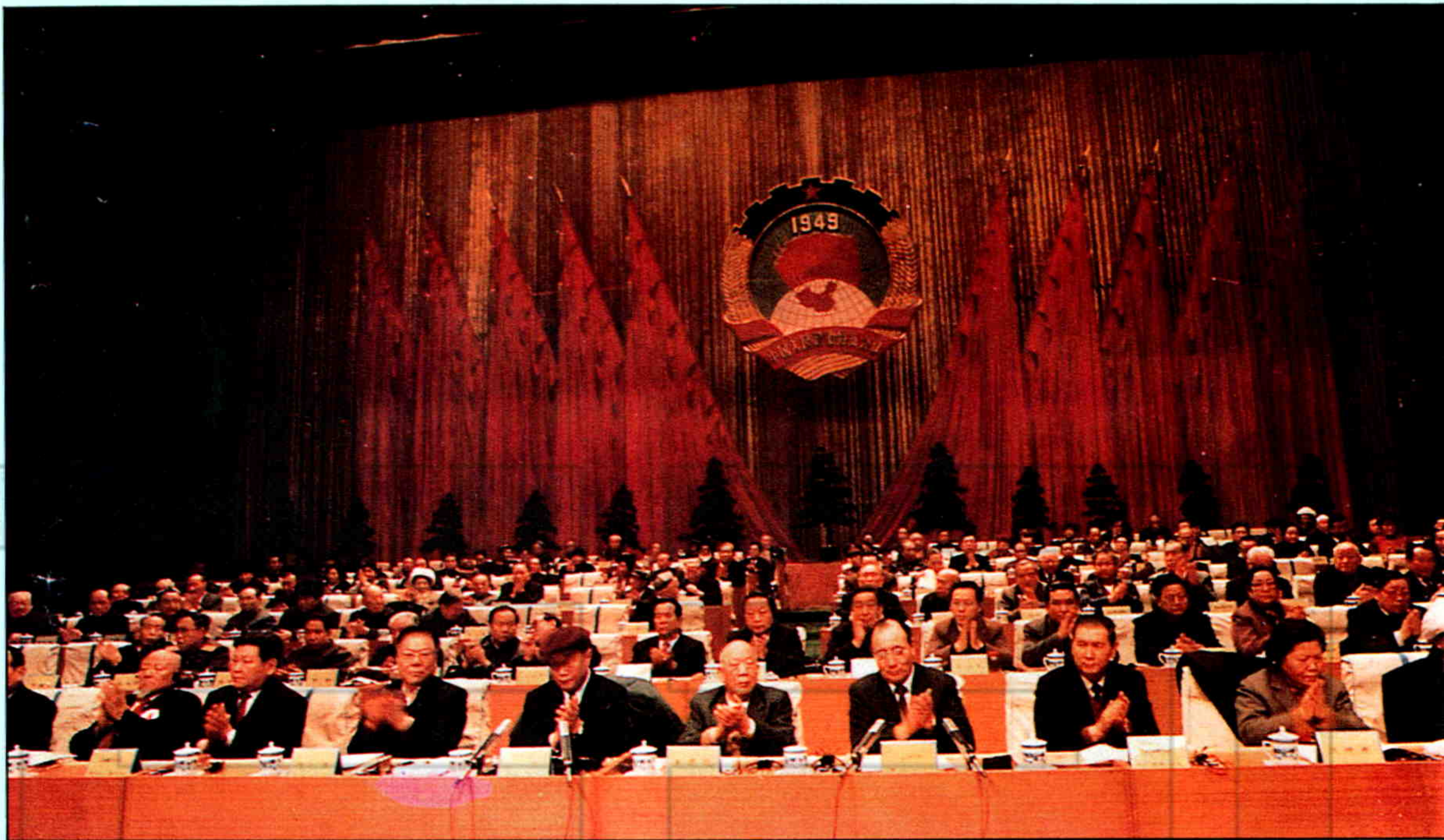
▲新疆自治区政协七届一次会议主席台