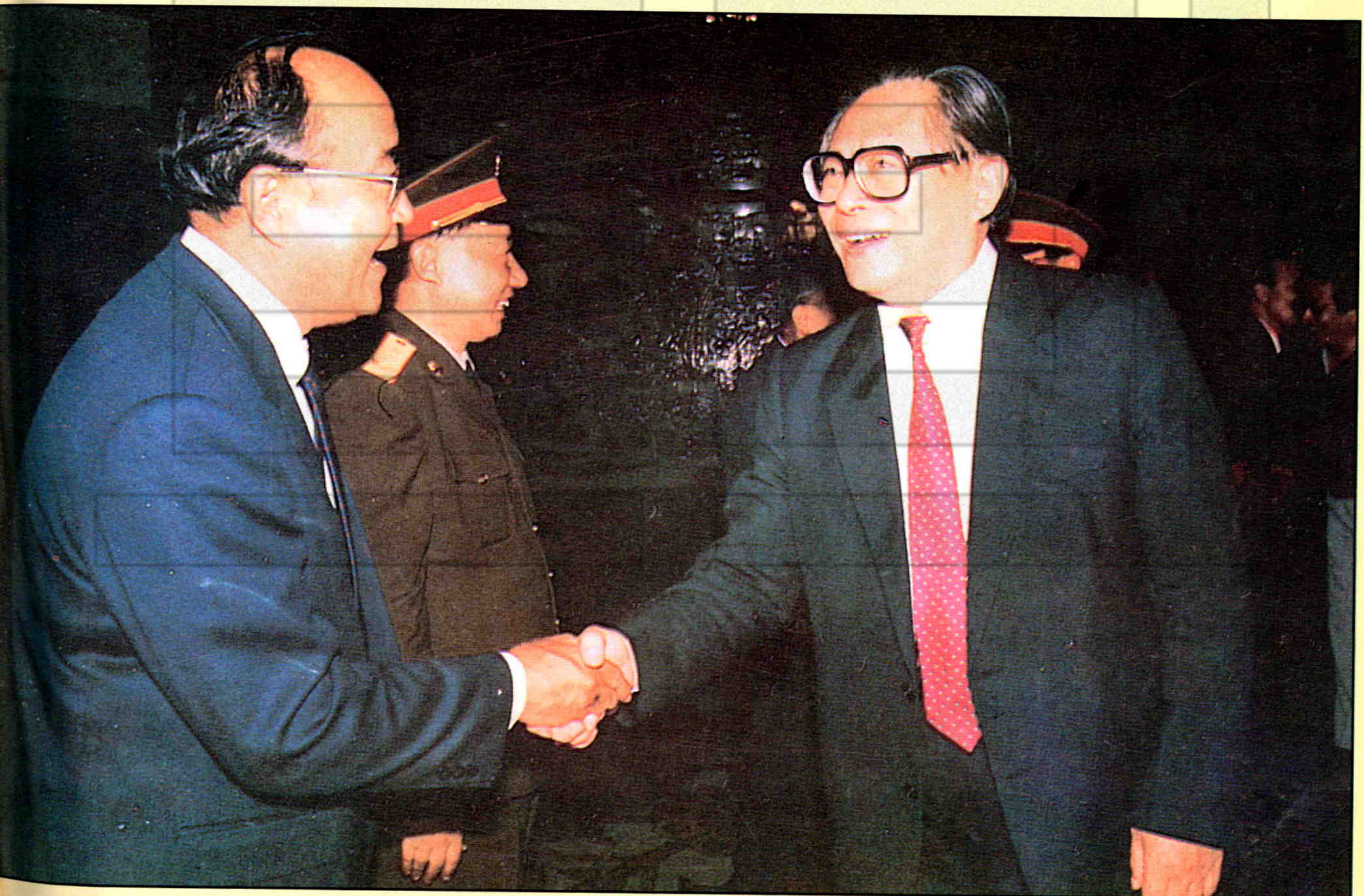
▲中共中央总书记江泽民与新疆自治区第六届政协主席巴岱亲切握手