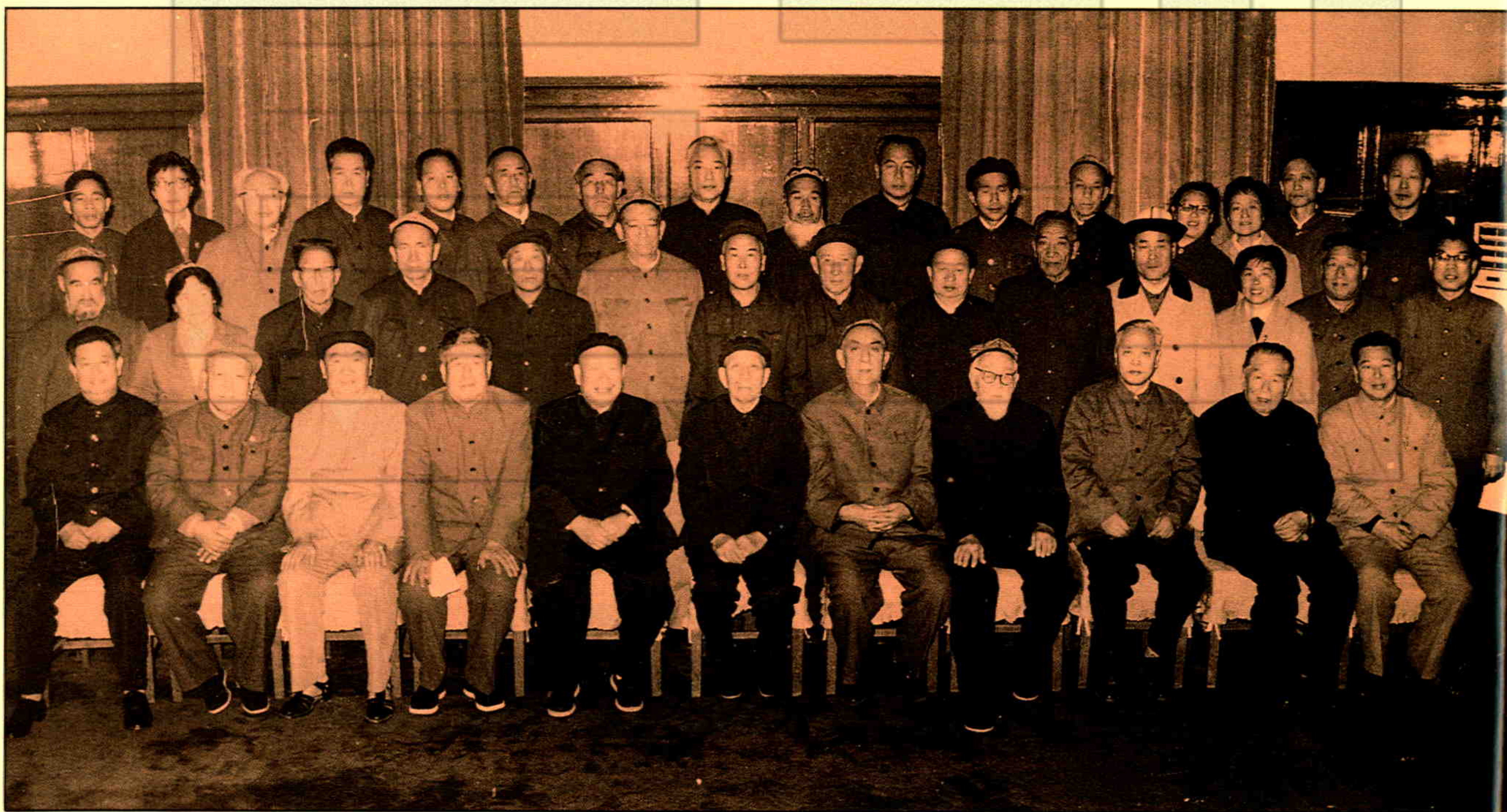
▲1983年10月,王震、杨静仁、包尔汉等中央领导接见新疆自治区政协赴内地参观团全体成员时合影