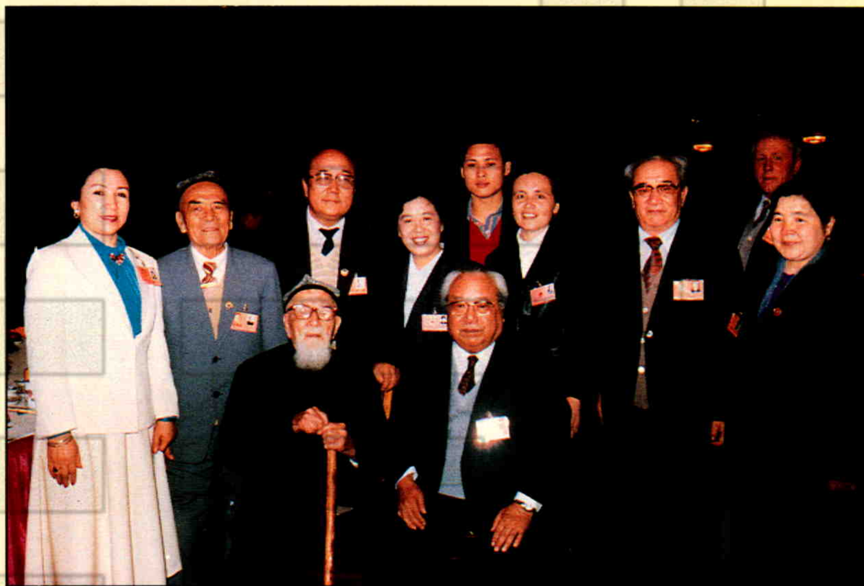
▲1988年，全国政协副主席包尔汉、费孝通接见出席全国政协七届一次会议的新疆部分少数民族全国政协委员并合影