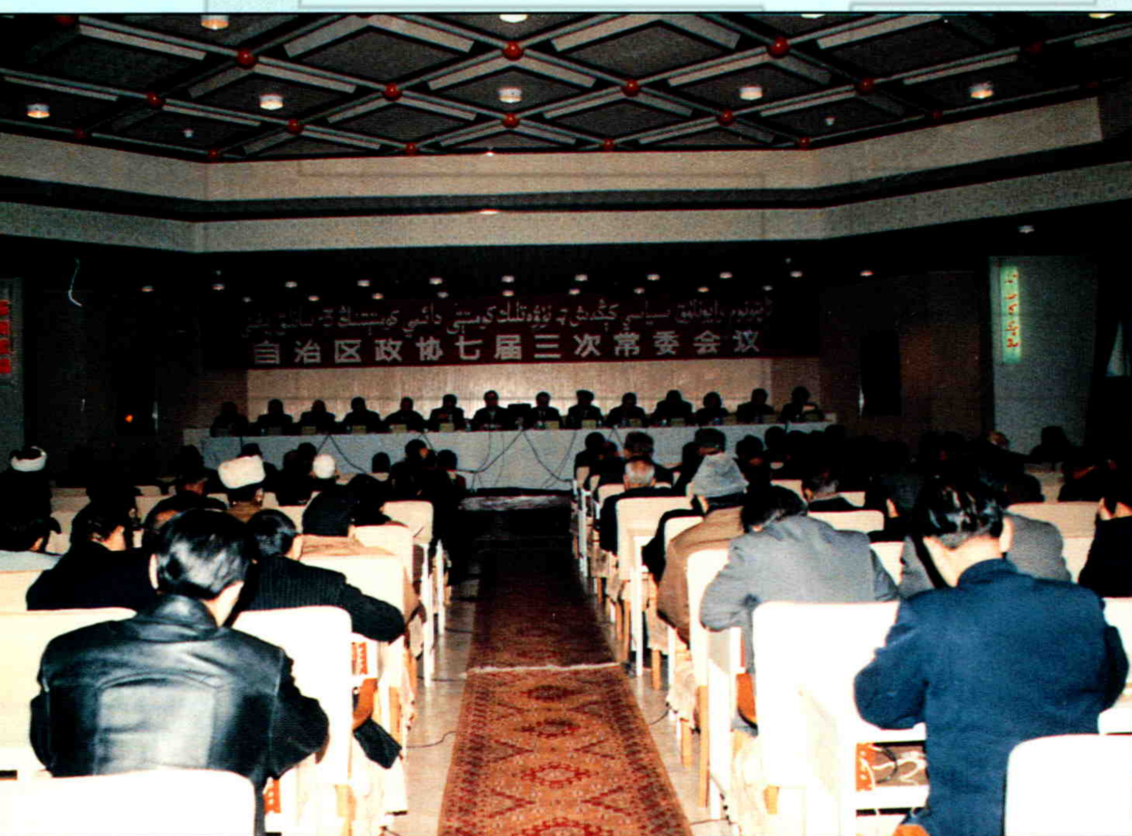
◀ 1993年12月15日，新疆自治区政协七届三次常委会委员听取自治区党委副书记、自治区副主席王乐泉关于新疆经济形势的通报