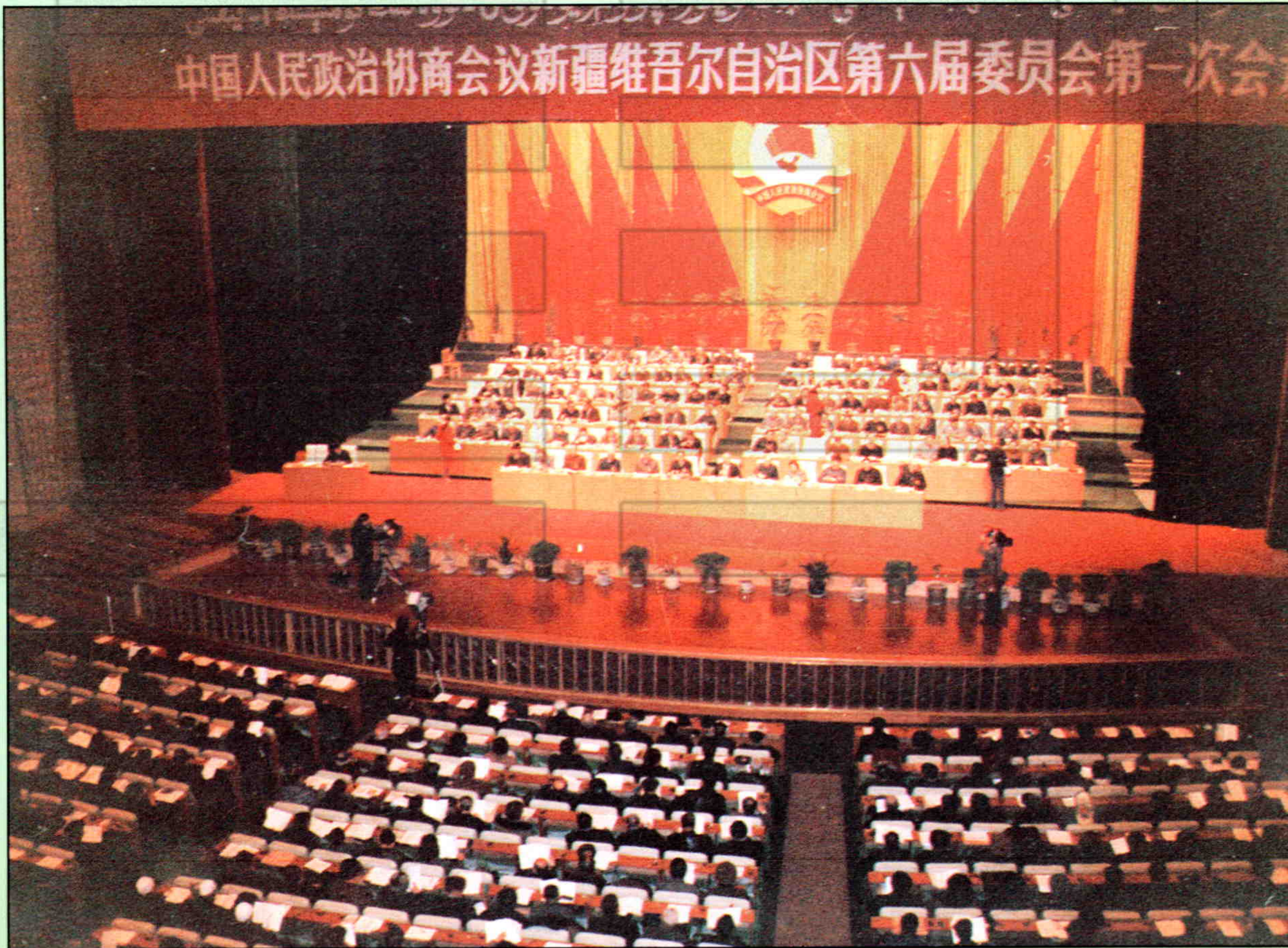
▲新疆自治区政协六届一次会议会场