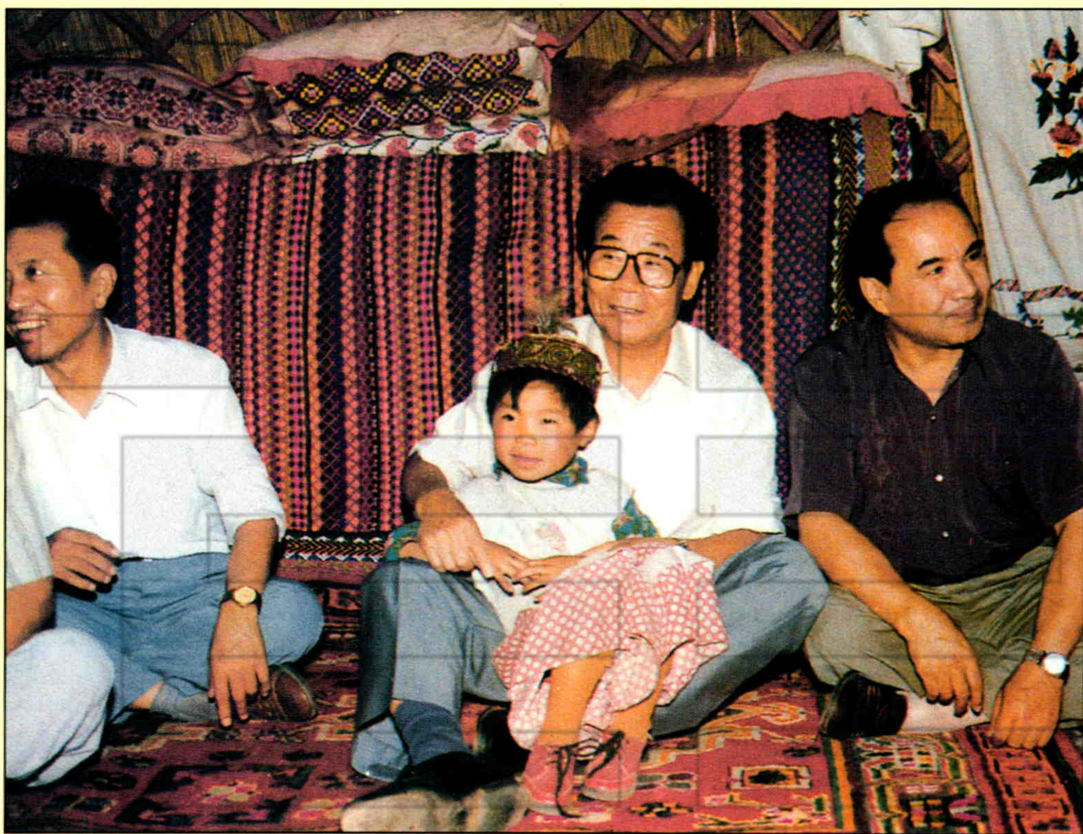
▲1994年8月21~28日,中共中央政治局常委、全国政协主席李瑞环在新疆考察期间到牧民家中作客