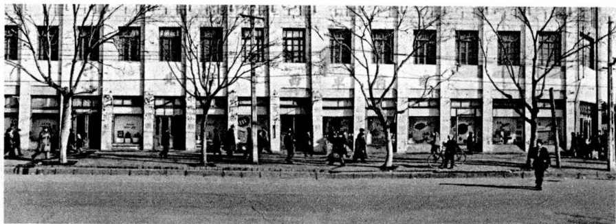
20 世纪 60 年代西单商场外貌