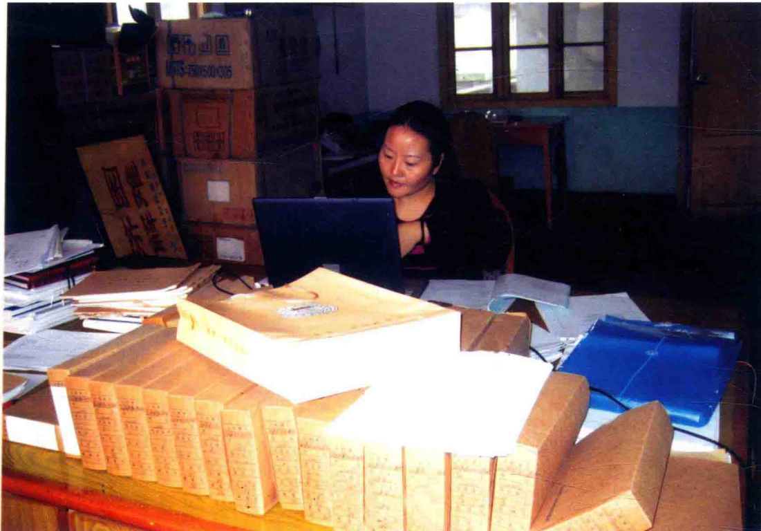
2004年10月，遵义市审计局干部在经济责任审计现场