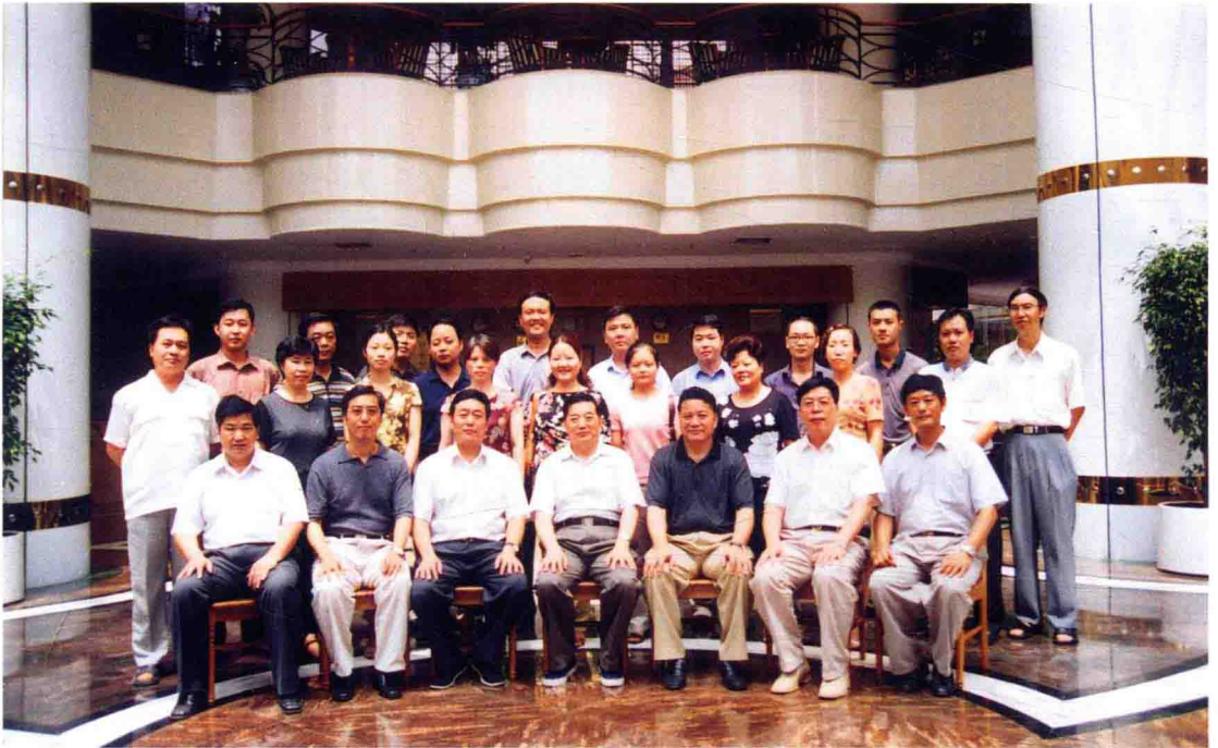
2003年8月22日，国家审计署审计长李金华（前排中）到遵义参观考察，并与陪同人员贵州省人民政府常务副省长王正福（前排右三）、省审计厅厅长李月成（前排左一）、遵义市人民政府市长卢守祥（前排左三）、副市长刘明（前排右一）、市审计局局长刘跃明（后排右六）合影