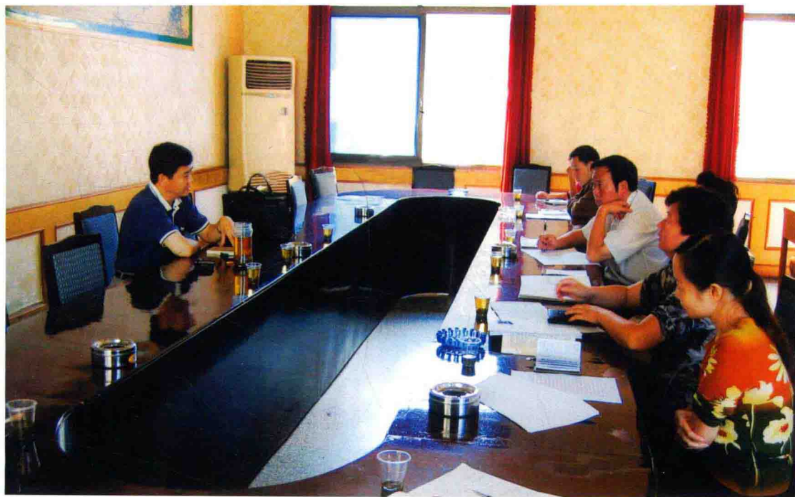
2006年7月，遵义市审计局领导下基层调研