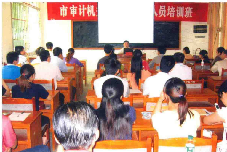
2005年10月，全市新招聘审计干部培训班在市委党校举行