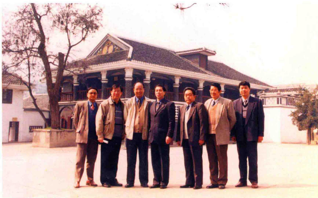
2000年3月27日，国家审计署副审计长董大胜（前排中）参观遵义会议会址。审计署司长刘满堂（左三）、省审计厅厅长樊丙礼（右三）陪同参观，在遵义会议会址与遵义市审计局领导班子全体成员合影