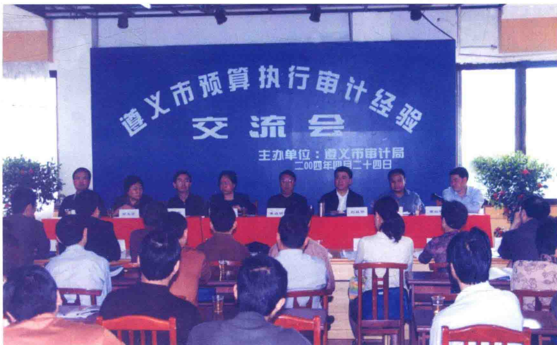
2004年4月24日，遵义市预算执行审计经验交流会在仁怀市召开，省审计厅副厅长黄启明（左五）、市人大常委会副主任任启贤（左四）到会指导