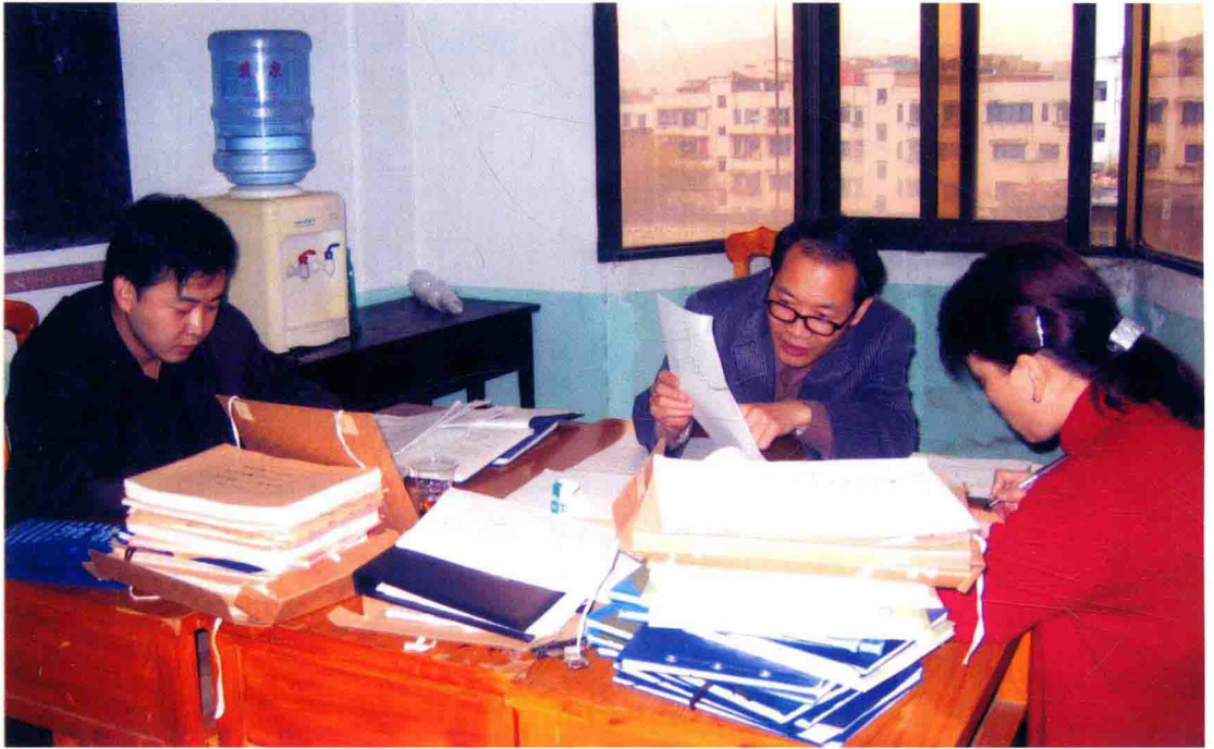
2004年10月，遵义市审计局干部在审计现场