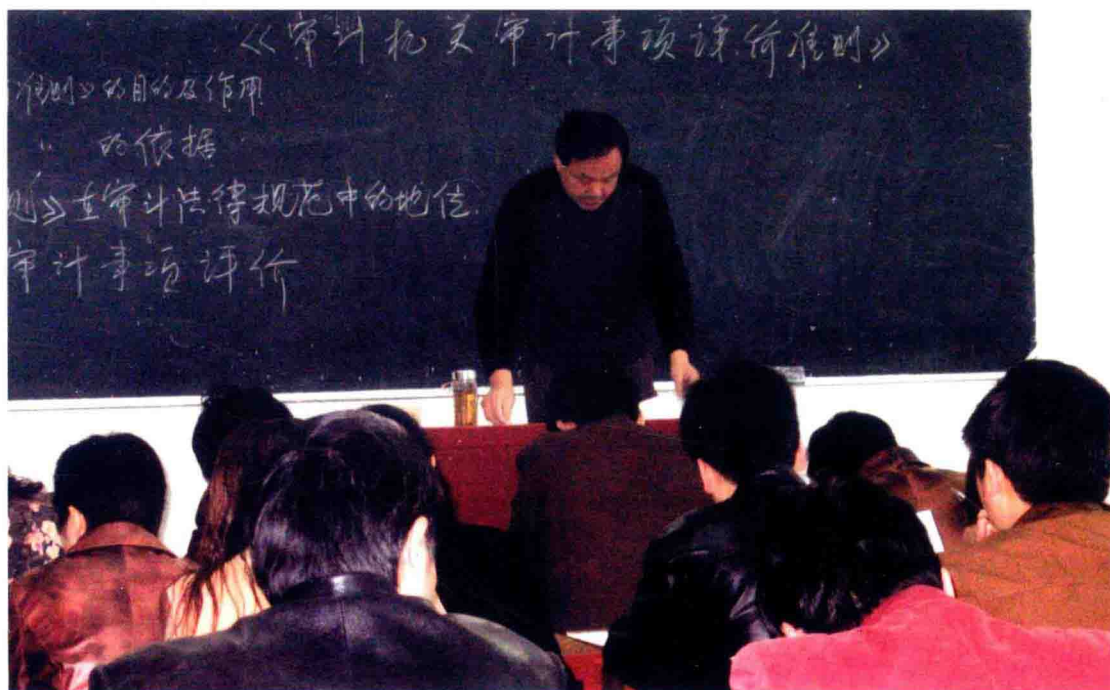
2004年3月8日，举办审计法制培训会