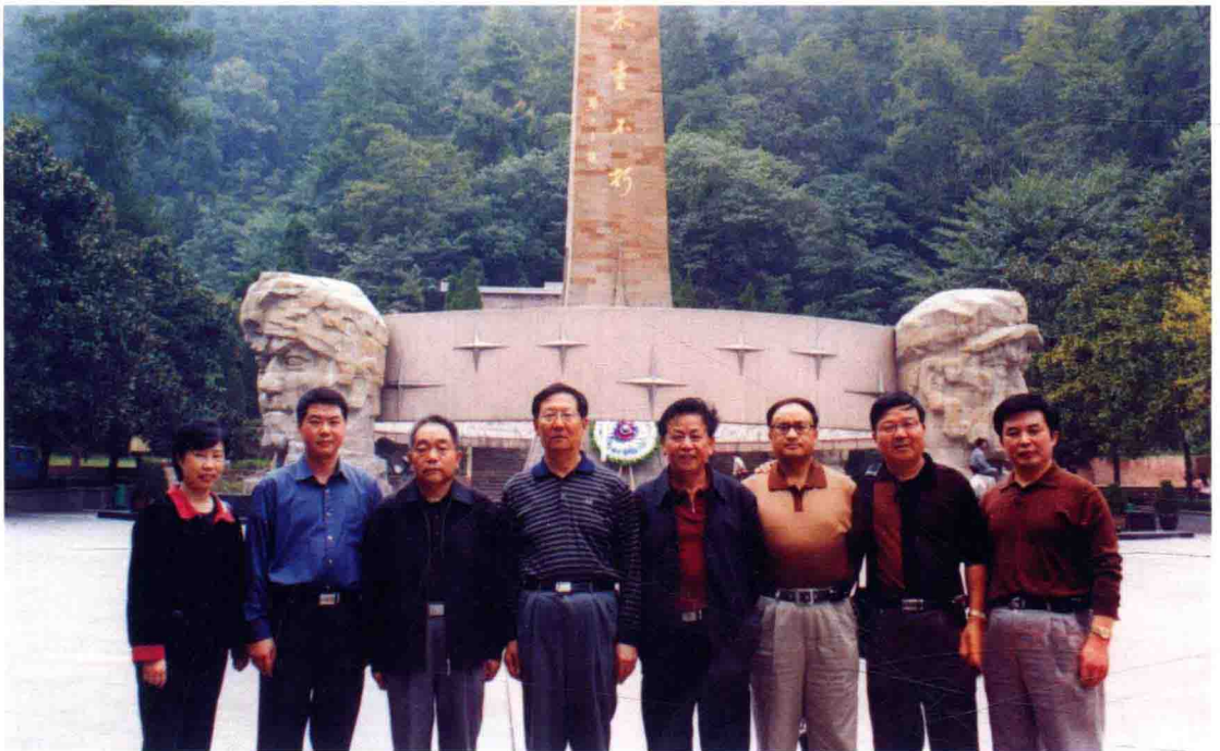
2004年9月26日，国家审计署副审计长翟熙贵（左四）到遵义参观考察，省审计厅厅长樊丙礼（左三）、副厅长徐德扬（右四）及市审计局部分领导陪同参观