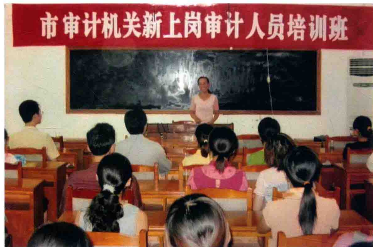
2005年8月，全市审计机关新上岗人员培训