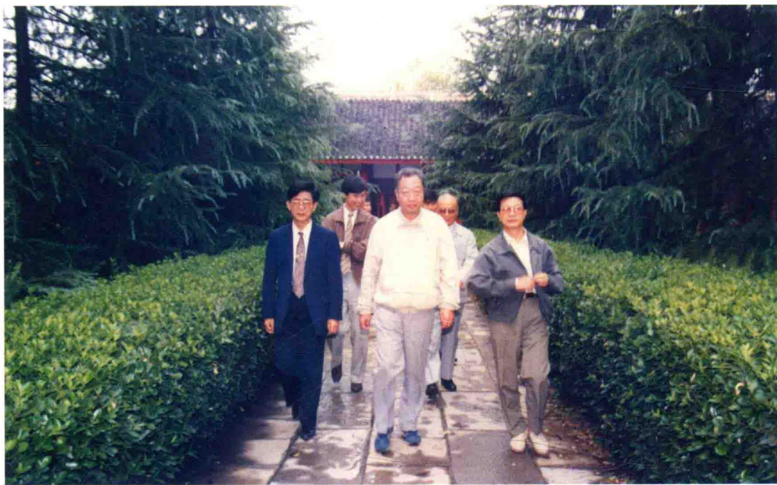
1994年9月16日，国家审计署审计长郭振乾（前排中）到遵义参观考察，省审计厅厅长马三民（前排左一）、遵义地区行政公署专员申诚（前排右一）陪同考察