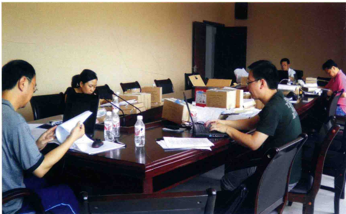
2007年，遵义县财政决算审计，审计人员在审计项目现场