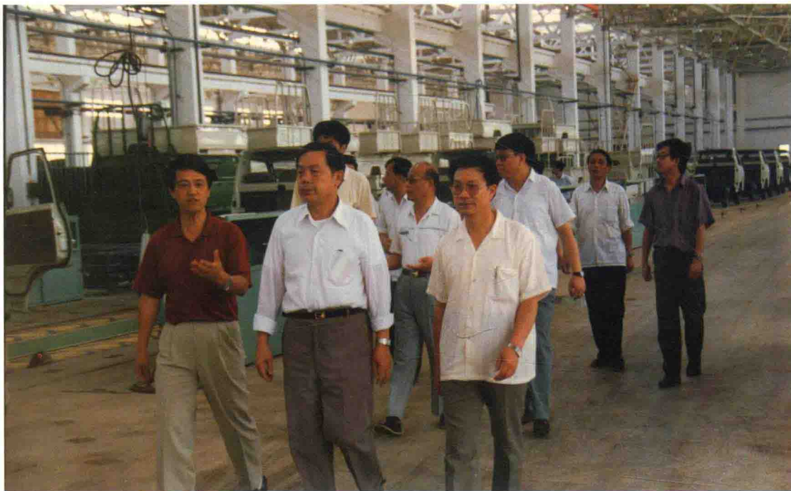
1992年7月7日，国家审计署审计长吕培俭（前排中）到遵义参观考察航天汽车城。遵义地区审计局局长黄觉辉（二排右一）、副局长徐永森（后排右二）陪同考察