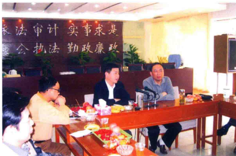
2005年4月23日，到贵阳审计局考察学习