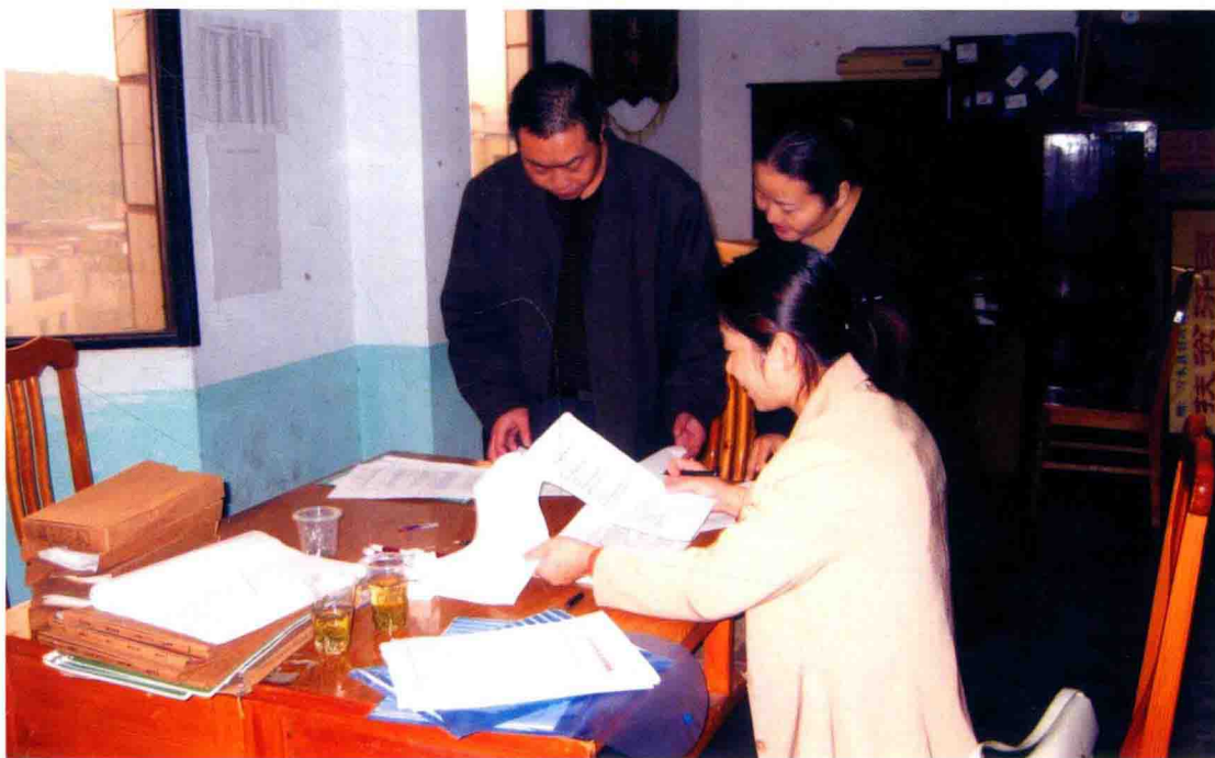
2004年9月，审计人员在习水县审计现场讨论