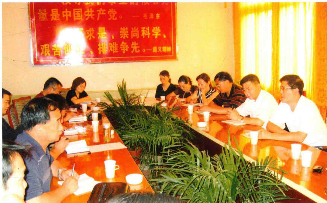
2005年6月，遵义市领导干部经济责任审计联席会工作组在遵义县调研