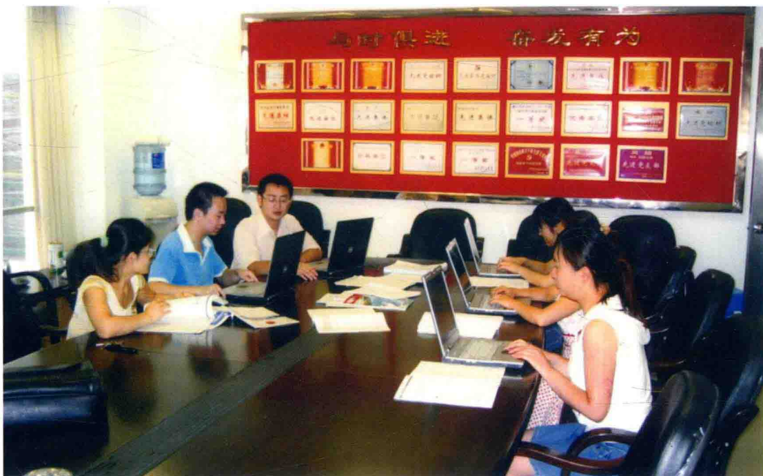
2007年，遵义市审计局审计人员已实现每人一台笔记本电脑实施审计