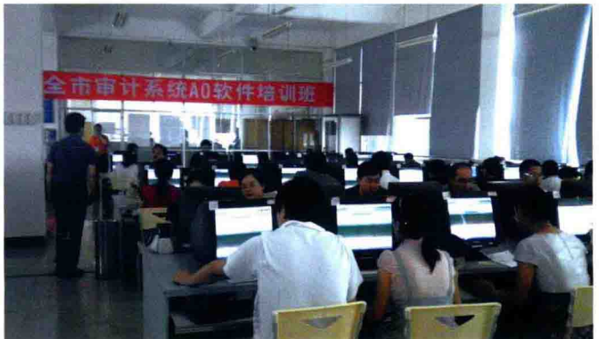
2007年,全市审计系统AO软件培训现场