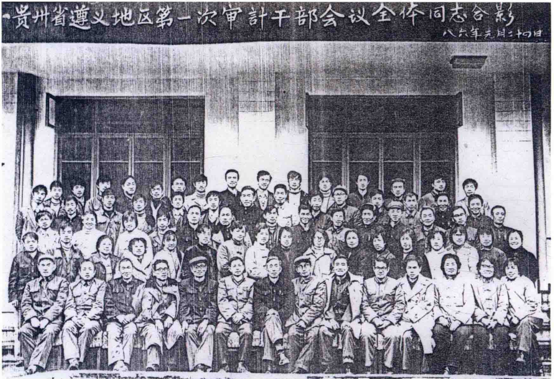
1986年1月15日至24日，遵义地区审计局主持召开第一次全区审计干部会议，参会人员合影