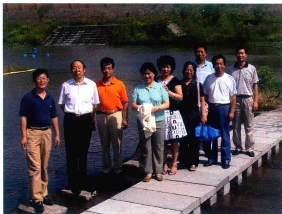
全国皮革行业节能减排环保创新奖考察现场（2008年）