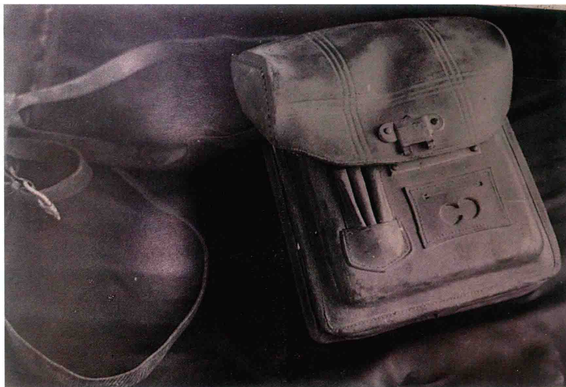
抗日战争时期 3513 厂生产的皮公文包