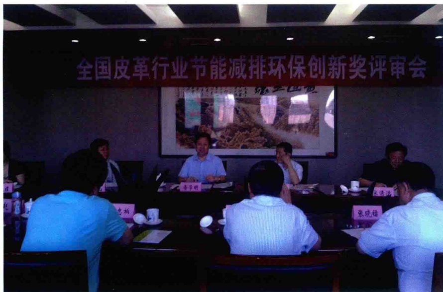
全国皮革行业节能减排环保创新奖评审会（2010年）