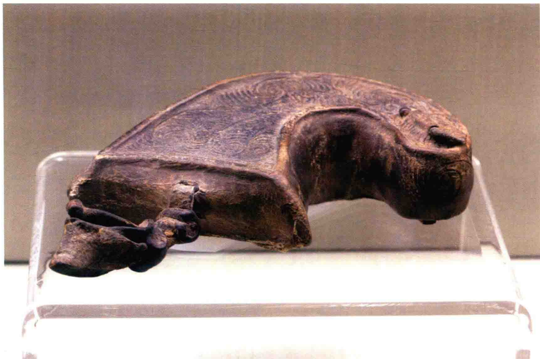
新疆哈密市五堡墓葬出土的青铜时代的轧涡旋纹革盒