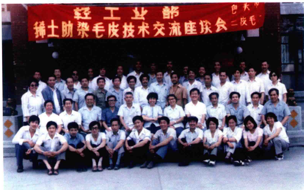
轻工业部稀土助剂染毛皮技术交流座谈会 (20世纪70年代)