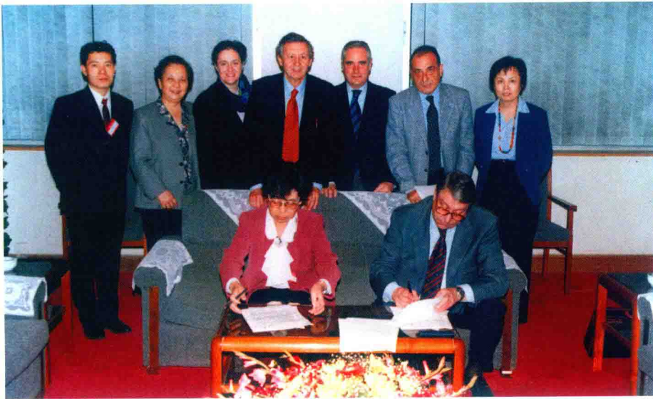
中国—意大利混委会皮革组签约仪式（20世纪90年代）