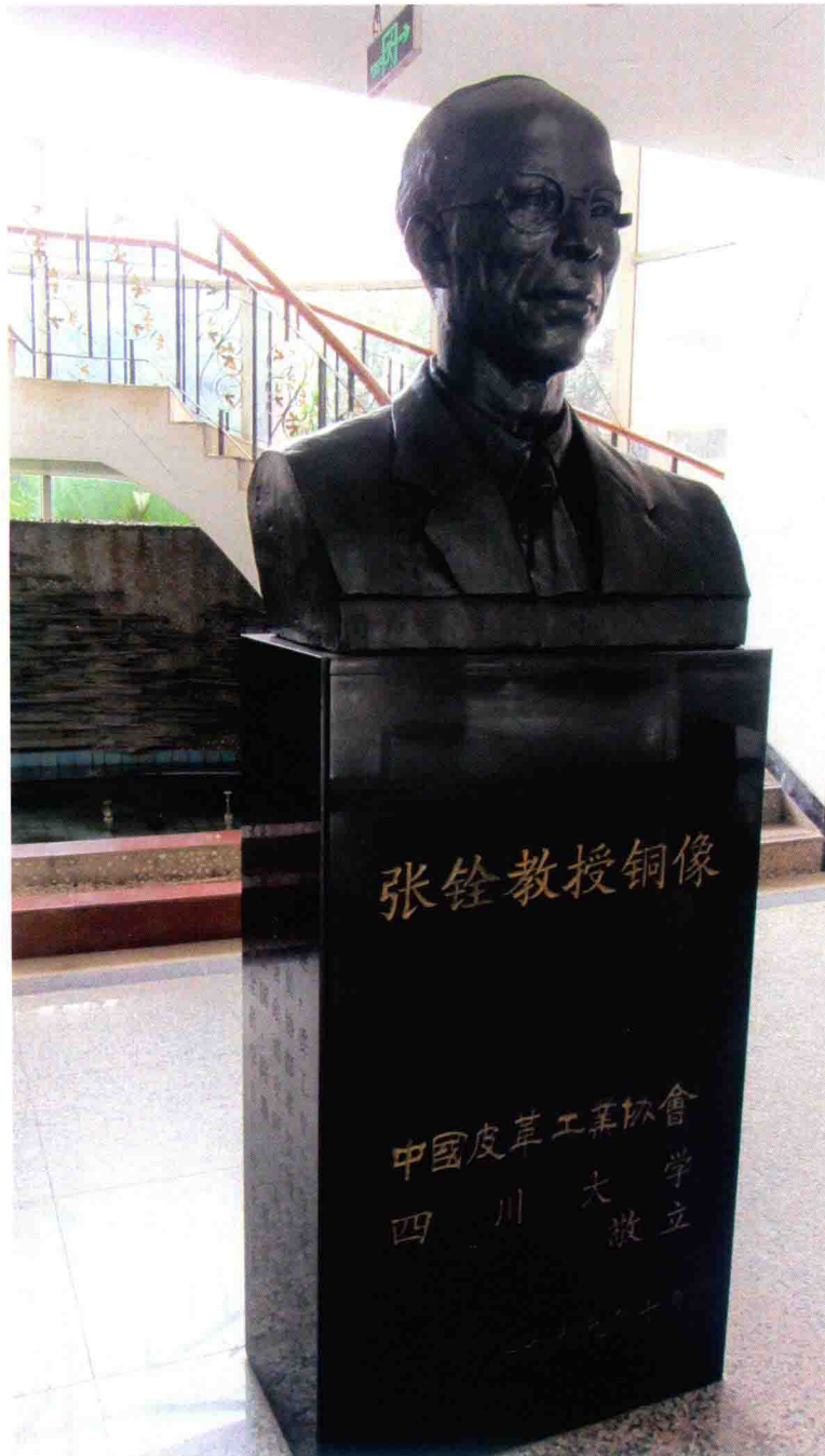
原成都工学院张铨教授（1899—1977）铜像