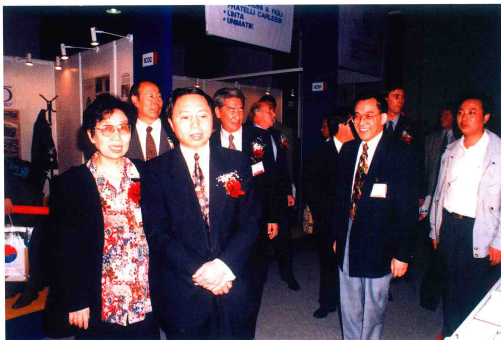
中国轻工业总会副会长步正发（左二）参观中国国际皮革展（1997年）