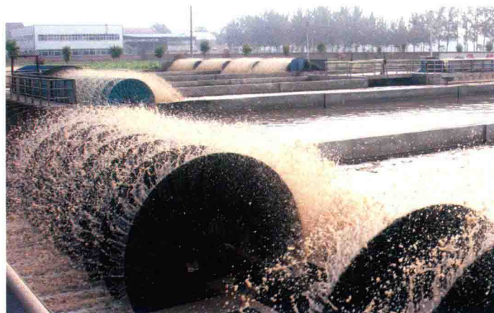
21世纪初的污水处理厂