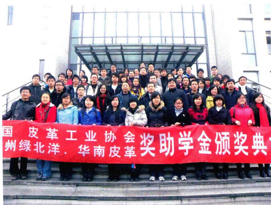
四川大学皮革奖助学金颁奖 典礼(2009年)