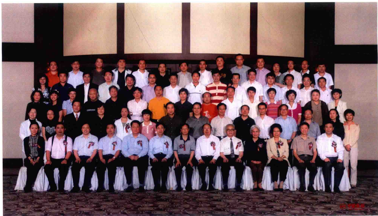
全国制鞋标准化技术委员会成立大会代表合影（2008年6月5日）