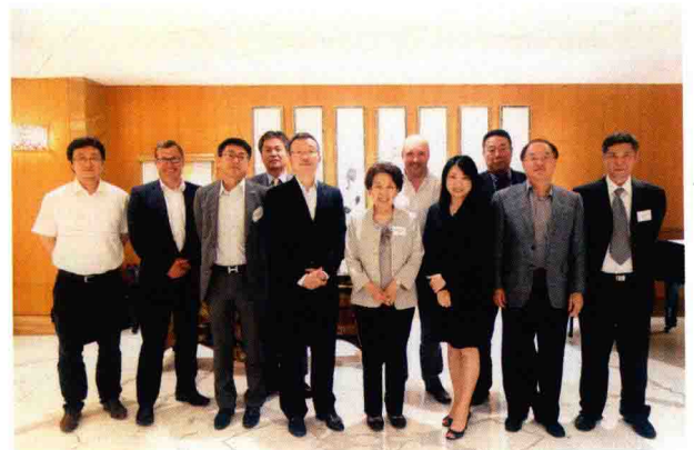
国际毛皮协会亚洲区董事会香港会议代表合影（21世纪初）