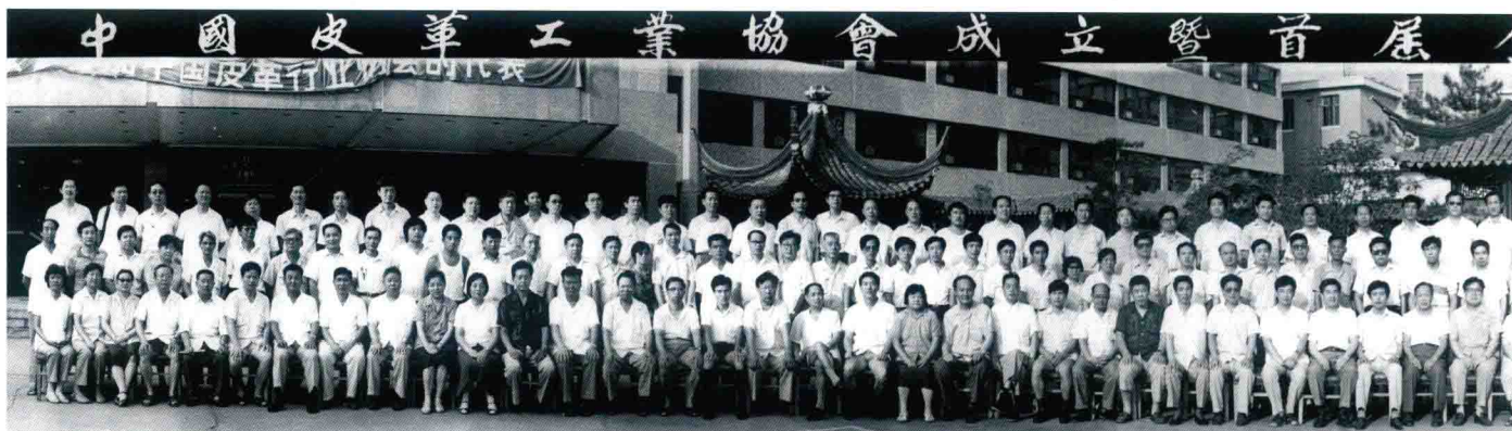
中国皮革协会成立大会

中国皮革协会会标是一张皮形组成的艺术图案。一方面表示行业是以皮革为基础；另一方面，从皮形外观来看，呈现出一个扁平的“中”字，寓意代表的是“中国”皮革行业。图案中央的四个字母“CIA”是中国皮革协会的英文缩写。图案主体颜色为蓝色