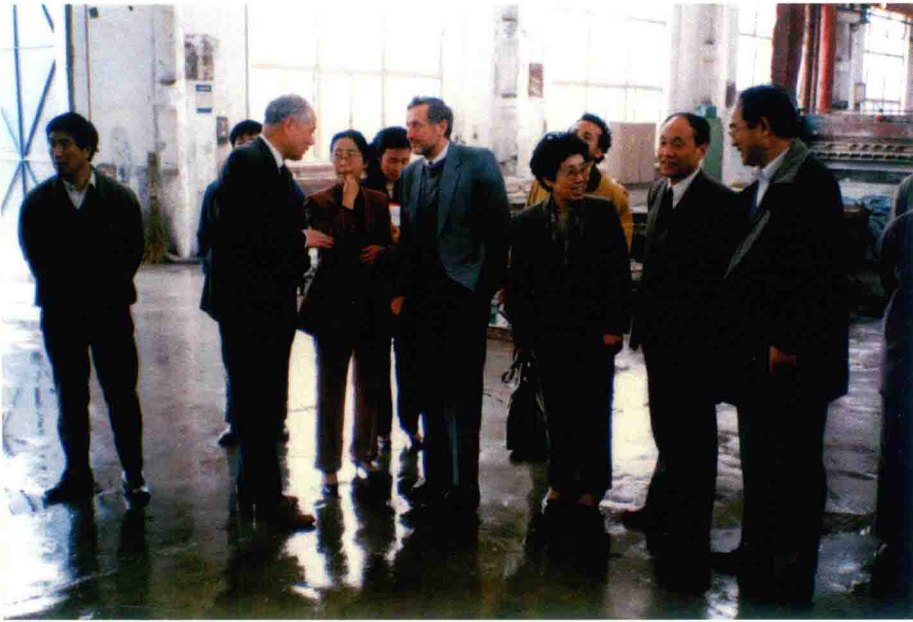
联合国工业发展组织专家在中国考察环保项目（20世纪90年代）