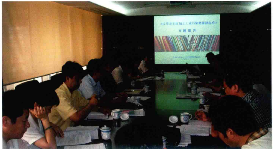
《皮革及毛皮工业污染物排放标准》开题报告会（2006年）