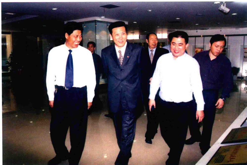
国家轻工业局局长陈士能（左二）视察企业（1999年10月5日）