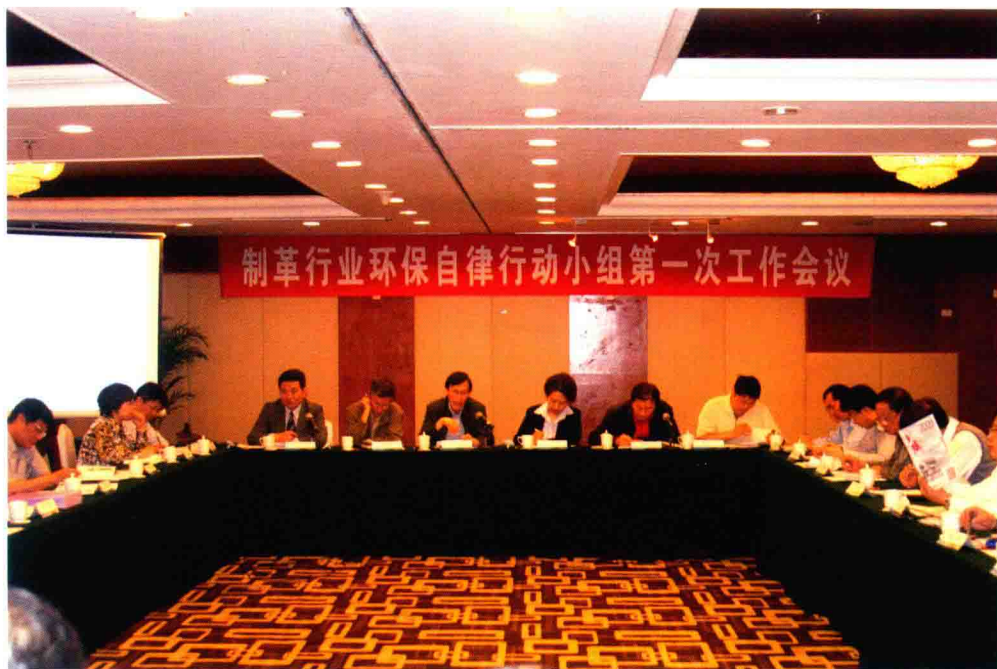
环保自律行动小组工作会议（2010年5月14日成立）