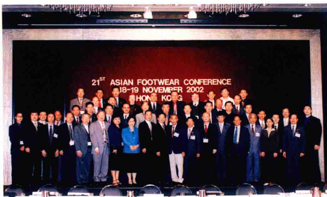
第21届亚洲鞋业会议代表合影