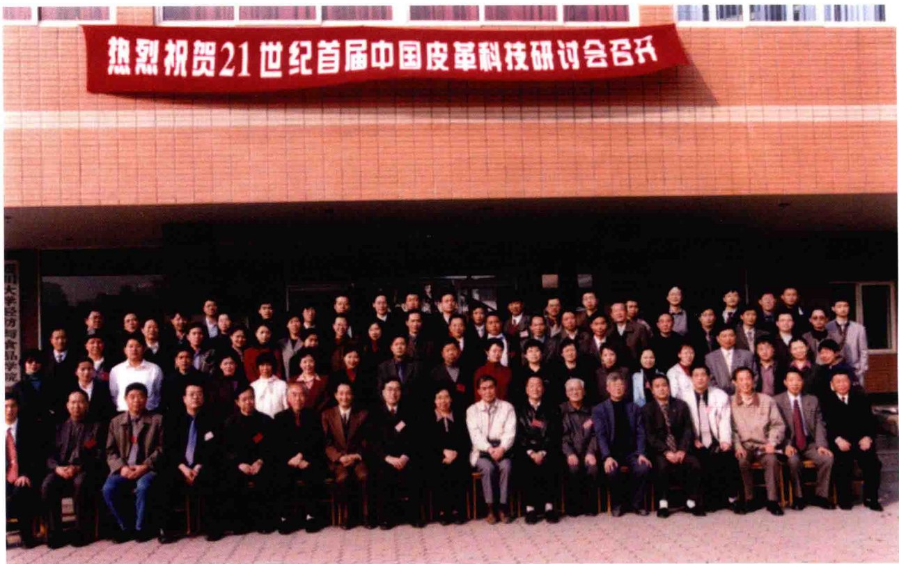
21世纪首届中国皮革科技研讨会代表合影