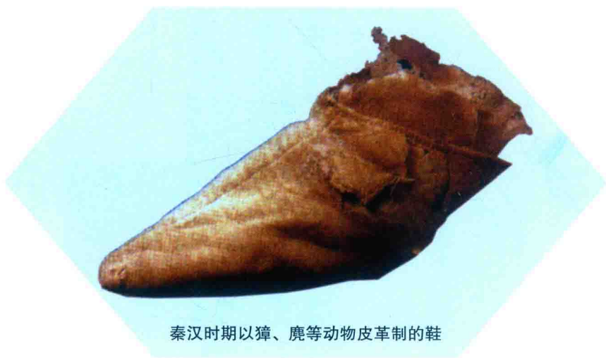
秦汉时期以獐、鹿等动物皮革制的鞋