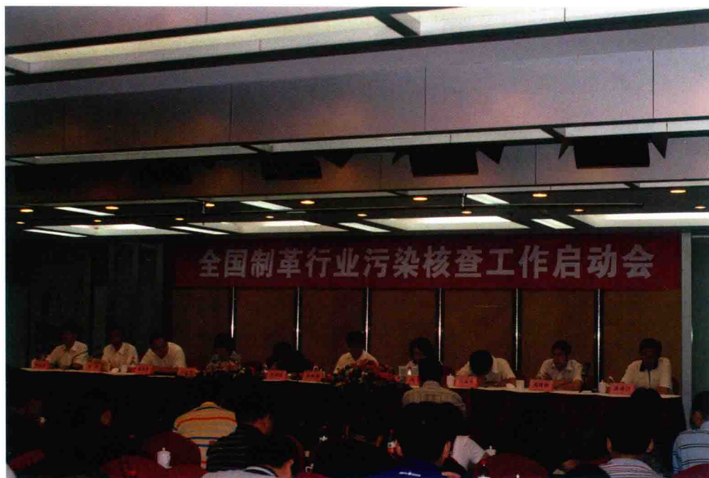
全国制革行业污染核查工作启动会(2010年)