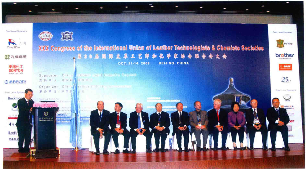
第30届国际皮革工艺师和化学家协会联合会大会在北京举行（2009年）