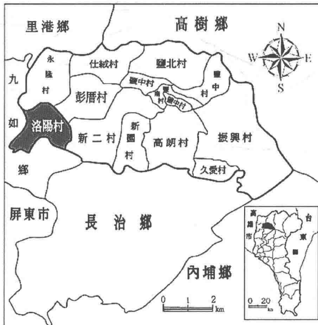
圖 1-2：洛陽村位置圖 (註 2)