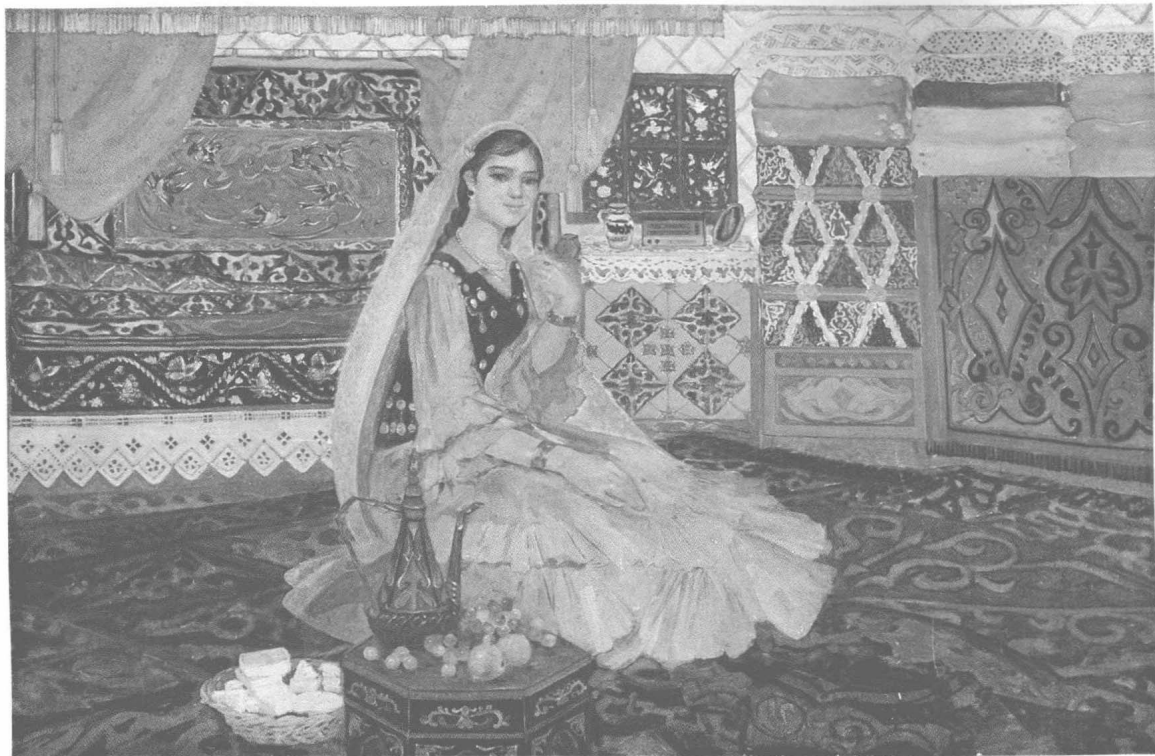
哈萨克新娘（油画） 高振美