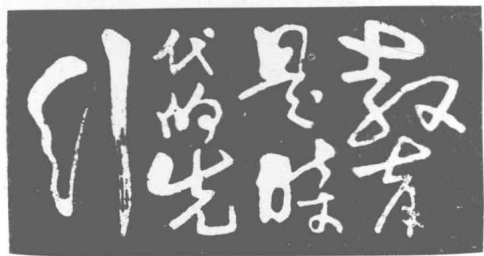
教育是时代的先行（篆刻）周骏