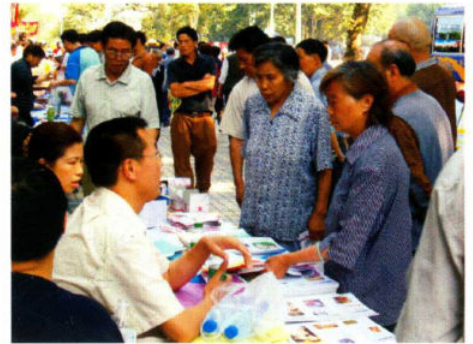
人口计生宣传咨询服务

红花岗区人口和计划生育局现有机构人员9人，法规宣传教育股、业务股、科技股和办公室，领导职数4人（局长兼党组书记1人，副局长3人）。另有2个下属事业单位（红花岗区流动人口计划生育管理办公室、红花岗区计划生育指导所）和1个挂靠事业单位（红花岗区计划生育协会办公室）。“十五”期间，红花岗区人口和计划生育工作在区委、区政府的高度重视和上级人口计生部门的精心指导下，取得了一定成绩。进一步稳定了低生育水平，人口出生率由2001年的14%下降到2005年的9.36%；人口自然增长率由2001年的8%下降到2005年的5.39%；符合政策生育率始终保持在96%以上。