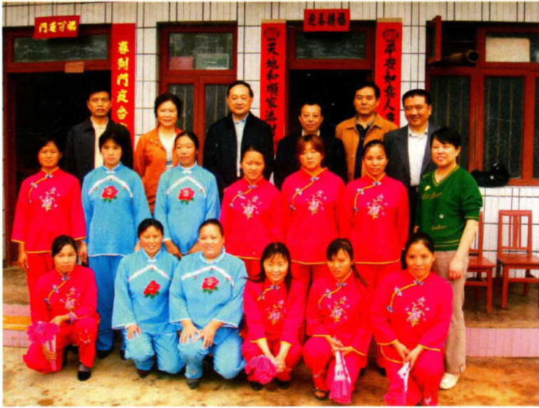
国家、省、市人口计生部门领导在我区视察工作期间与育龄妇女小组长合影