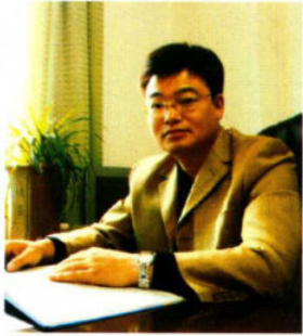
区教育局党委书记、局长杨劲松