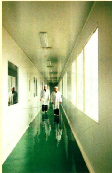
药用纯水处理系统