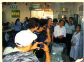
2006年9月17日，国家药监局、贵州省药监局、遵义市药监局来我公司步行街分店视察，并对我们的工作给予指导和肯定。

用芝林人的实际行动给人民群众带来真正的实惠。芝林大药房将始终如一地为人民提供放心药、低价药，芝林大药房通过不断的降价行动，真正让广大人民群众看得起病、吃得起药。