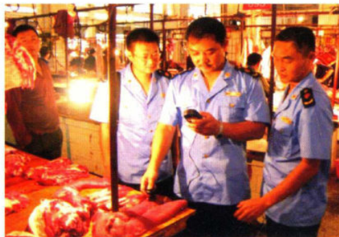
执法人员在辖区农贸市场对猪肉进行检测