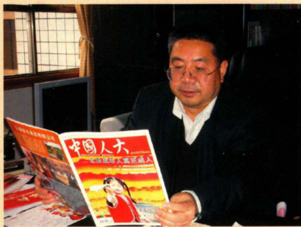
区人大主任 赵汝荣