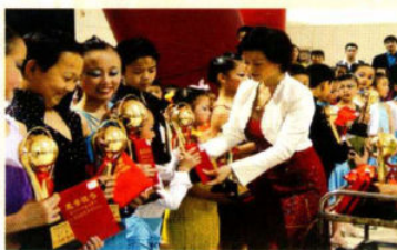
← 季红校长为学生颁奖