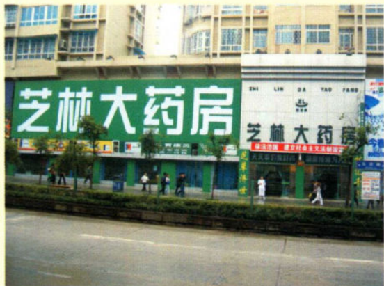
芝林大药房有限公司遵义总店

遵义芝林大药房有限公司始建于2003年12月6日，秉承“芝草济世、林汇千方”的宗旨和“天天平价卖好药、物超所值为人民”的经营理念，经过一年的艰苦创业，现已在遵义市北京路、中山路、步行街、上海路、茅草铺开有五家规模较大、品种较全、药价最低的药品零售超市，营业面积近2000平米，其中包括52个类别，15000个单品。并通过了国家GSP认证，同时开通了医保刷卡业务，给遵义市广大人民群众购药治病带来了真正的方便和实惠，取得了较好的经济效益和很好的社会效益。