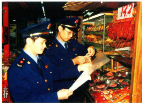
李思桥局长、唐正刚副局长在辖区农贸市场检查食品安全工作