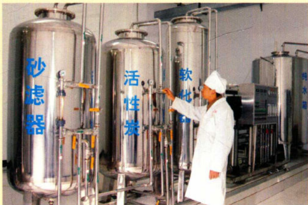
药用纯水处理系统

公司建有丸剂、片剂、胶囊剂、酊剂生产线各一条，正在研发的6个新药，为公司的可持续发展奠定了坚实的基础。