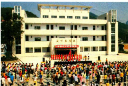
新蒲镇中桥学校新教学楼

2001年至今，红花岗区累计输送大专学生2597人，本科学生6589人。2006年，全区小学毕业考试双科合格率持续稳定；中考成绩名列全市第一；高考在全省考生大幅度提高的形势下，仍位列全市第二。