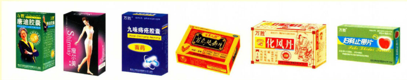
公司研制的部分保健品和药品