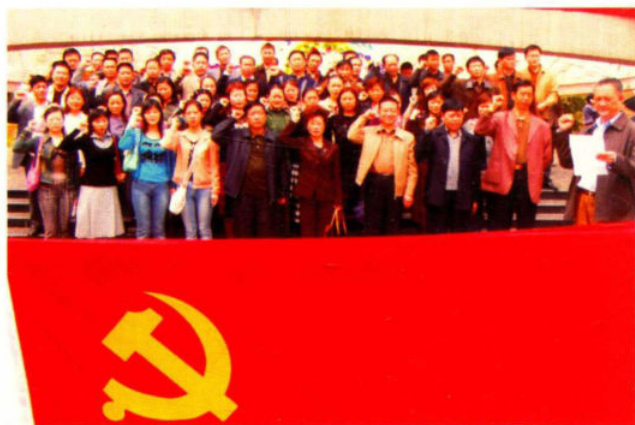
• 区民政系统党员在红军烈士陵园重温入党誓词