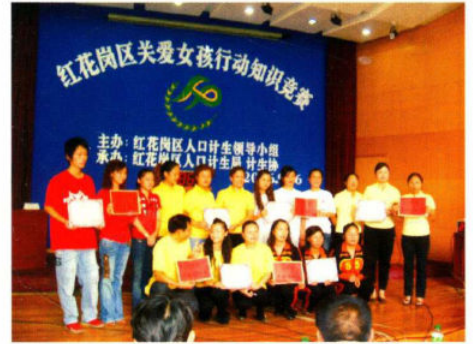
关爱女孩深入人心

同时，红花岗区人口计生局也先后荣获“2001-2003遵义市第二届文明单位”、“1998-2005遵义市人口和计划生育先进单位”、“遵义市优秀基层党组织”、“遵义市人口和计划生育工作先进集体”等称号，并连续九年获全市计划生育目标考核业务线一等奖。