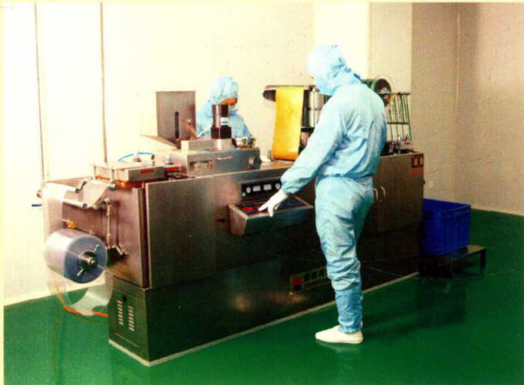
药用纯水处理系统