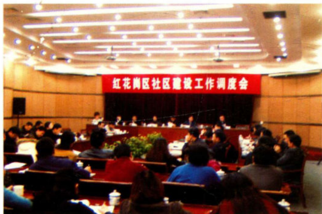
• 区委，区政府经常召开社区建设工作调度会

2006年，红花岗区民政局坚持以邓小平理论和“三个代表”重要思想为指导，牢固树立以民为本，为民解困宗旨，弘扬“孺子牛”精神，切实做到“上为政府分忧，下为百姓解愁，深怀爱民之心，恪守为民之贵”，为广大人民群众服务，为最需要帮助的困难群众服务，为改革、发展、稳定大局服务，各项民政工作取得了显著成绩。