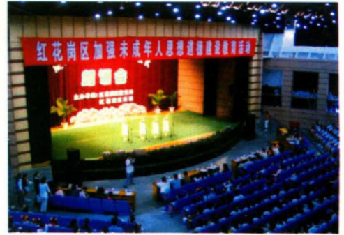
广泛开展文体活动