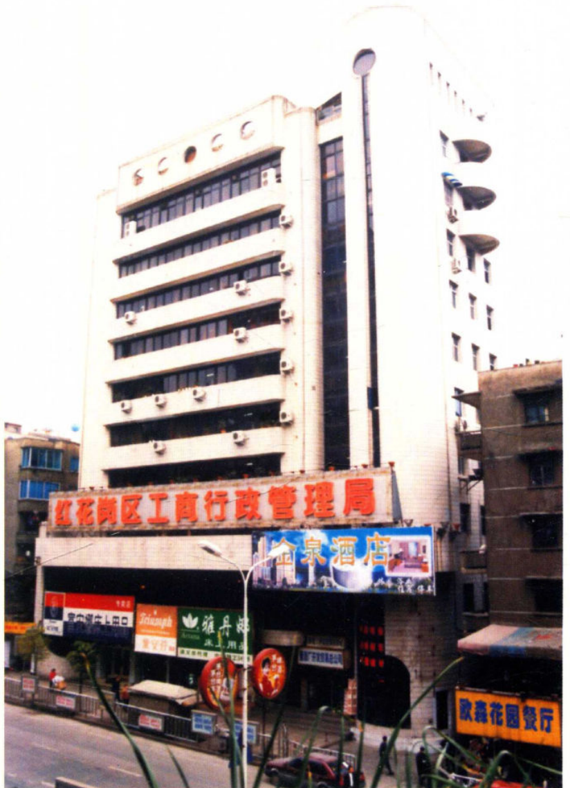
位于中华南路234号的办公大楼