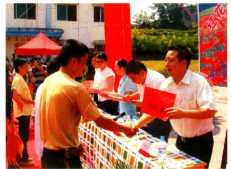
奖励扶助惠泽计生家庭