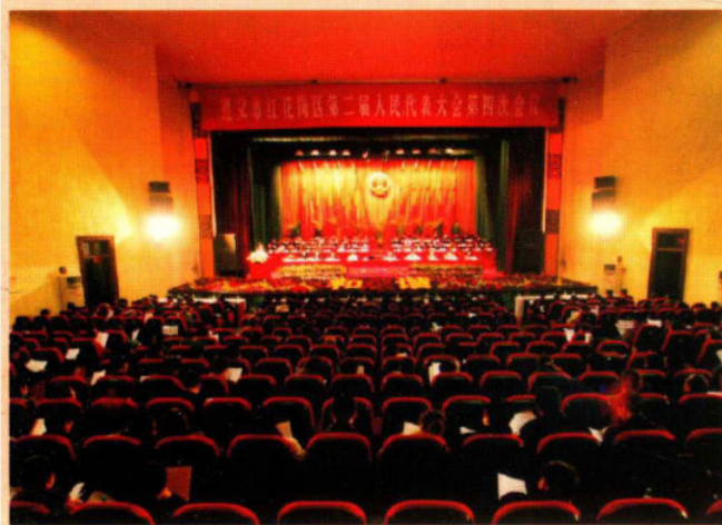
区人大二届四次会议