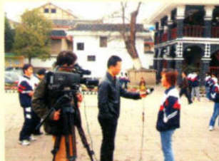
央视采访我院学生

东区：贵州省遵义市红花岗区新蒲镇 电话：0852-8655018 (传真) 邮编：563006 西区：贵州省遵义市红花岗区官井路75号 电话：0852-8211003 传真：0852-8210518 邮编：563000 邮箱：zyzybgs@163.com 网址：www.zyzy.gov.cn