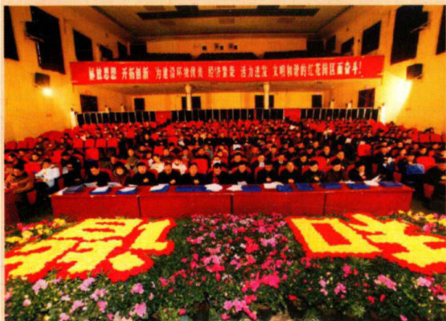
建设环境优美、经济繁荣、活力进发、文明和谐的红花岗区