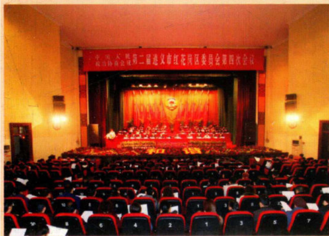
区政协二届四次会议