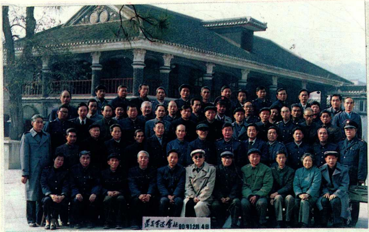
参加《遵义地区税务志》审稿会议全体代表合影