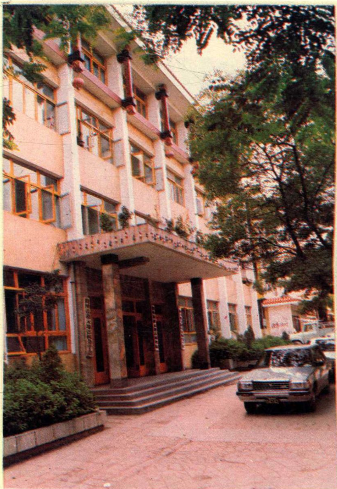
遵义地区税务局办公大楼