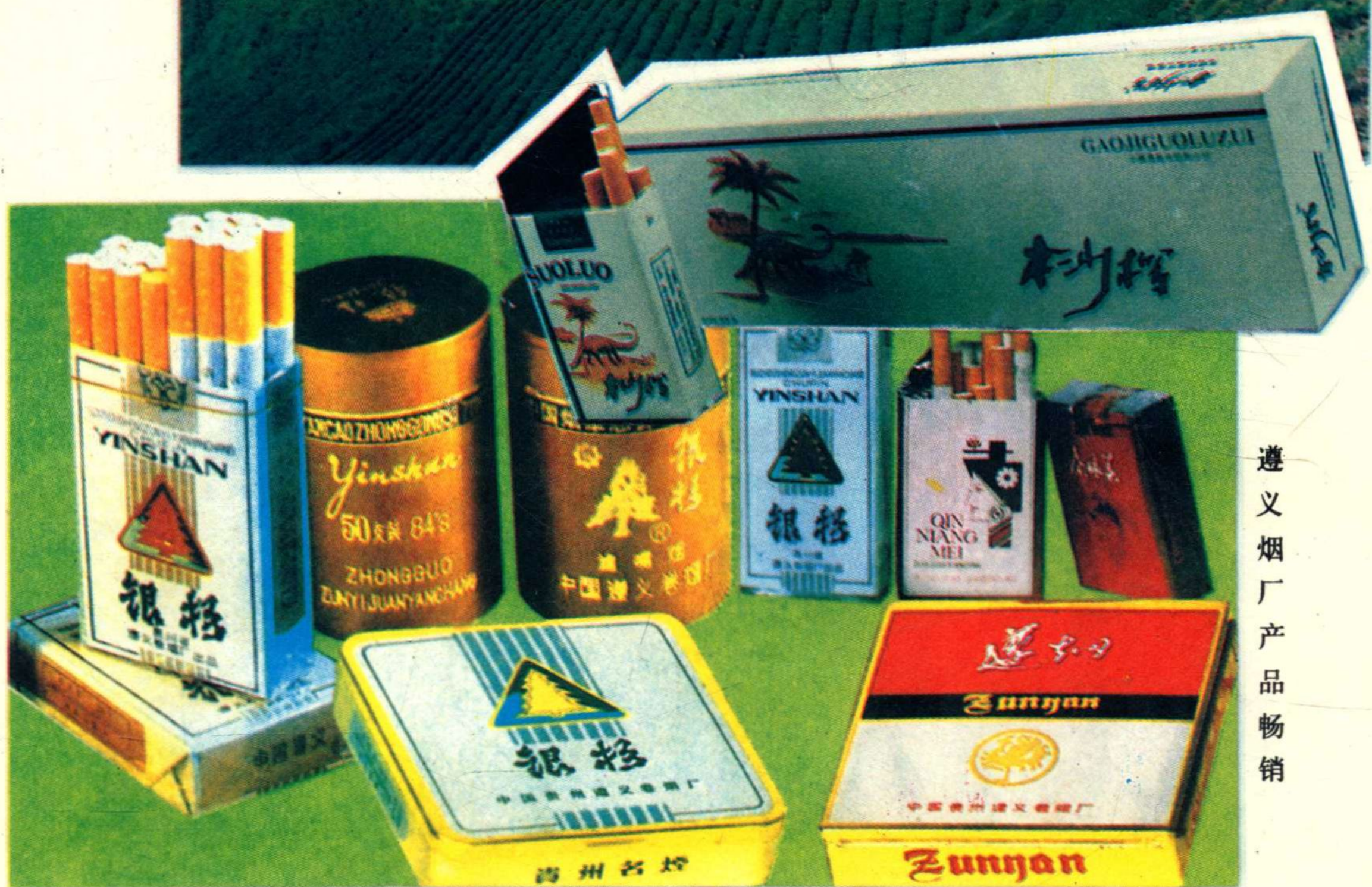
遵义烟厂产品畅销