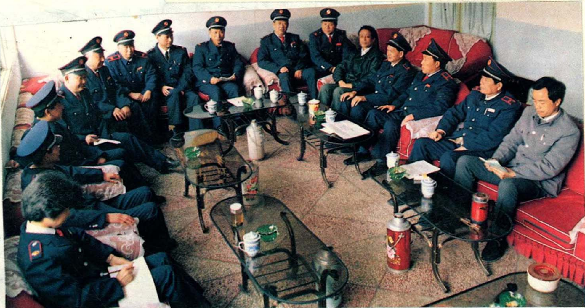
税务学会常委会议