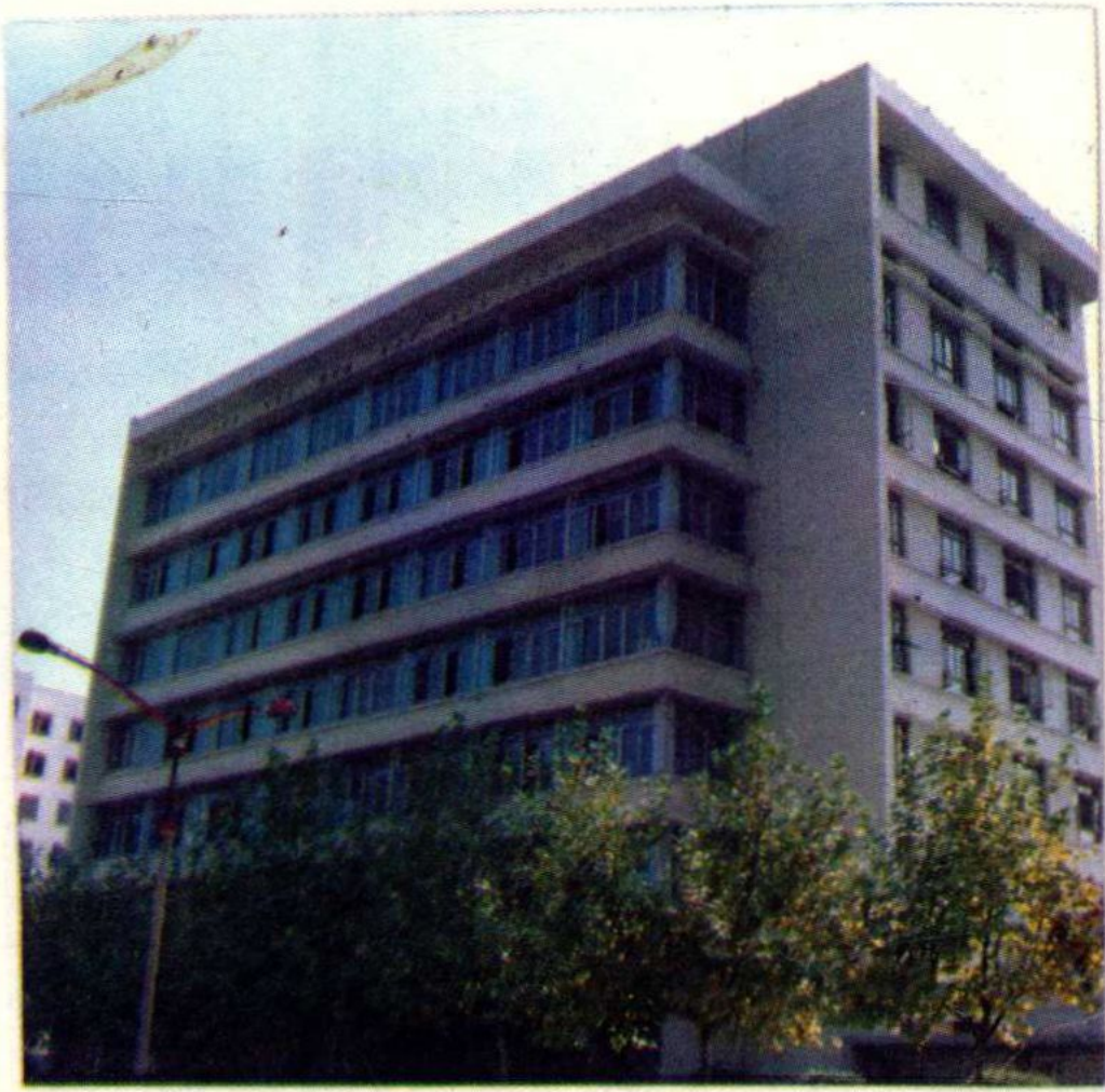
遵义市税务局办公大楼