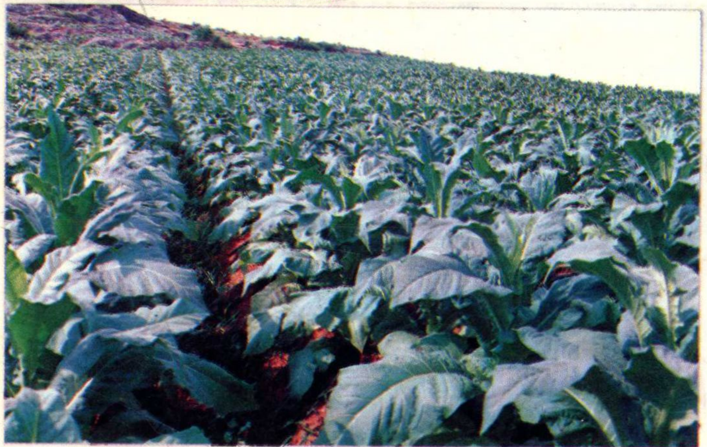
遵义地区烤烟生产基地