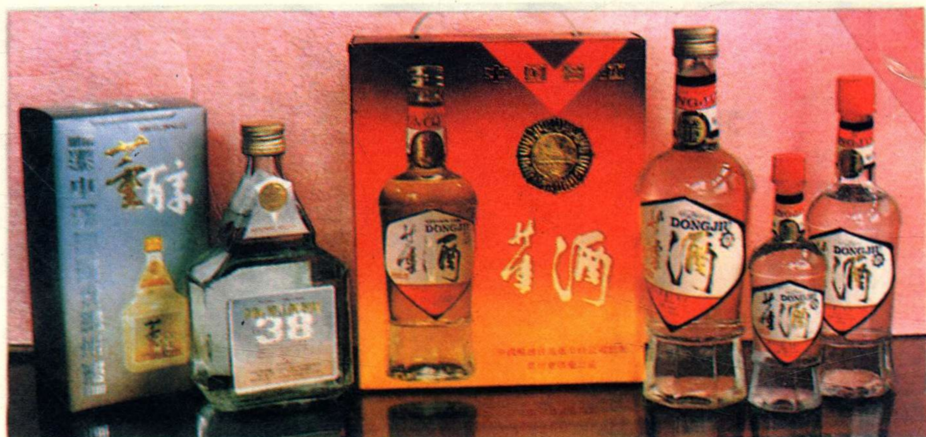
国家名酒黔北之光