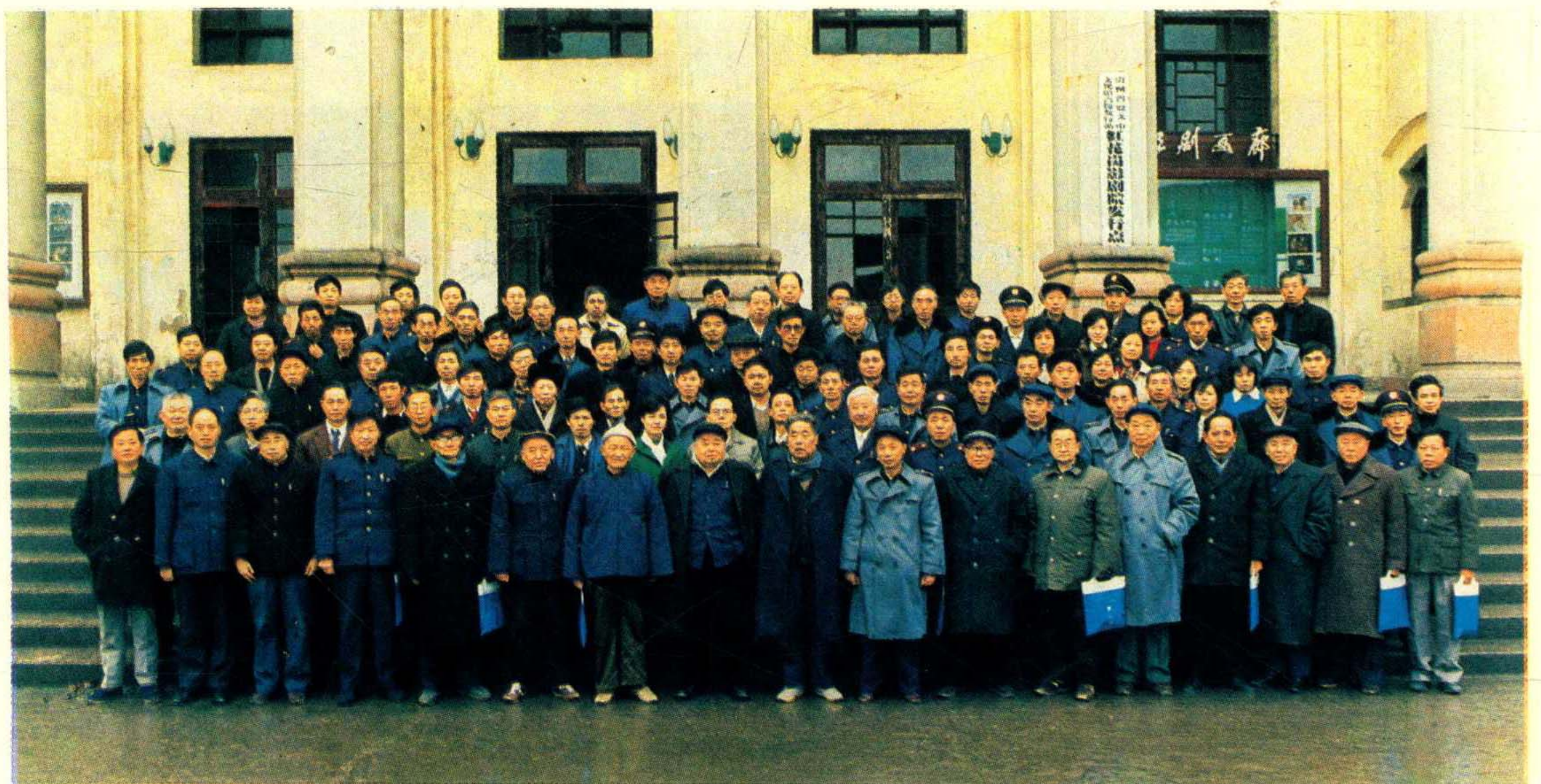
遵义地区税务学会第二届会员代表会议全体代表合影