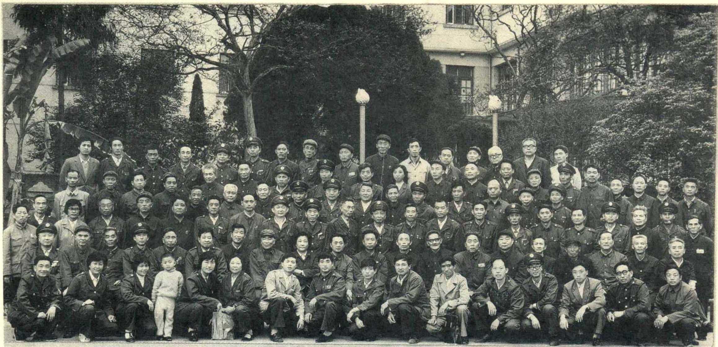
1985年遵义地区税务学会首届会议全体代表合影