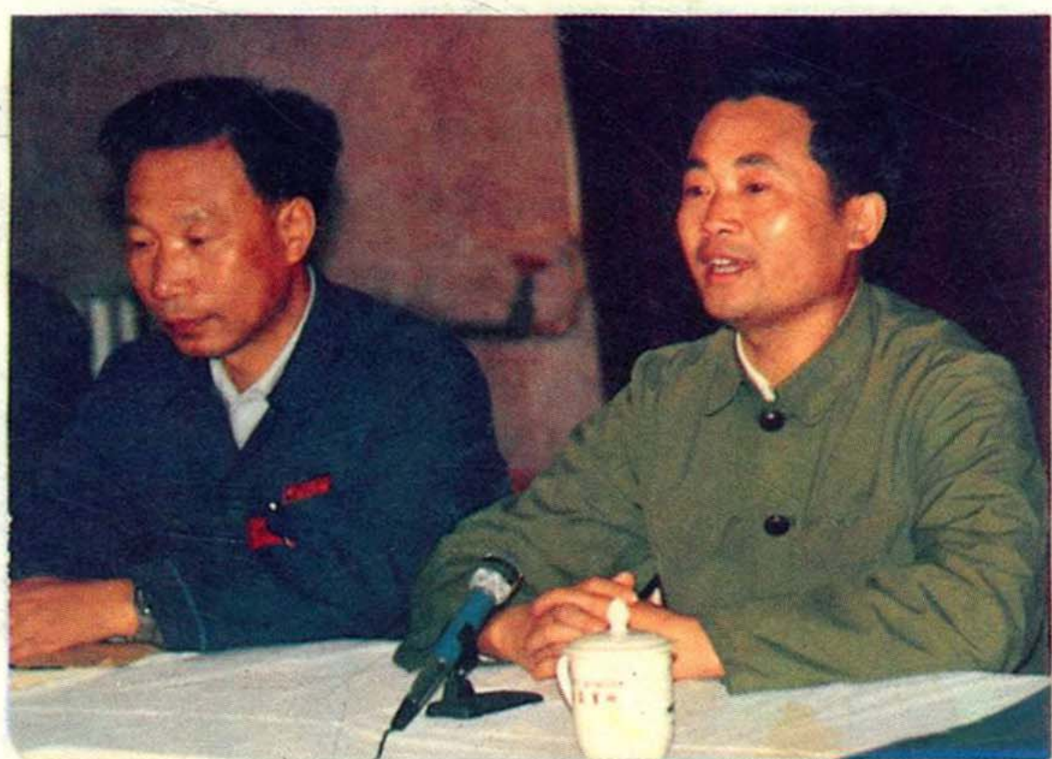
贵州省税务局孙德生局长 在遵义地区税务学会成立大 会上发言