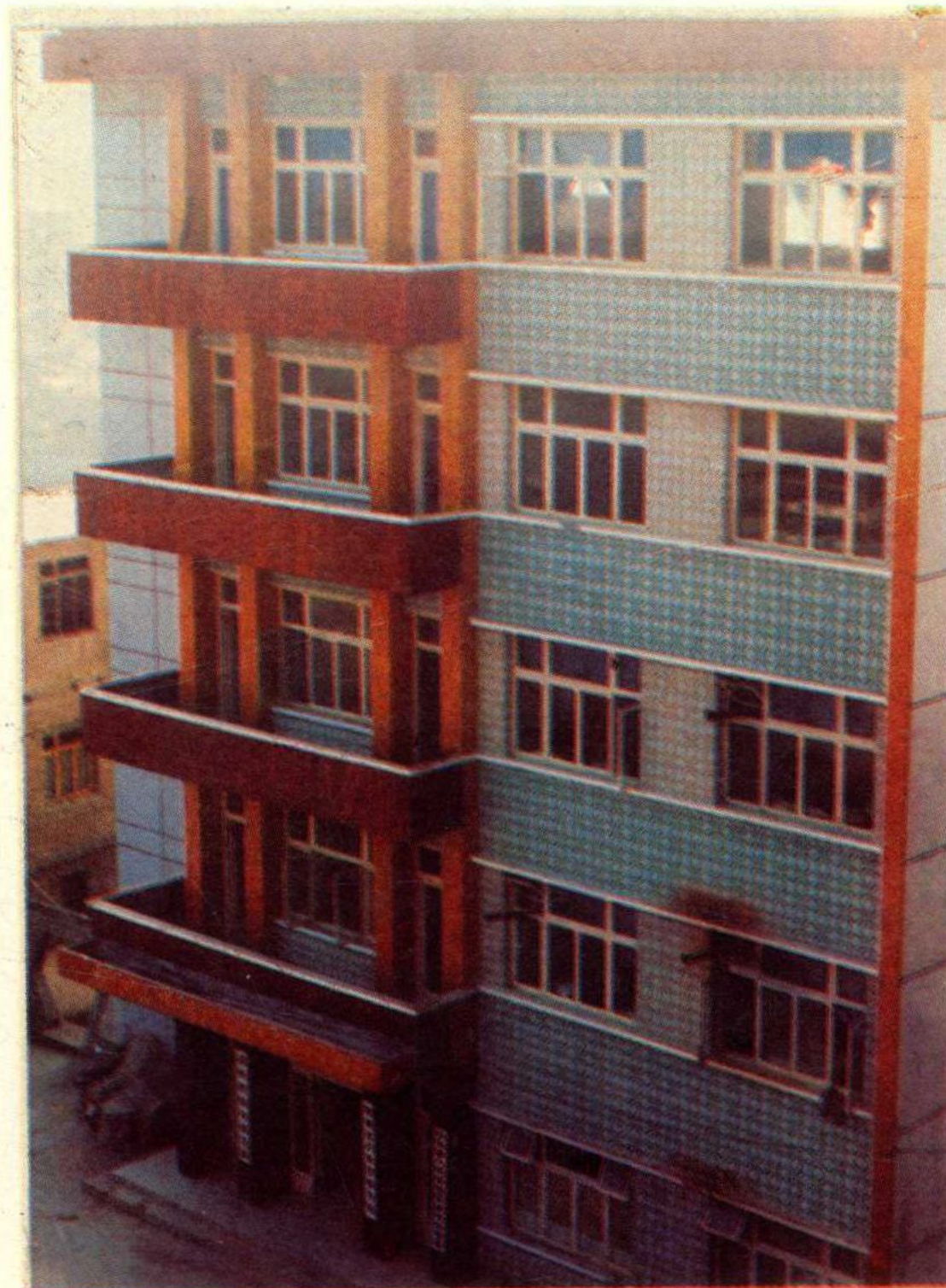
习水县税务局办公大楼