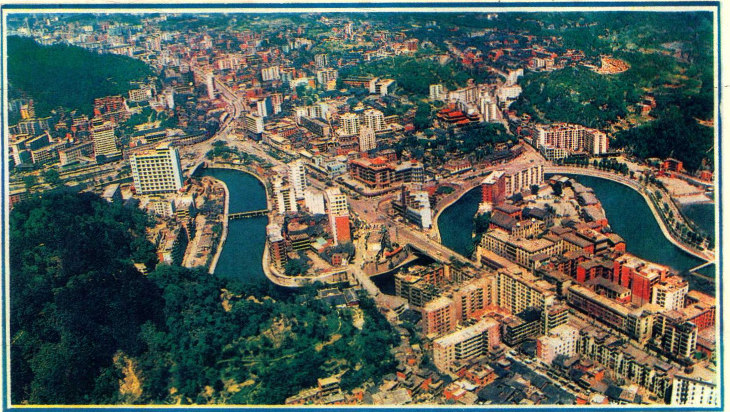
历史名城—遵义全景