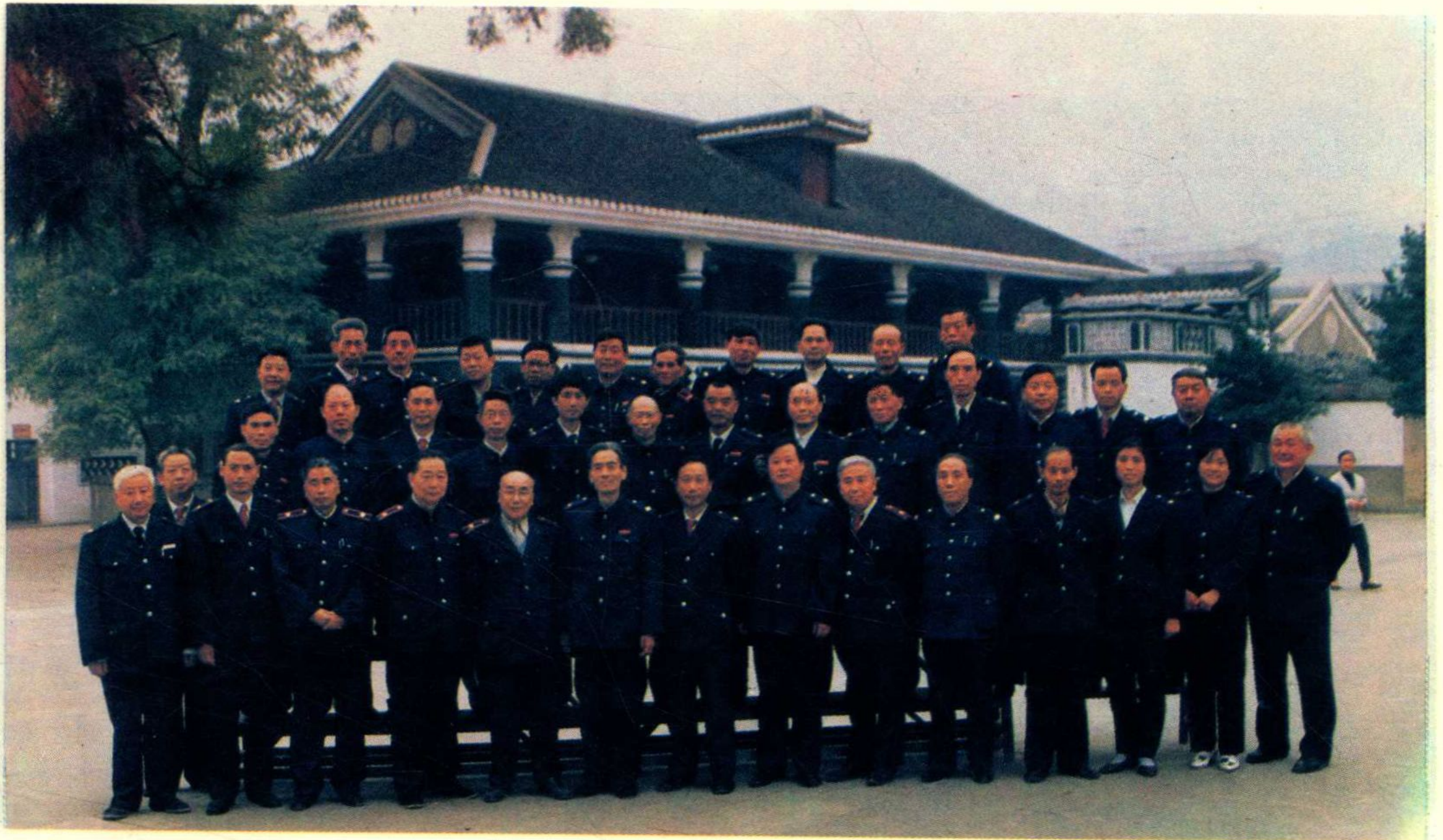
地区税务局正副局长、正副科长，各县、市税务局长合影