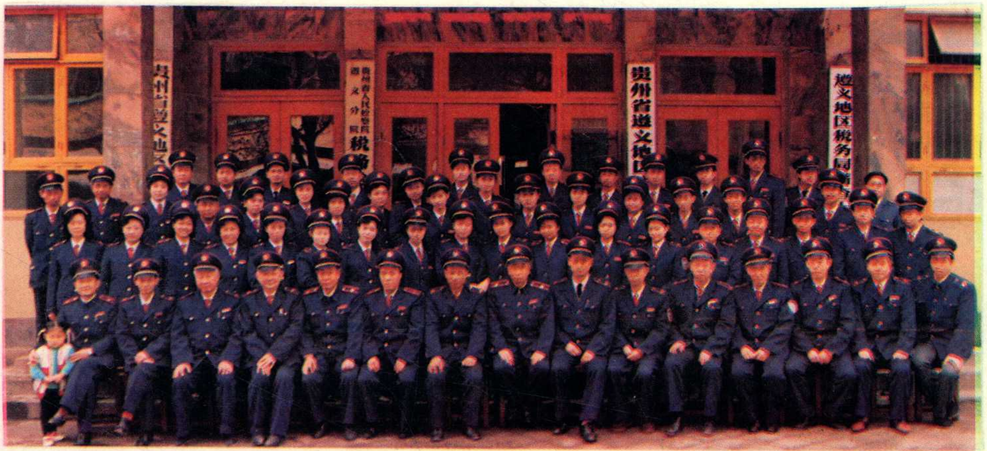
遵义地区税务局全体同志合影