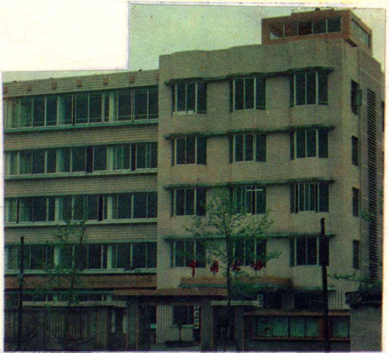
桐梓县税务局办公楼