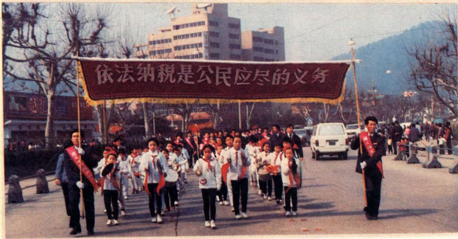
遵义地区税务局组织少年儿童、局机关全体职工上街宣传税法