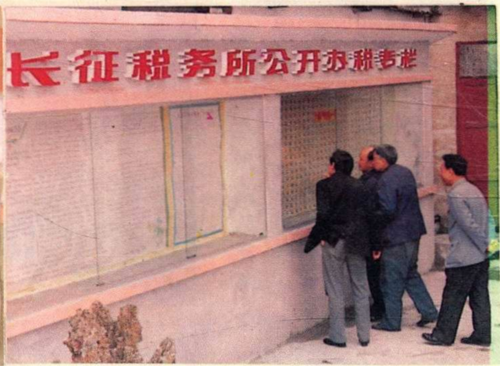
胡伟、张如烈、蒋哲信领导同志深入基层检查征管改革