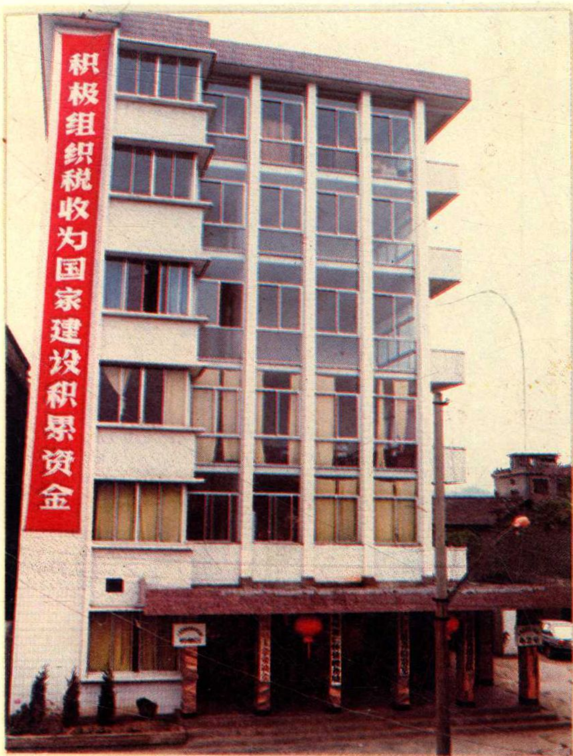
仁怀县税务局办公大楼