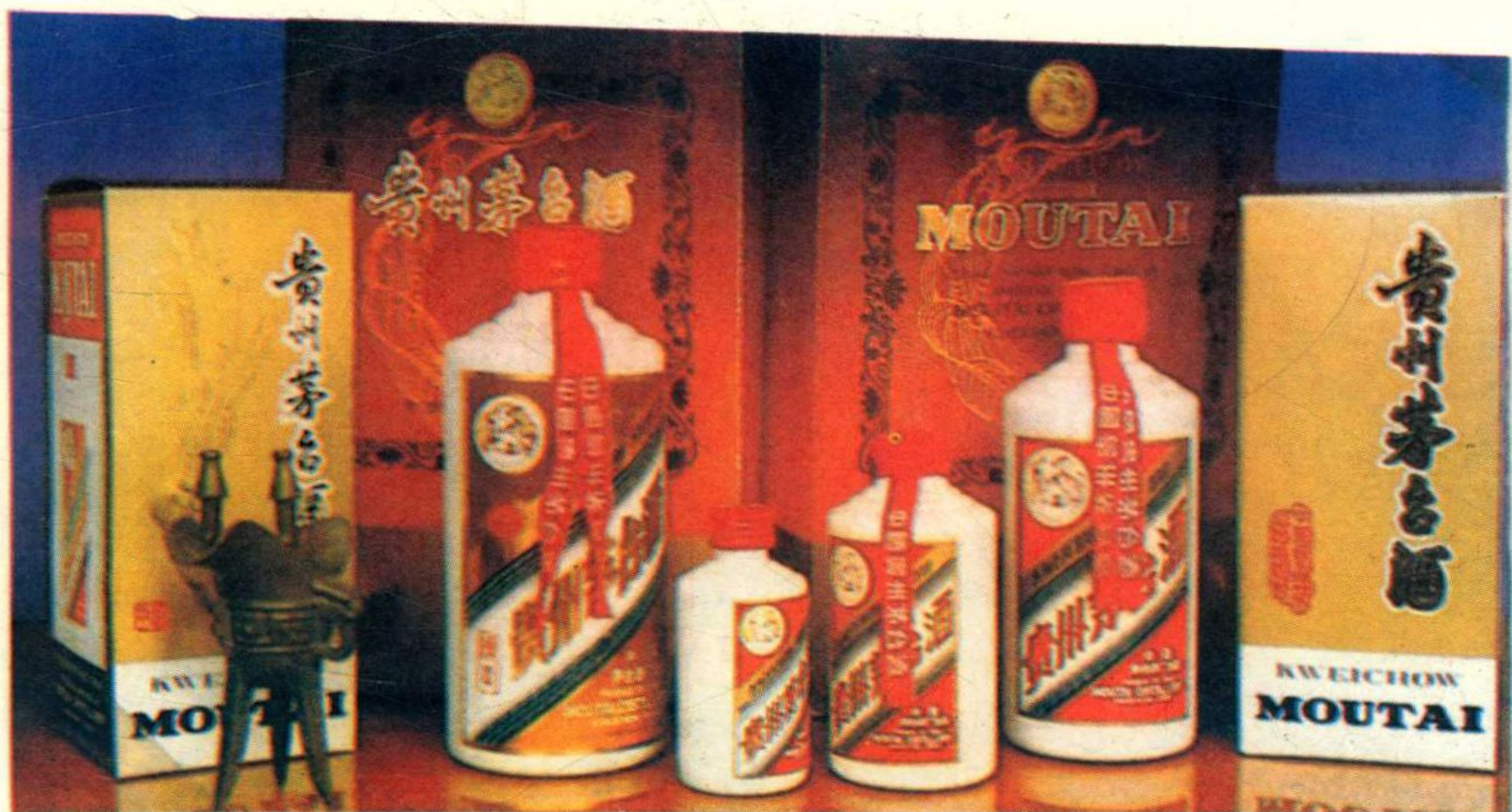
世界名酒 国家之光