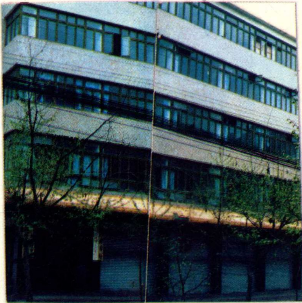
务川自治县税务局办公大楼