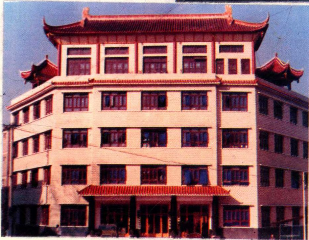
赤水市税务局办公楼