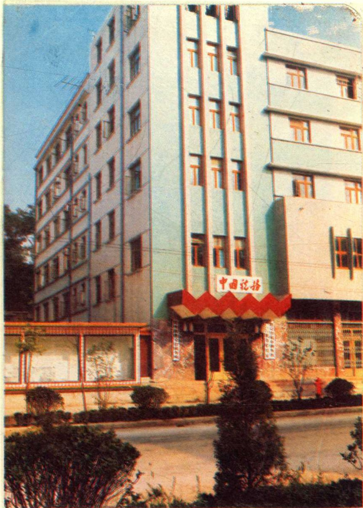
遵义县税务局办公大楼