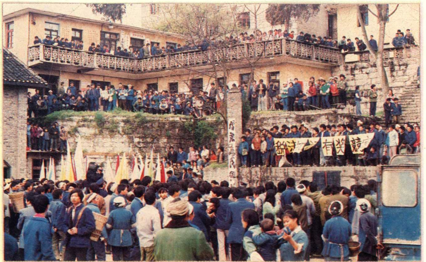
仁怀县税务局在群众中开展税法知识有奖竞赛活动