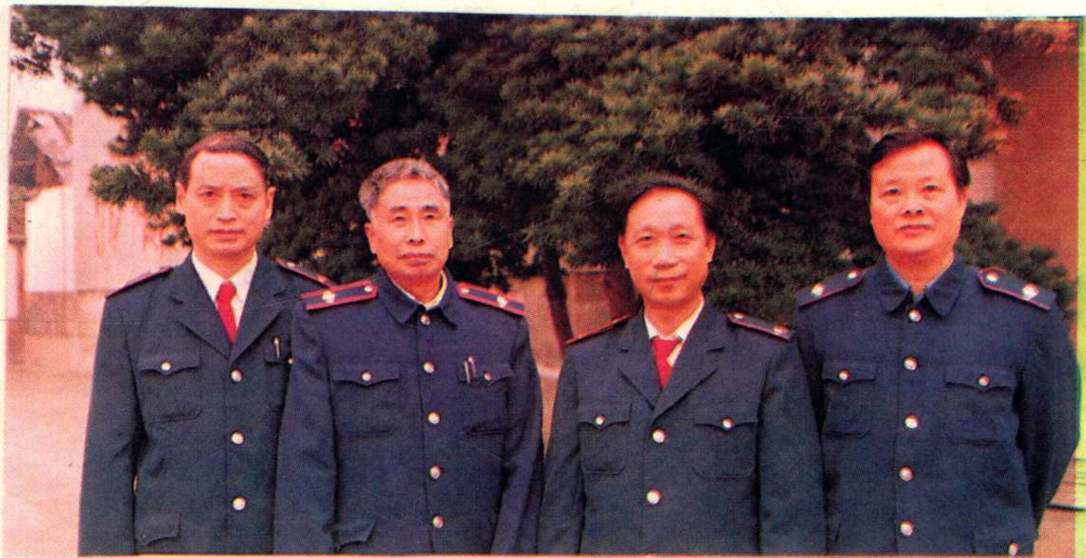
一九八九年遵义地区税务局领导合影