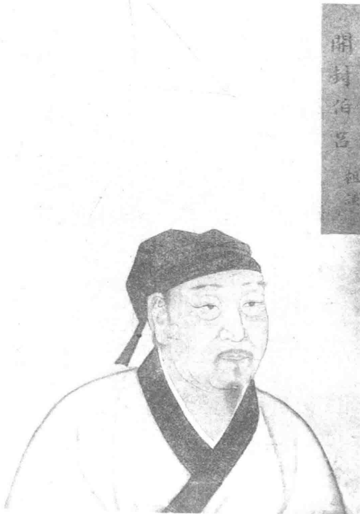
圖1 開封伯呂祖謙畫像（臺北故宮博物院藏）