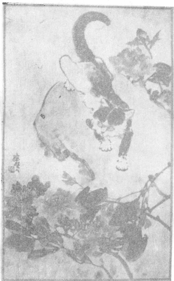
● 刘继贤 作