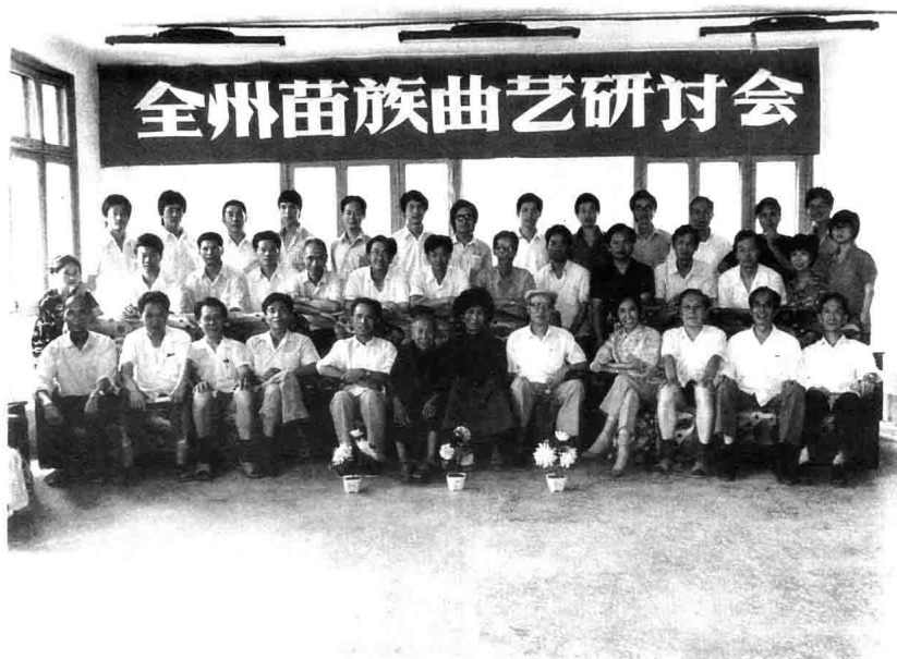
参加苗族曲艺研讨会的代表合影