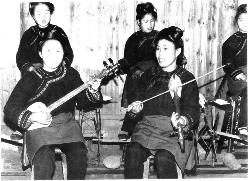
侗族弹唱乐器： 左：侗族琵琶 右：牛腿琴（果吉）