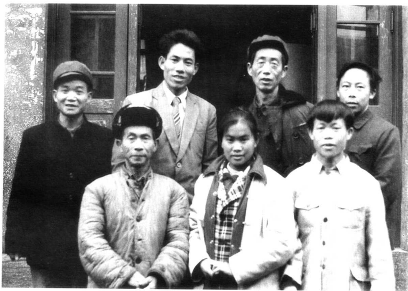
参加天柱县1987年元旦文艺调演的民间阳戏师和演员