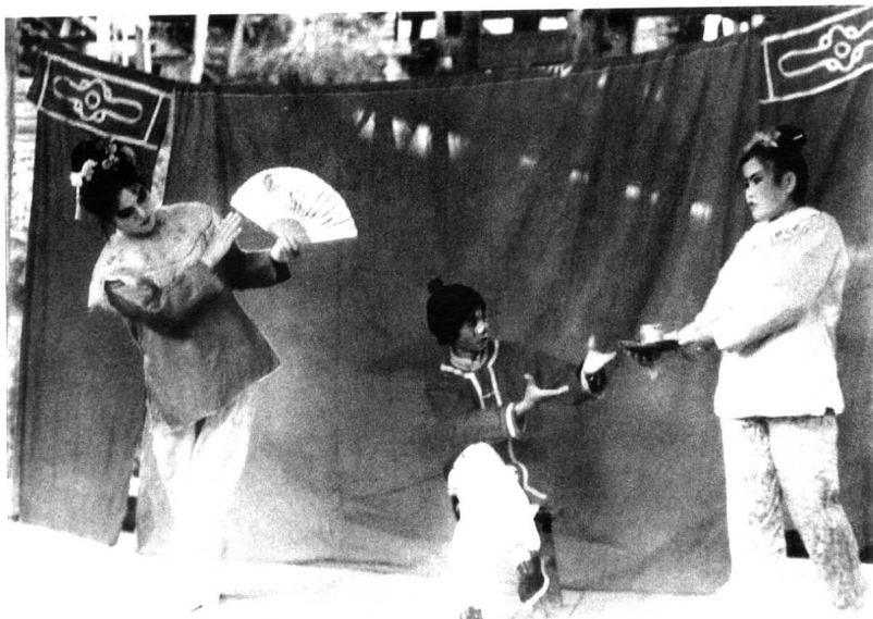
阳戏《同园妹》(黎平县顺洞乡桥头寨阳戏班演出)