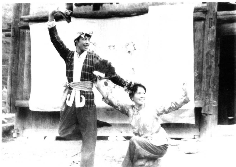
阳戏《对调子》(黎平县水口镇金岩阳戏班演出)