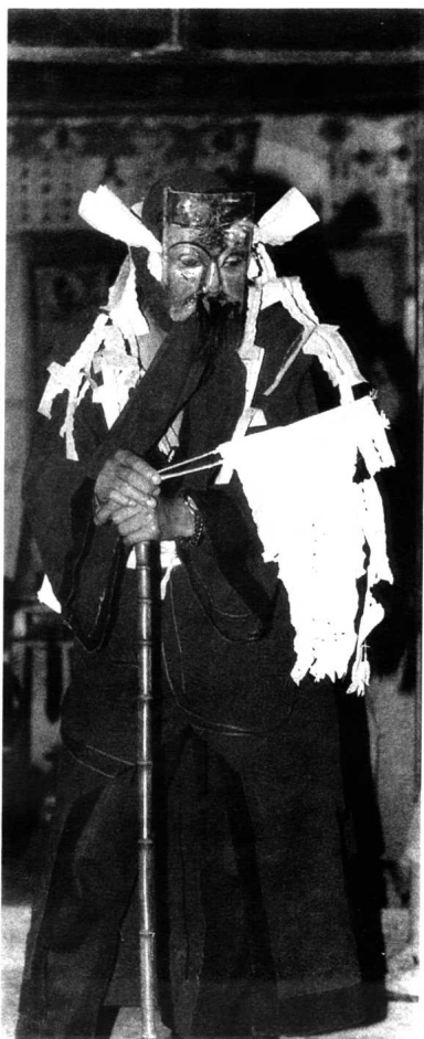
傩戏《领兵土地》中的领兵土地