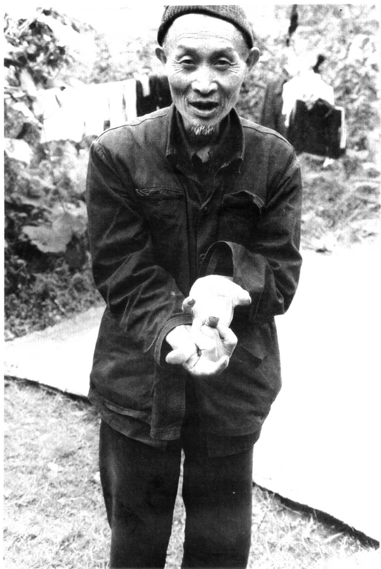
傩戏演出中的手诀