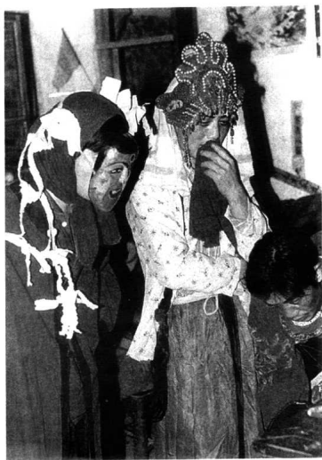
傩戏《笑和尚戏仙锋》 中的笑和尚和仙锋