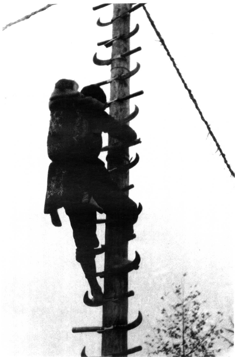
傩戏特技 背娃娃上刀梯