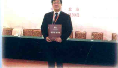
何梁何利基金2013年度颁奖