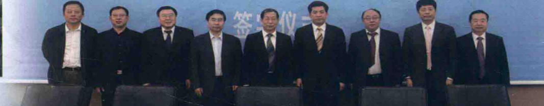
中国地震局与大连市人民政府创建大连防震减灾示范城市暨中国地震局工程力学研究所与大连大学防震减灾博士点建设签字仪式。