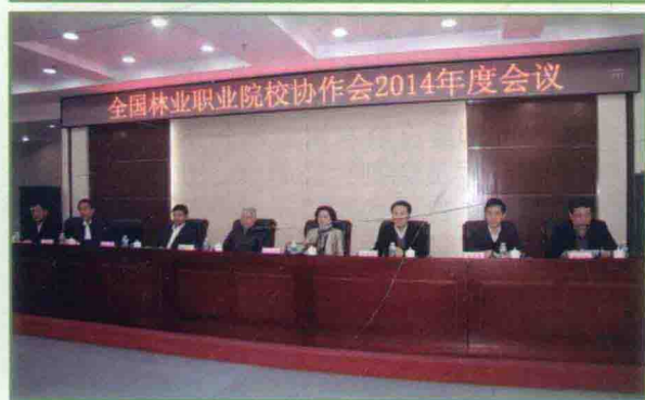
2014年度全国林业职业院校协作会在学院举行，中国林业教育学会、林业教育教学指导委员会、国家林业局职教研究中心和黑龙江省森工总局、省教育厅领导出席会议，全国有23所林业职业院校领导与专家参加了会议