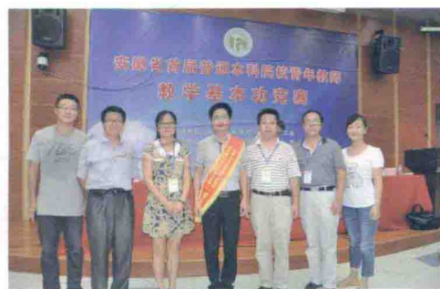
学校组队参加全省青年教师基本功比赛获一等奖

学校与美国、澳大利亚等26个国家和地区的41个医疗和教育机构建立了友好合作关系。1994年获准招收国外留学生。与美国、瑞典、新加坡、日本、韩国及港澳台地区的院校开展学者互访和学生交流活动。