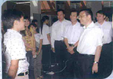
2007年9月，时任辽宁省委书记李克强在大连市委书记张成寅、市长夏德仁、辽宁省教育厅厅长魏小鹏的陪同下，视察我校。

目前，大连大学已进入了“调结构、建特色、上层次”的发展阶段。学校将继续实施“质量立校、人才强校、文化兴校、依法治校”的办学方略，凝练学科方向，转变发展模式，立足大连，服务辽宁，面向全国，努力建成规模适度、质量优异、结构合理、特色明显，优势突出，部分学科居于省内领先地位、综合实力处于国内地方高校一流水平的教学研究型地方大学。