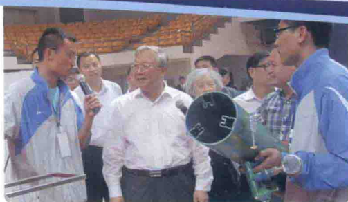
施胜男等5名同学参加全国航模比赛荣获二等奖,受到全国人大常委会原副委员长、两院院士路勇祥接见并进行了认真交谈