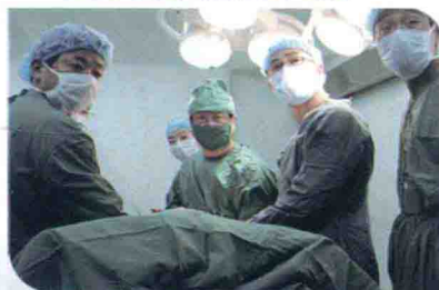
我校附属中山医院采用干细胞移植保头手术 治疗股骨头坏死患者手术中