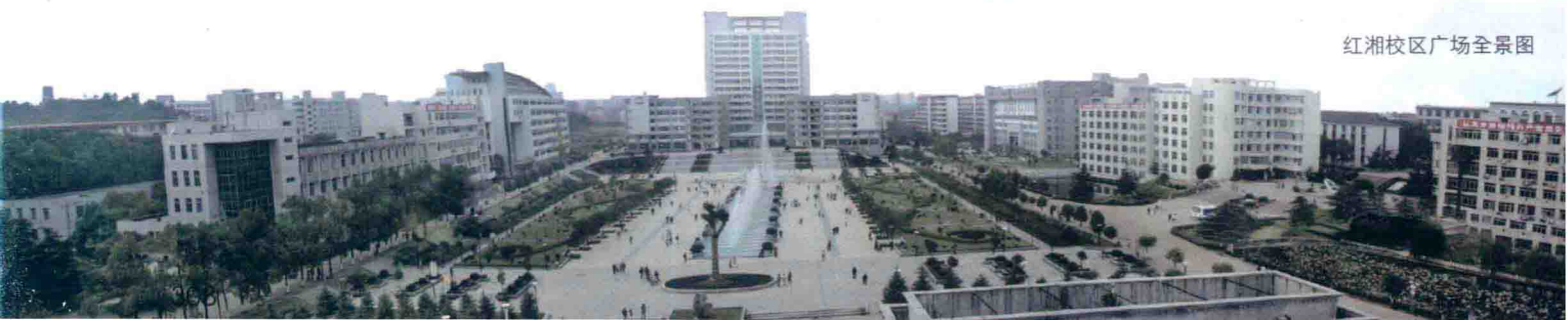
红湘校区广场全景图