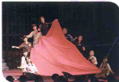
由大连大学音乐学院重新排演的第六代歌剧《江姐》在大连人民文化俱乐部上演