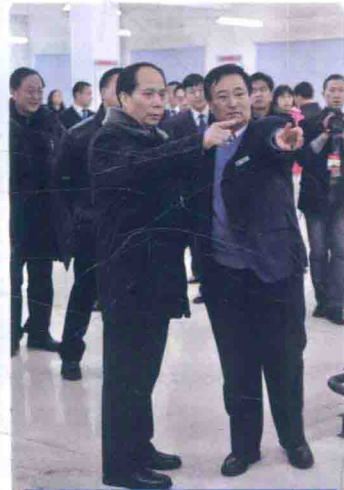
原黑龙江省委书记吉炳轩视察学院

黑龙江建筑职业技术学院位于北方名城哈尔滨市，是一所公办全日制普通高等学校，是全国第一批和黑龙江省第一所独立建制的高等职业技术学院。2001年和2003年黑龙江省建筑材料工业学校和黑龙江省纺织工业学校先后并入学院。学院目前占地面积96万平方米，校舍建筑面积38.8万平方米，实训基地建筑面积近4.7万平方米，实验仪器设备总值8664.7万元，馆藏图书资料76万余册。学院设有13个二级学院和4个教学部，55个专业及专业方向，专任教师478人，正高职58人，其中教授54人，副教授171人，全日制在校生1.2万余人。享受国务院特殊津贴和黑龙江省政府特殊津贴者1人。