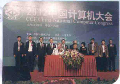
大连大学承办2012中国计算机大会。