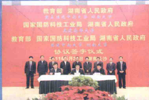
国防科工局与湖南省人民政府共建签约