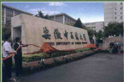
2013年5月，学校正式更名安徽中医药大学