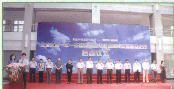
2013年6月5日，黑龙江省“生态文明一年一主题”系列宣传活动暨“龙江环保世纪”启动仪式在学院隆重举行