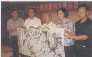
中心书画家向贺州市委宣传部赠送美术作品