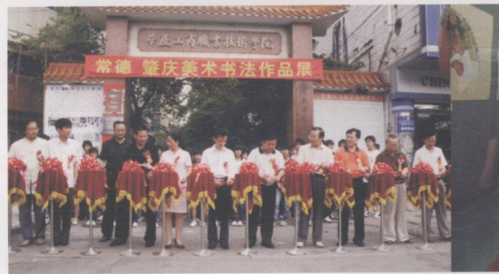
在肇庆城区举行湖南省常德市、肇庆市美术书法作品联展