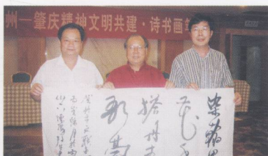
中心艺术总监、著名书画家郭邦生向贺州市委领导赠送书法作品