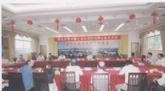
2006年7月26日在高新区举行肇庆市诗书画艺术创作研究中心成立大会