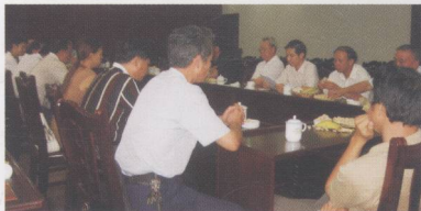
中心组织诗书画家举行学习贯彻十七大精神座谈会

肇庆市诗书画艺术创作研究中心成立至今刚刚走过两个春秋，令人振奋的是，一批深受广大观众喜爱的优秀作品脱颖而出。这批作品，是肇庆优秀文艺精品的其中一部分。