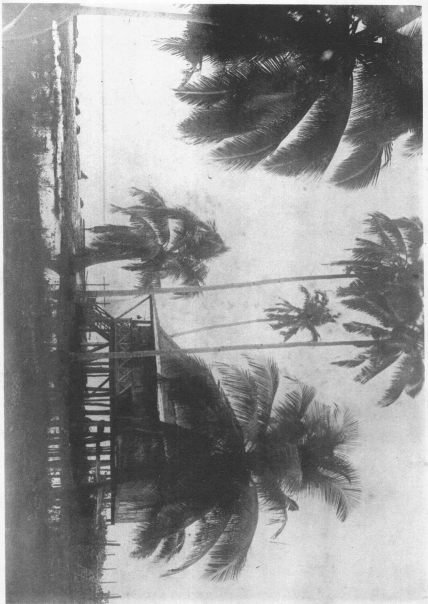
比 律 賓 薩 姆 阿 附 近 濱 海 風 光