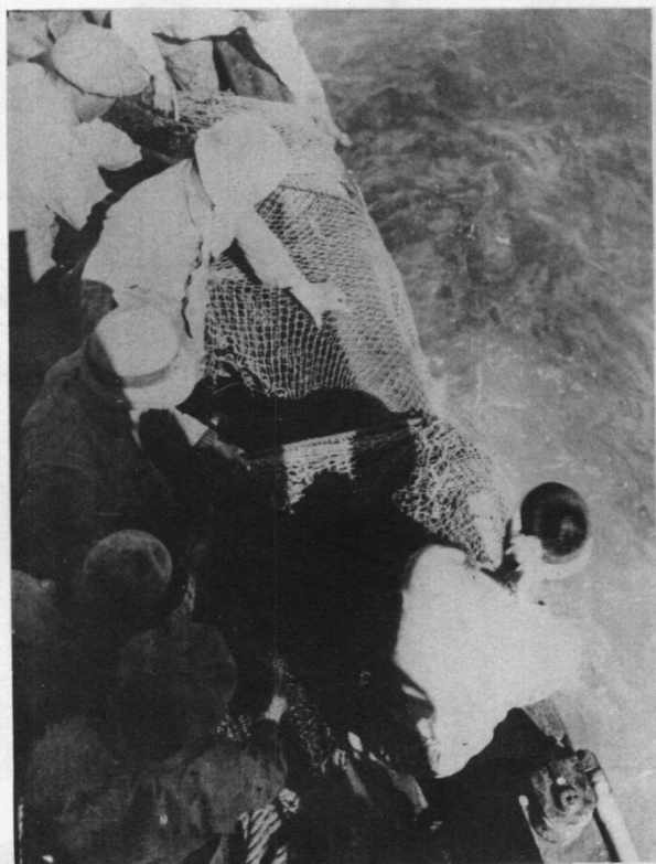
況狀揚引部囊の網繰手 (査調の場漁魚底丸海凌)