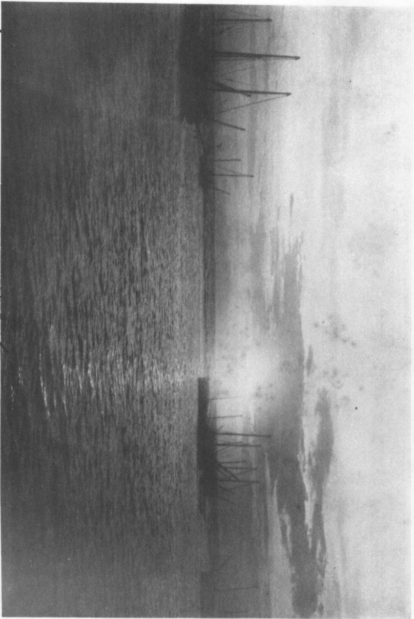
馬 尼 刺 灣 の タ 沙