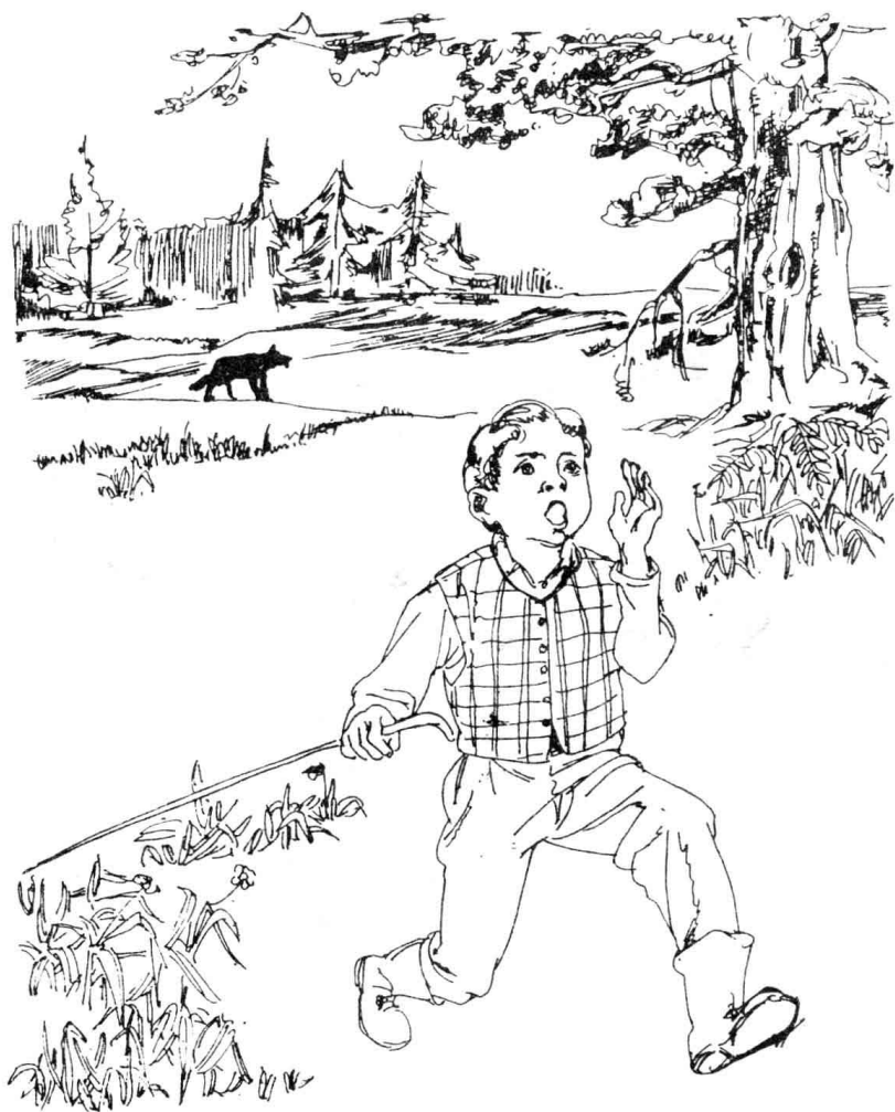
插图 2 喊“狼来了”的男孩