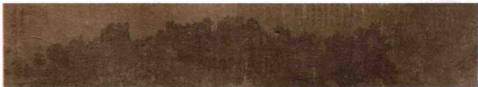
清溪渔隐图 宋·李唐

duō yán sù qióng bù rú shǒu chōng 多言数 速 穷 ⑤ ，不如守中 冲 ⑥ 。