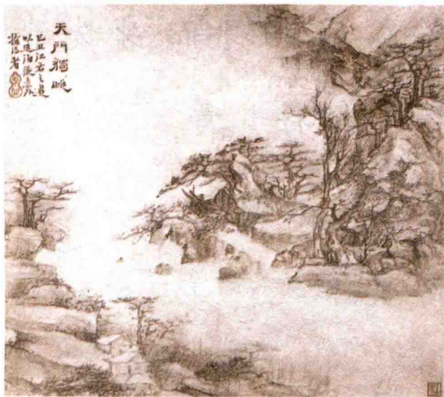
山水纪游图 清·高凤翰

mián mián ruò cún yòng zhī bù qín 绵绵 ③ 若存，用之不勤 ④ 。