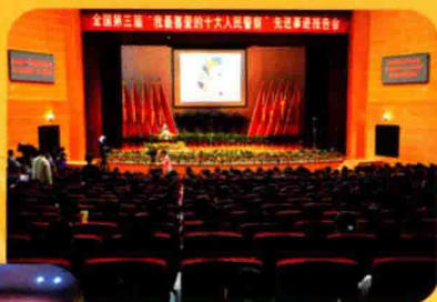
全国第三届“我最喜爱的十大人民警察”先进事迹福建专场报告会在我校举行