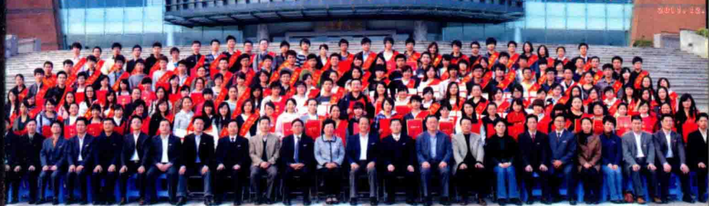
福建师范大学 2010-2011 学年学生表彰暨优秀学生报告会出席领导与受表彰学生代表合影