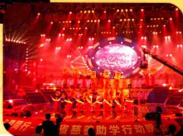
福建省慈善助学晚会在我校举办

2010年秋季全国人力资源市场高校毕业生就业服务福建用人单位招聘大会 福建省2011年大中专毕业生福州地区大学新校区专场招聘会