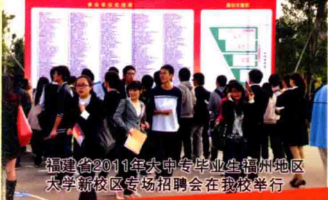
福建省2011年大中专毕业生福州地区大学新校区专场招聘会在我校举行

2010年秋季全国人力资源市场高校毕业生就业服务福建用人单位招聘大会 福建省2011年大中专毕业生福州地区大学新校区专场招聘会