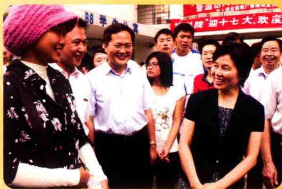
省委常委、副省长、 省教育工委书记陈桦 看望我校学生