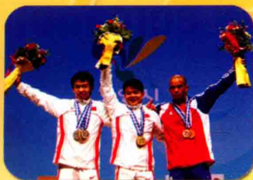
我校学子吴景彪同学（左一）夺得2009年世界举重锦标赛1金2银