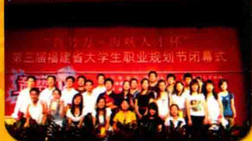
全省大学生职业规划节在我校举办