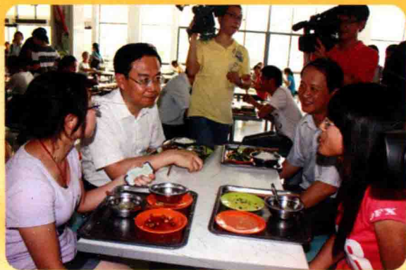
校党委书记罗莹陪同 省长苏树林与同学们 一起用餐并亲切交谈