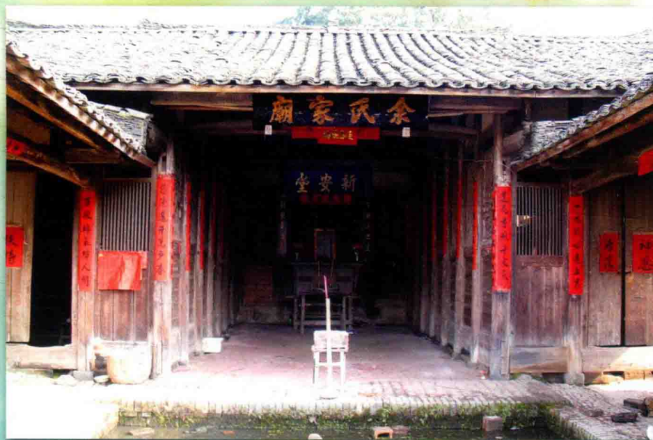
余氏家庙位于连城朋口上莒溪上村。