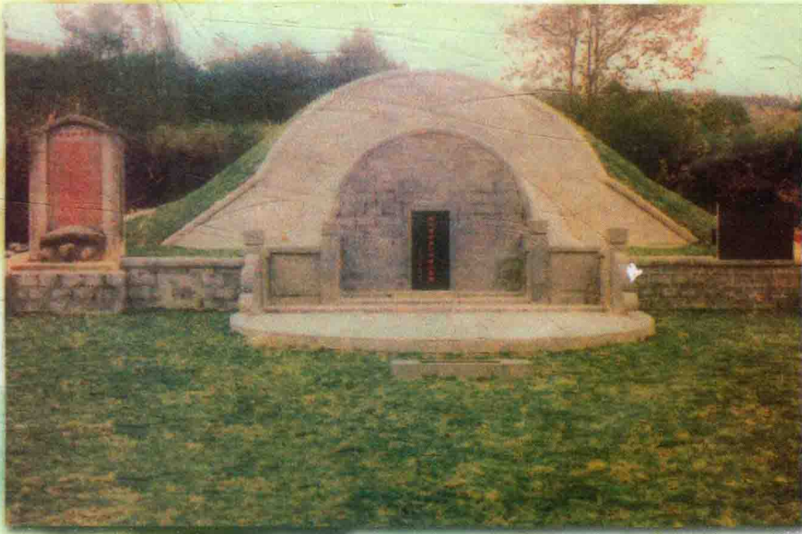
靖公墓，位于广东韶关西联镇甘棠成家山。