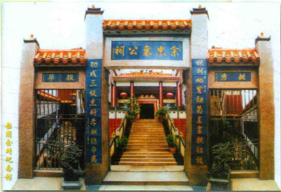
靖公祠，位于广东韶关市。