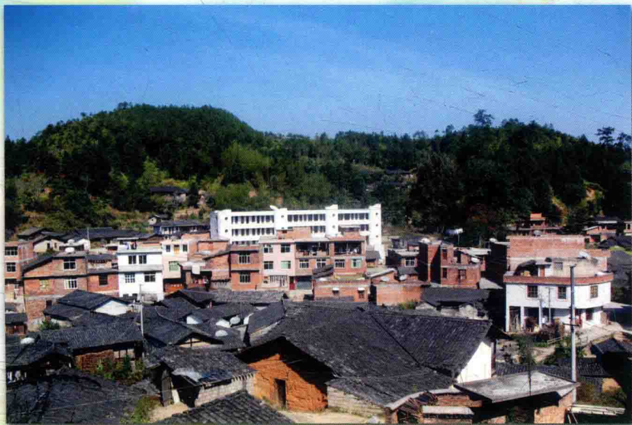
上 莒 溪 一 角