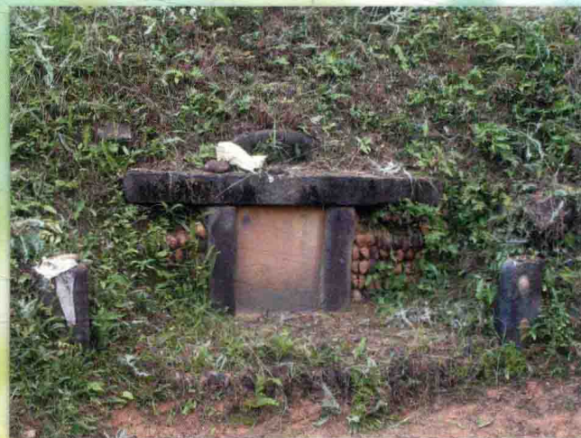
善荣公墓位于上莒溪罗背，岭倒插金鐔形，辛山乙向。