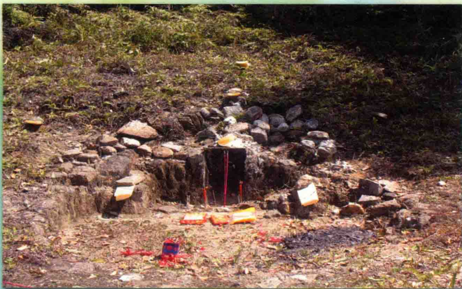
万六郎墓位于八仙岩背，即长汀县杨谢村余氏科祖屋背的龙根上，虎形，寅山申向。