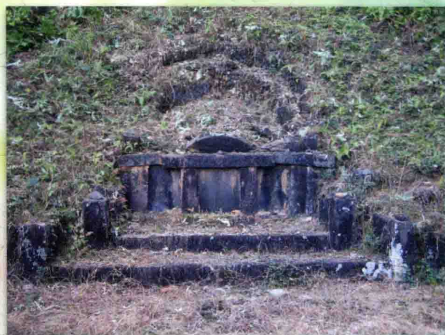
善荣公婆太刘五一娘墓，位于上莒老屋坑，大座人形，立未山丑向。