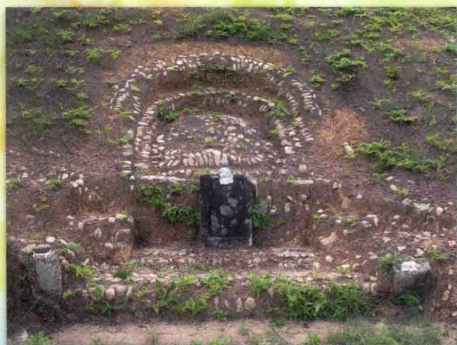
郑贤公墓位于上莒溪上村张屋山。