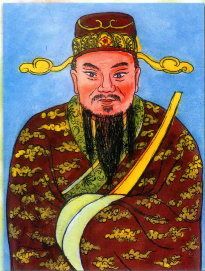
清高公，为靖公五代孙——若水 之独子。生于1133年癸丑岁，时任 汀州路通判，生十子。