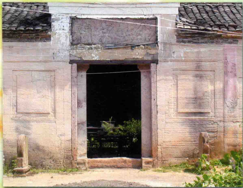
余氏家庙系清高公祠位于长汀县河田镇。