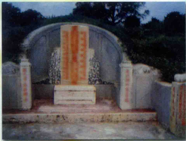
二十三郎公夫妇墓，位于林家坪公王背，即今明春屋背。庚山甲向，笑天龙形