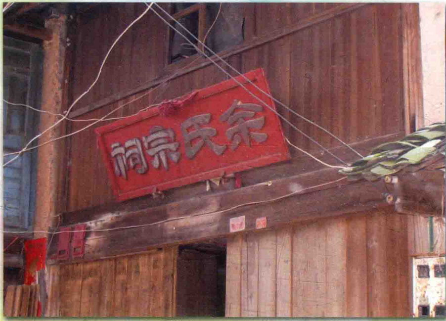
余氏宗祠系振义公祠，位于长汀县河田镇。