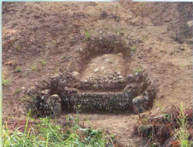
珍荣公墓位于文坊八钱亭口林田背，鸬鹚入水形。