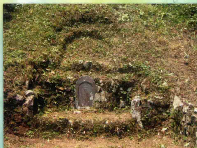
仕荣公墓位于官畲尾岌头畲。