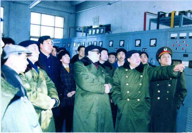
1990年2月27日江泽民主席来杏一联视察工作