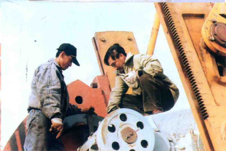
工人在进行抽油机维修保养