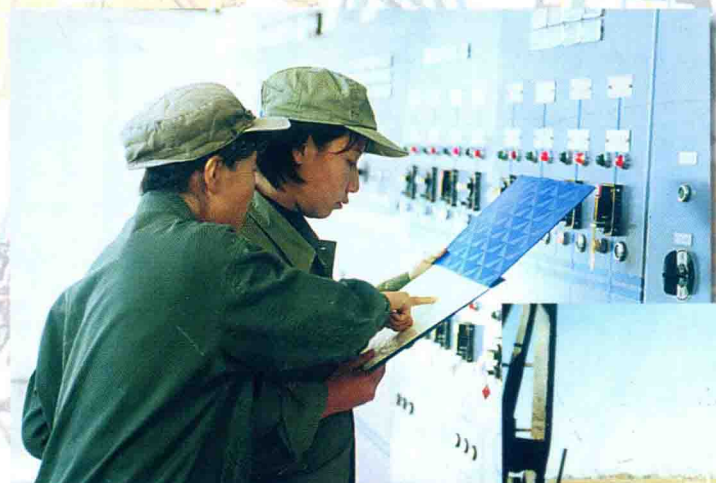
认真核实生产数据