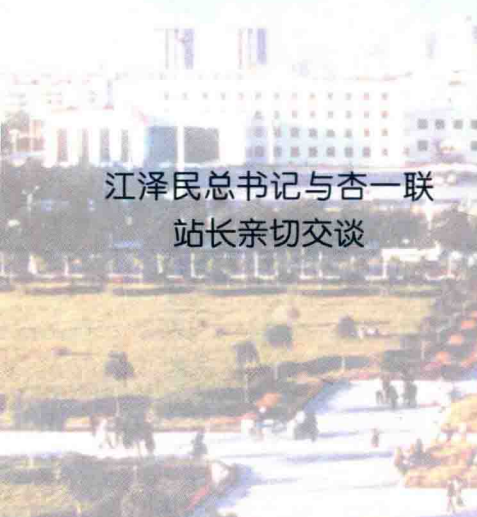
江泽民总书记与杏一联站长亲切交谈