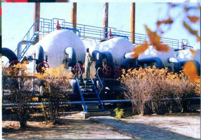
工人在巡查加热炉