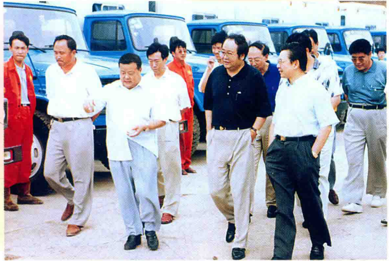
中国石油天然气总公司 有关领导来四厂检查测 试工作