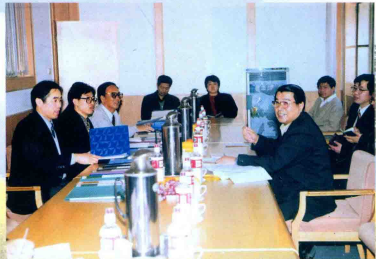
中国长城天津质保中心专家 与厂有关人员座谈