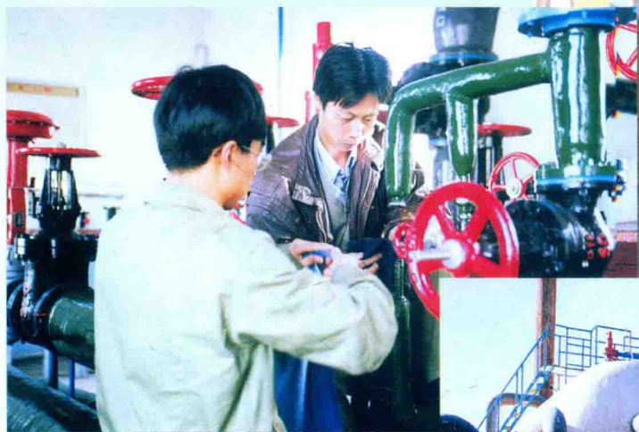
工人在进行设备保养