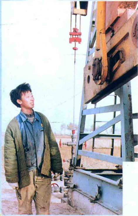
采油工人正在进行抽油机巡查