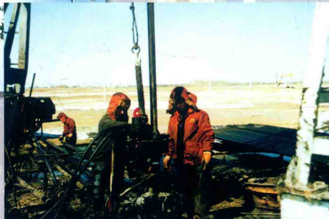
作业工人在起油管