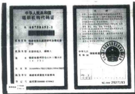
▲ 福建省姓氏源流研究会蒋氏委员会证书和批文