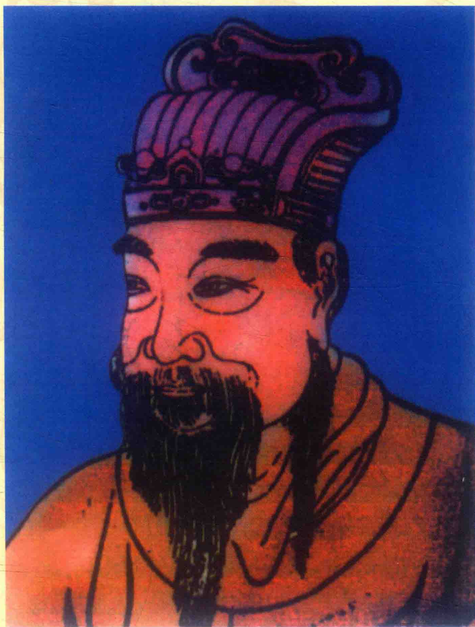
▲ 四十七世祖逡適侯橫公像