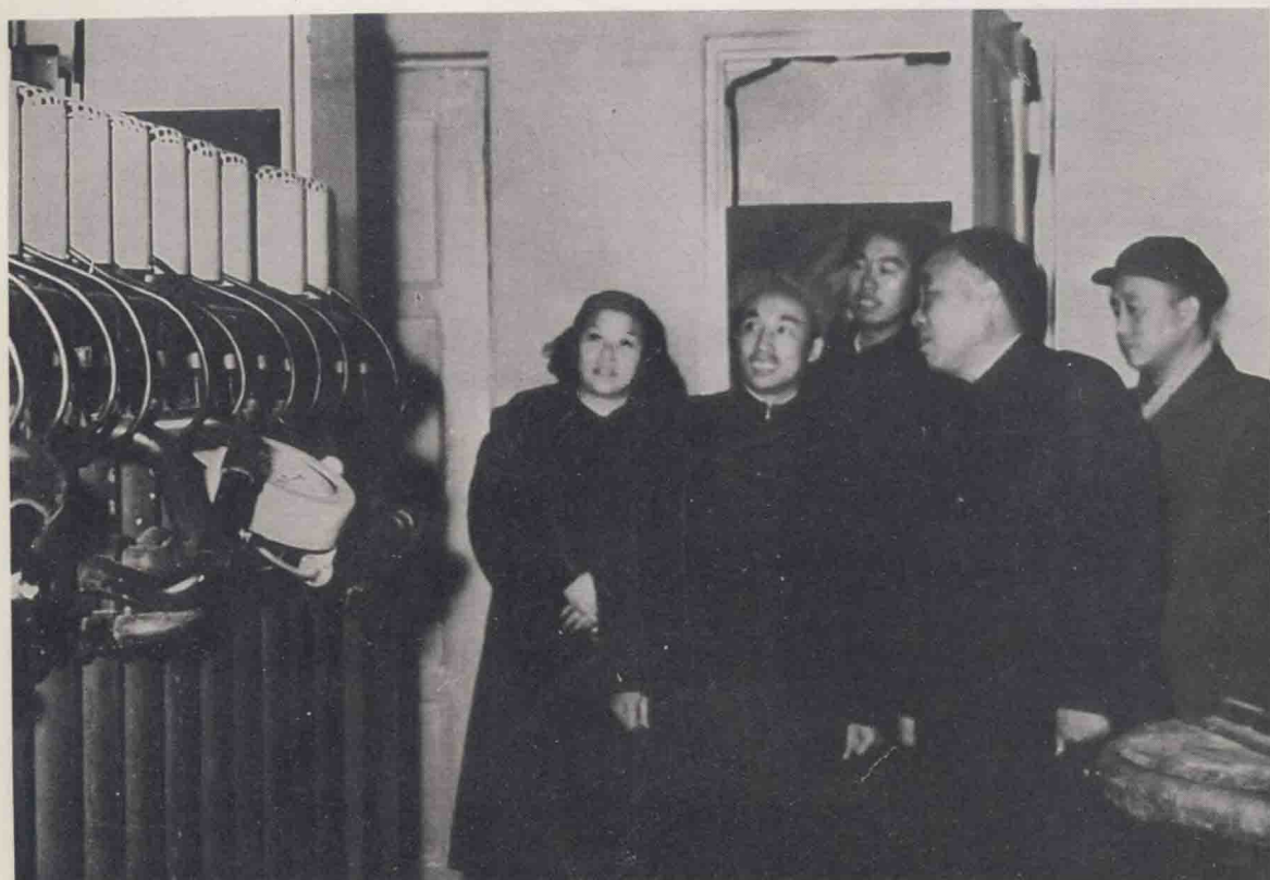
1956年12月11日，朱德同志来我厂视察，图为在洗印车间参观。