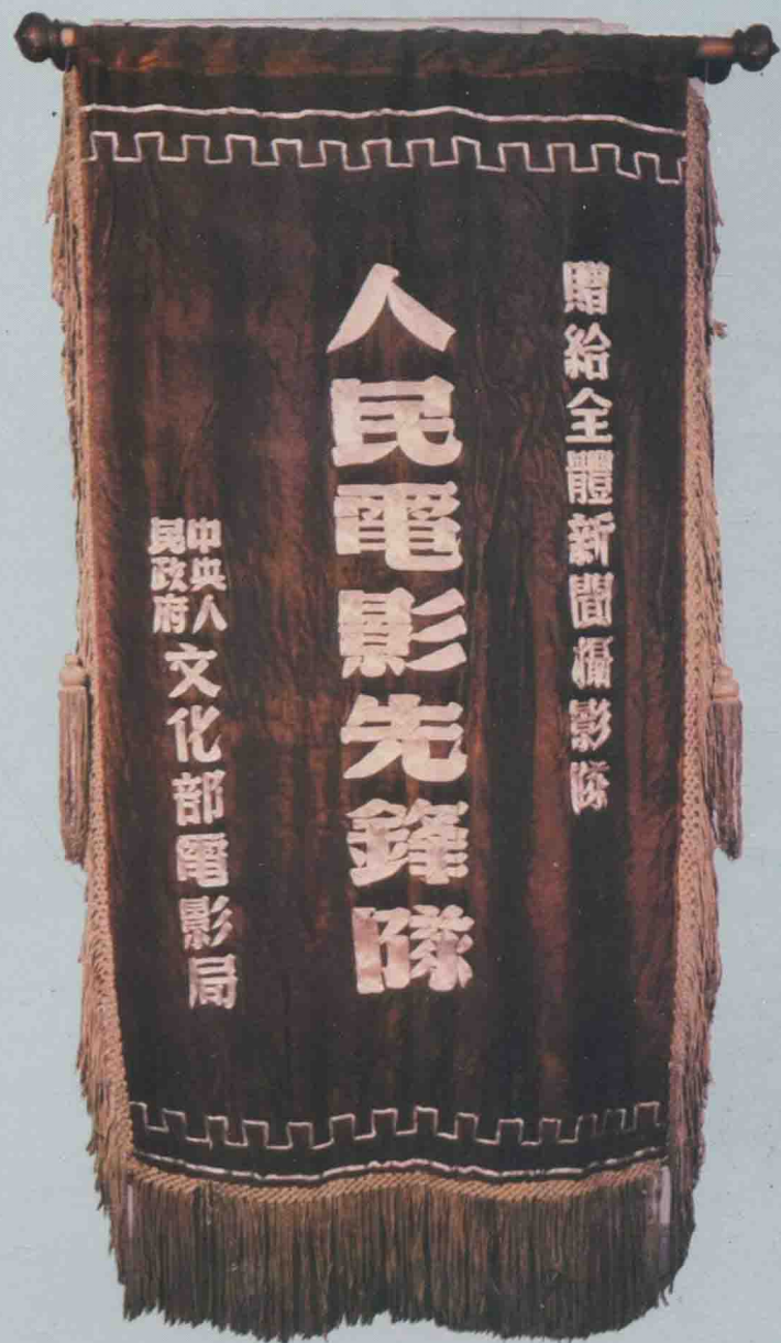
1950年12月31日，中央人 民政府文化部電影局授予我廠 新聞攝影隊的錦旗。