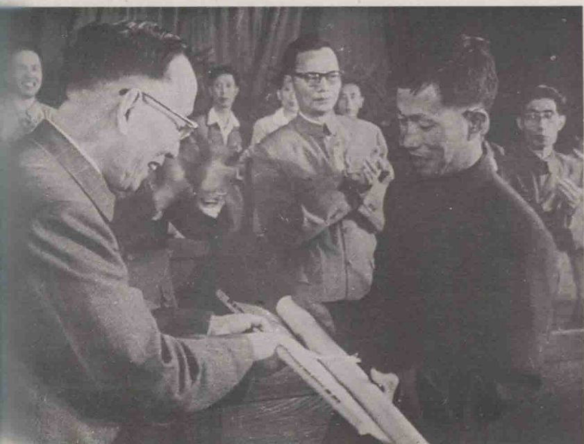
郭沫若同志为我厂影片颁发“百花奖”。