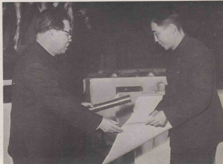
沈雁冰同志为我厂优秀摄影师颁奖。