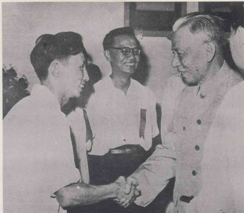
1960年7月22日，刘少奇同志与我厂出席全国文学艺术工作者第三次代表大会的同志亲切握手。