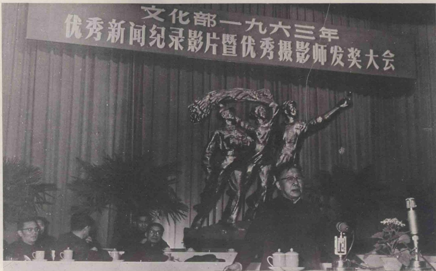
1963年在文化部优秀摄影师发奖大会上陆定一同志讲话。