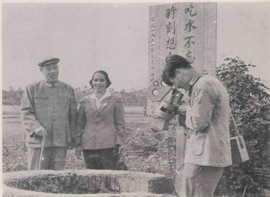
右：我厂摄影师在瑞金沙洲坝，为董必武同志拍摄影片时的工作照。