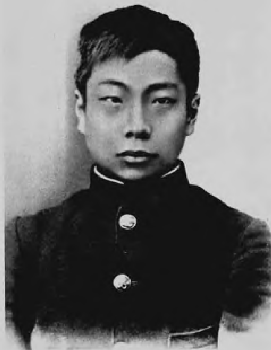
留学日本時肖像（一九〇四年）