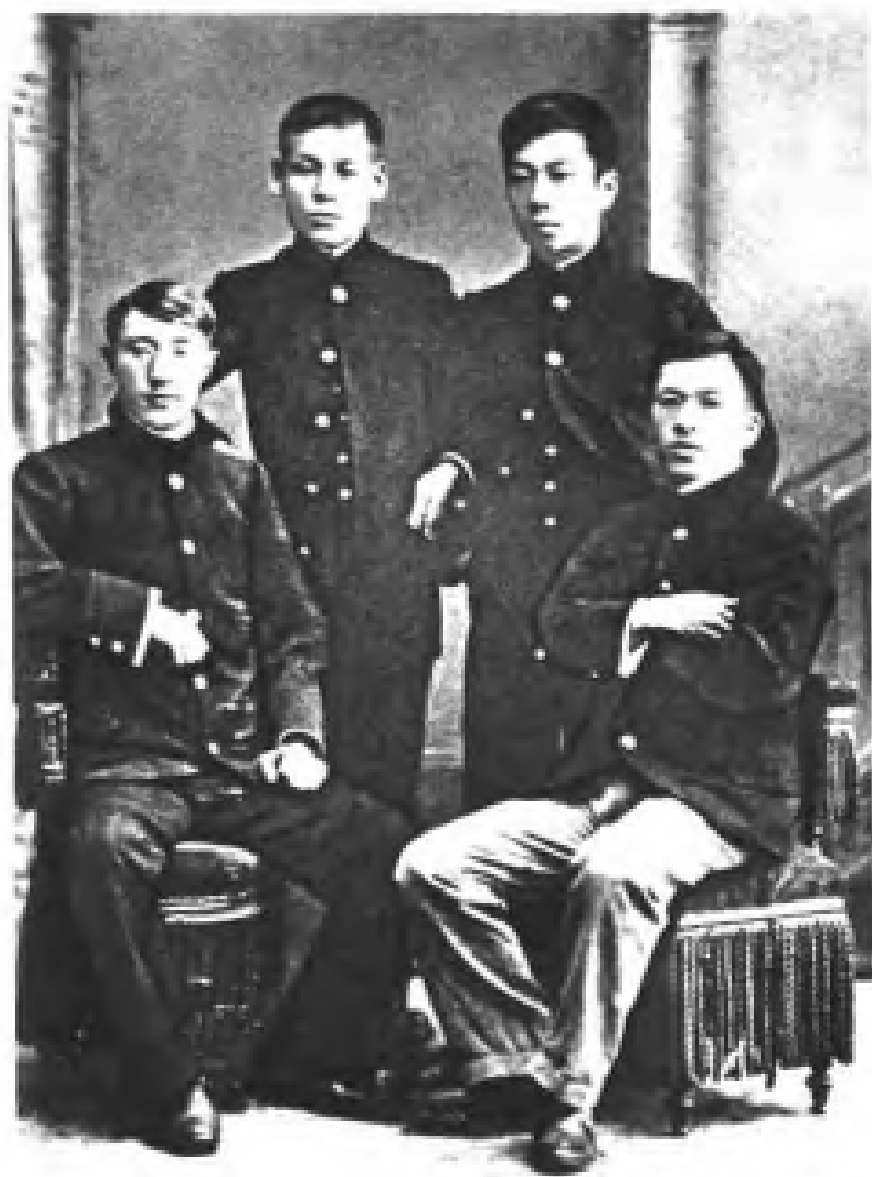
与医校同学合影（右立者为鲁迅先生）