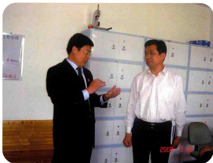
2008年5月市委常委政法委书记赵希胜到法院调研