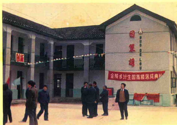
全区计划生育基层基础建设中的国策楼院建设自一九九〇年下半年开始,到一九九二年全区已有 253 个乡镇修建或改建了计划生育国策楼院。 图为新田县金陵乡计生国策楼落成。