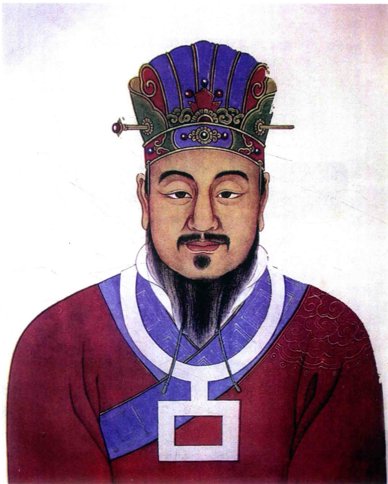
陈姓始祖胡公妫满像