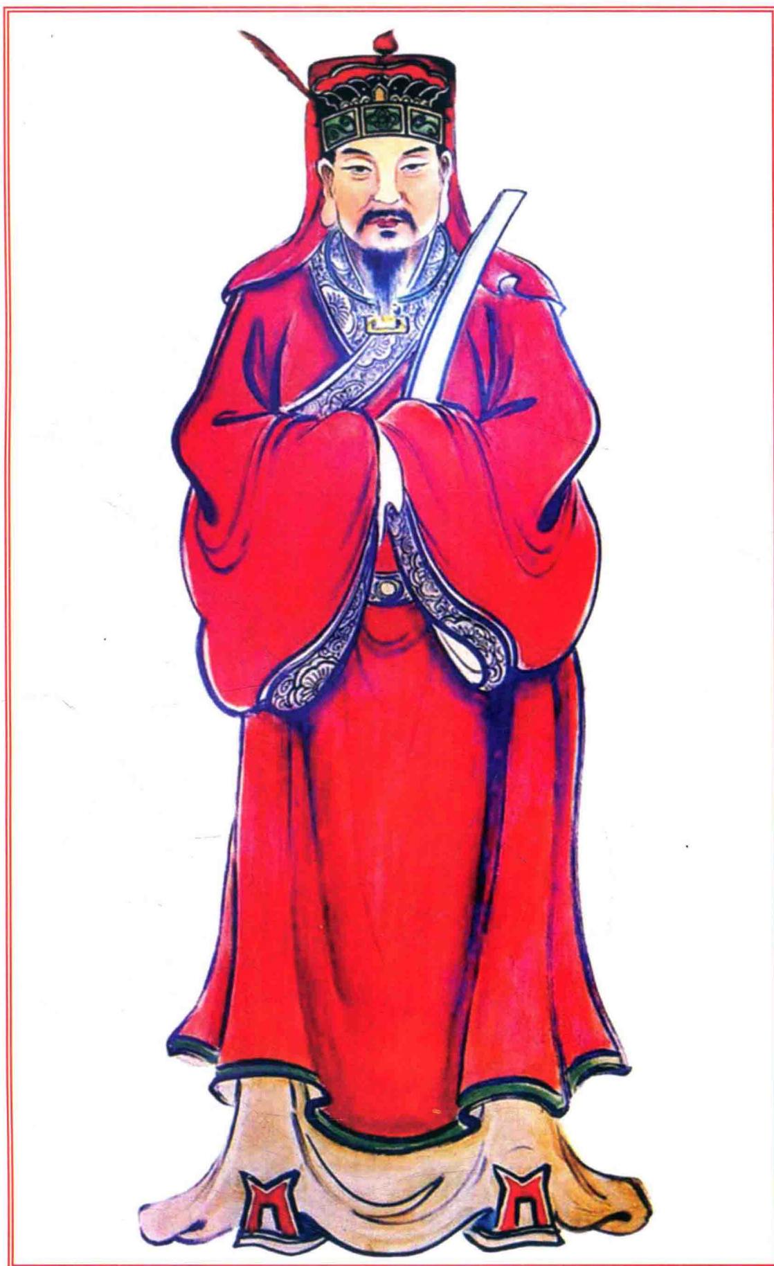
玉湖始祖贈沂國公 仁公