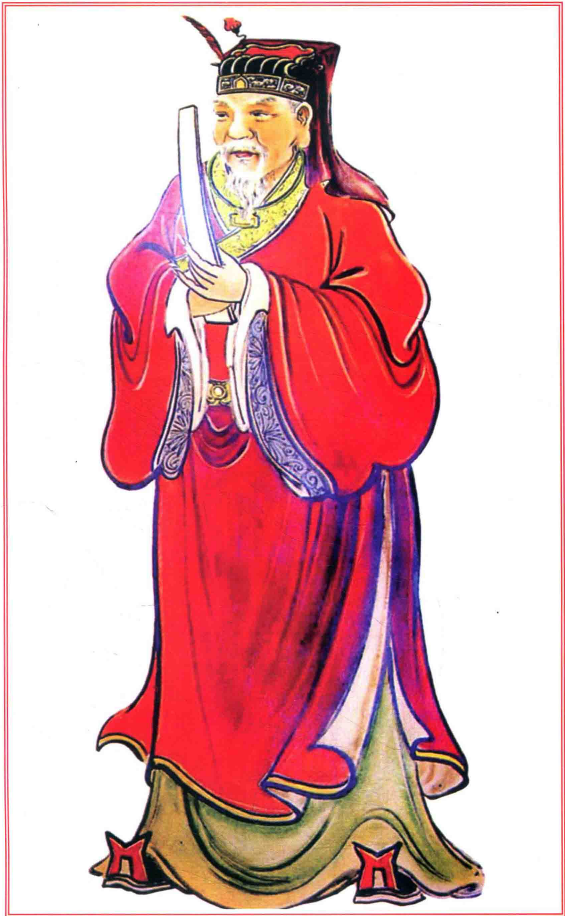
二世贈太師蜀國公 貴公