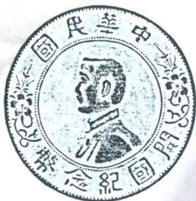
孫中山头像 開國紀念銀元