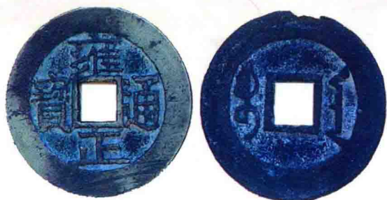
清•雍正通宝 (宝安局)