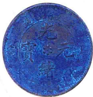
安徽省造 光緒元寶銅幣