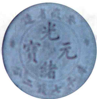
安徽省造 光緒元寶銀元