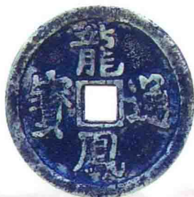
(元末农民起义军钱) 龙凤通宝