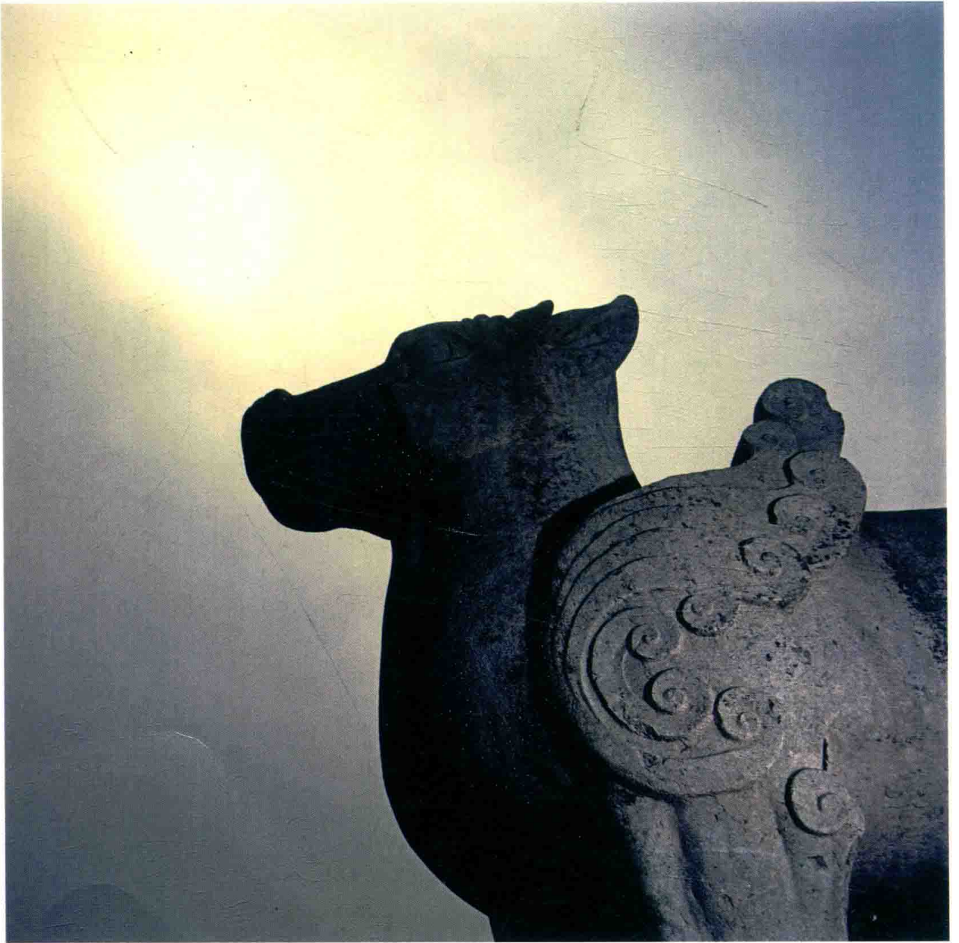
《唐陵》系列之一——唐孝明高皇后（武则天之母）顺陵天禄，陕西咸阳，2008