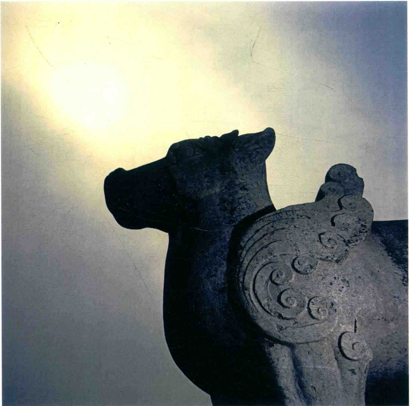
《唐陵》系列之一——唐孝明高皇后（武则天之母）顺陵天禄，陕西咸阳，2008