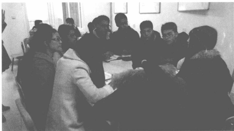
图1-1 学生“线下”讨论中国梦

动实践。与以前单一教师讲授的传统课堂相比，“我的课堂我做主”使学生学习的积极性和主动性明显提高，深度学习场域和环境的塑造，问题导向产生的激烈思想交锋和头脑风暴，促使学生深入思考现实问题，思政课的教学效果明显提高。那么，为什么要对传统思政课教学方式进行改革，思政课翻转课堂是如何具体推行，推行状况如何，老师和学生对翻转课堂的评价又如何呢？