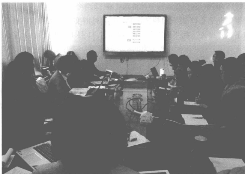
图 1-7 “请进来”——邀请清华大学专家来校为教师培训

政课翻转课堂的改革大潮中，通过教学内容的优化和教学活动的设计，从“授人以鱼”向“授人以渔”转变，使学生在参与思想政治理论课中能认识问题、思考问题和解决问题。