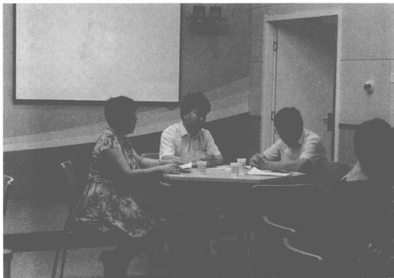
图 1-5 翻转课堂教学研讨会小组分会