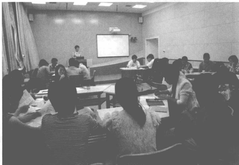
图 1-4 翻转课堂教学研讨会

日，与教学发展中心、教务处和网络技术中心合办了思政课教学改革研讨会，对于四门政治课如何整体推动翻转课堂进行了顶层设计。