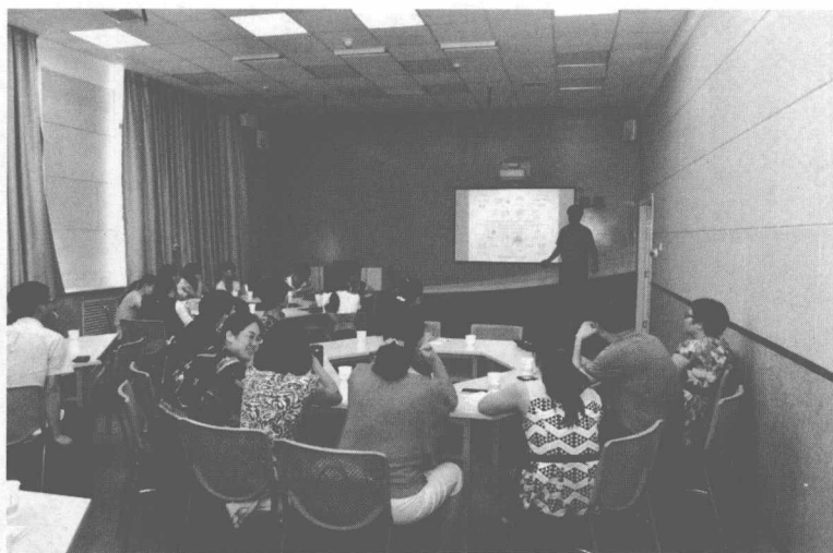
图 1-3 清华大学专家把脉实践

会。针对我院两位老师的尝试和其他老师提出的问题，韩老师进行了把脉，从战略上进行了肯定，从战术上对翻转课堂教学应该注意的三个问题进行了说明，对于本次尝试过程中存在的闪光点和共性问题进行了总结。