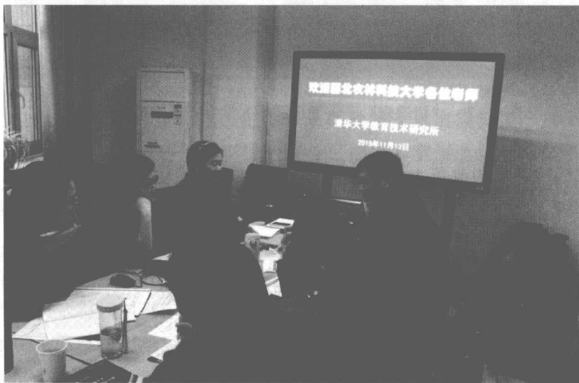
图 1-6 “走出去”——在清华大学接受翻转课堂培训

2015 年秋, 四门思政课整体推动, 在 12 个专业 35 个班级的 1000 多名学生中进行了 12 类次的翻转课堂尝试。针对实施过程中存在的问题, 采取了“走出去”和“请进来”两种形式: 11 月 12—15 日, 学院选派 9 名骨干教师赴清华大学进行了为期 4 天的培训。12 月 25—26 日, 邀请清华大学教育技术研究所两位专家来校为马克思主义学院教师就翻转课堂的教学内容设计、教学活动策划以及网络平台操作技术三个方面进行了培训, 并就思政课课程单元具体进行了实体操作设计, 最后对思政课翻转课堂如何运用 APP (优慕课) 平台做了指导, 大大提高了学生移动学习的能力。