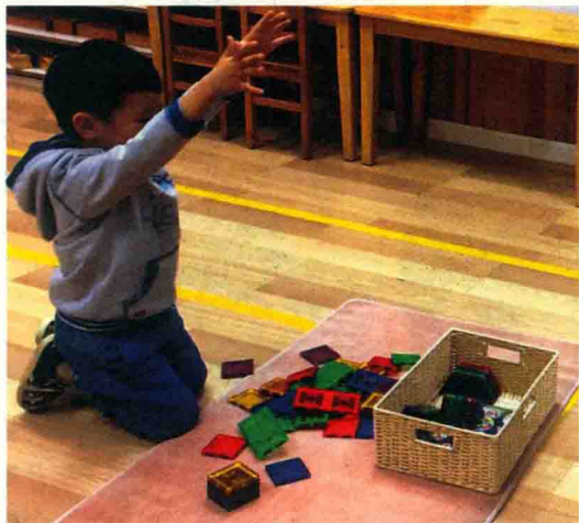
▲ 图1-3 儿童在观察者面前有“人来疯”的表现

自然观察法即研究者对观察情境不作任何控制和干预，而是在自然条件下进行观察和记录。由于这一方法旨在揭示儿童在日常生活中的真实行为，而不需要依赖于他们的自我报告，因此对被观察者的语言表达能力没有要求，所以它非常适用于婴幼儿。当然，自然观察法也有局限性。第一，儿童的有些行为是不常发生的（如：说谎）或不被社会赞许的（如：攻击性行为），这些行为不容易被不熟悉的观察者在自然环境中观察到。第二，在自然环境中，常常会同时发生很多事件，其中的某一个或几个事件会影响儿童的行为，这使得观察者很难查明被观察者行为发生的原因。第