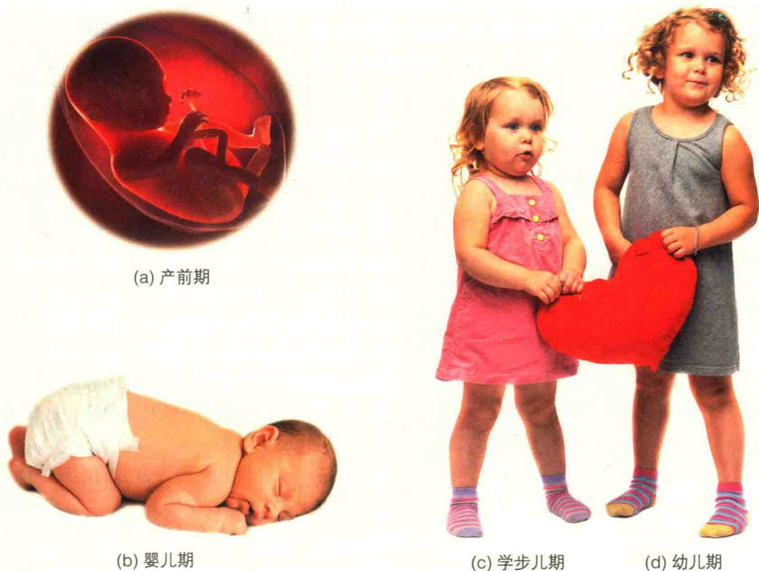
▲ 图 1-2 产前期、婴儿期、学步儿期、幼儿期的儿童