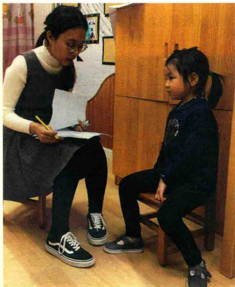
▲ 图1-4 使用调查法研究儿童

临床法和访谈法很相似。研究者往往会向研究对象提供某个任务或刺激，然后要求研究对象作答。在研究对象回答了第一个问题后，研究者接着问第二个问题或者提出一个新的任务来进一步澄清研究对象一开始的回答。尽管研究者对所有研究对象提出的第一个问题都是相同的，但后来研究者就得根据研究对象的回答来决定接下来要问的问题。可见，临床法是把