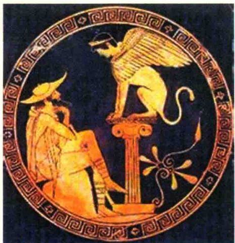
▲ 图 1-1 斯芬克斯

斯芬克斯是希腊神话中一个有一双翅膀、长着狮子躯干、女人头面的怪兽。它每天坐在忒拜城附近的悬崖上，向过路人出一个谜语：“什么东西早晨用四条腿走路，中午用两条腿走路，晚上用三条腿走路？”如果路人猜错，就会被它害死。一天，路过的俄狄浦斯猜中了谜底是人，斯芬克斯羞愧地跳崖而死。这就是著名的“斯芬克斯之谜”。