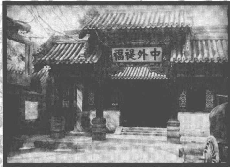
清政府总理各国事务衙门