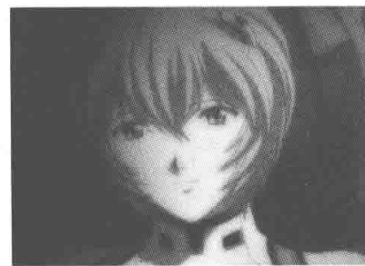
▲ 新剧场版（2007 年）

对比来看，新生代的日系美少女画风不再生硬，显得更加讨喜，同样其中又包含了更多的设计感，让读者能更容易体会到流畅、圆滑、利落、弹性等抽象美感，那么美少女属性中又有哪些是亘古不变的呢？下面接着介绍。