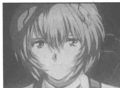
▲ 旧剧场版（2003 年）