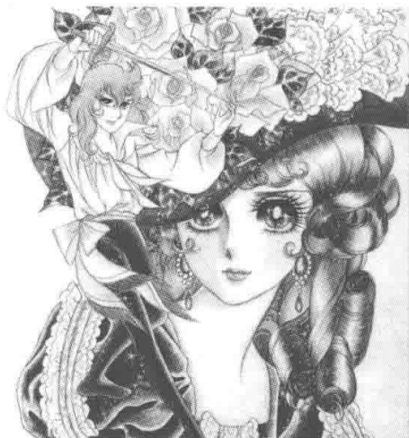
▲ 《凡尔赛玫瑰》池田理代子