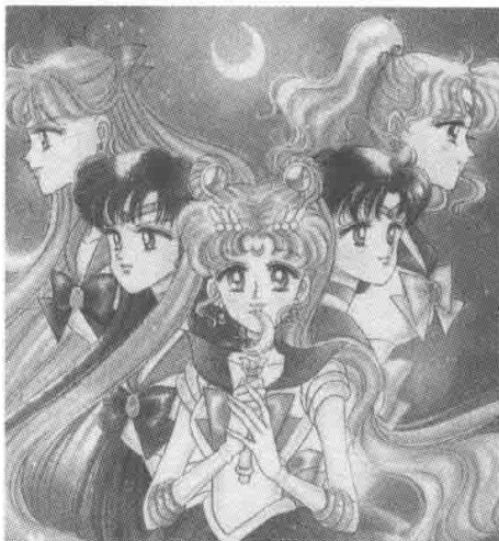
▲ 《美少女战士》武内直子