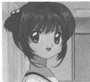
▲ TV 作品