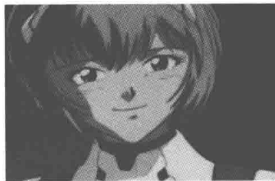
▲ TV 版（1997 年）