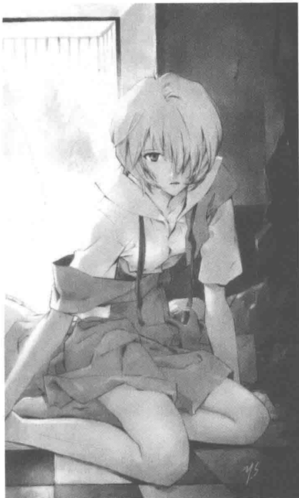
▲ 2005 年官方日历