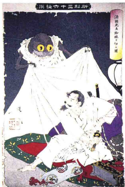
◆ 月冈芳年《新形三十六怪撰·源赖光杀土蜘蛛》中的源赖光与土蜘蛛。