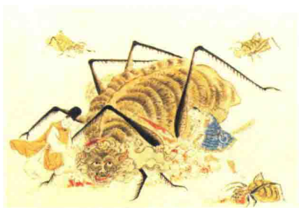
◆ 镰仓时代的《土蜘蛛草纸绘卷》。